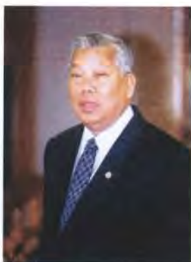
นายสมัคร สุนทรเวช

เมื่อวันที่ ๙ กันยายน ๒๕๕๑ ศาลรัฐธรรมนูญมีมติเอกฉันท์ วินิจฉัยให้นายสมัครฯ พ้นจากตำแหน่งนายกรัฐมนตรี ในคดีจัดรายการ “ชิมไปบ่นไป” และ “ยกโขยง ๖ โมงเช้า” ซึ่งถือว่าเป็นคุณสมบัติต้องห้าม ๔ ต่อมาที่ประชุมสภาผู้แทนราษฎรได้เลือกนายสมชาย วงศ์สวัสดิ์ เป็นนายกรัฐมนตรี และได้จัดตั้งคณะรัฐมนตรี เมื่อวันที่ ๒๔ กันยายน ๒๕๕๑ ต่อมา เมื่อวันที่ ๖ ตุลาคม ๒๕๕๑ พธม. ได้ชุมนุมประท้วงหน้าอาคารรัฐสภา เพื่อกดดันให้คณะรัฐมนตรีเข้าแถลงนโยบายต่อรัฐสภาในวันรุ่งขึ้นได้ ตำรวจจึงได้เข้าสลายการชุมนุม เพื่อเปิดทางเข้าออกอาคารรัฐสภา เหตุการณ์ดังกล่าวได้มีผู้เสียชีวิต ๑ - ๒ คน และได้รับบาดเจ็บจำนวนมาก