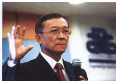
ศ. ร.ต.อ. ดร.ปุระชัย เปี่ยมสมบูรณ์

ดังนั้น เมื่อมีการจัดตั้งรัฐบาล ปัญหาที่ต้องเริ่มแก้ คือ ปัญหาด้านเศรษฐกิจ ซึ่งเป็นเรื่องที่สำคัญมากที่สุดเรื่องหนึ่ง โดยเฉพาะปัญหาปากท้องของประชาชนซึ่งเป็นเรื่องที่สามารถโค่นล้มรัฐบาลมาได้หลายรัฐบาลแล้ว ดังนั้น สิ่งที่ประชาชนคาดหวังมากที่สุด ณ ตอนนี้ก็คืมาตรการการช่วยเหลือเพื่อลดค่าครองชีพให้แก่ประชาชน ไม่ว่าจะเป็นเรื่องสินค้าเครื่องใช้อุปโภคบริโภคในชีวิตประจำวัน ราคาค่าน้ำค่าไฟ ค่าน้ำมันต่าง ๆ เป็นต้น