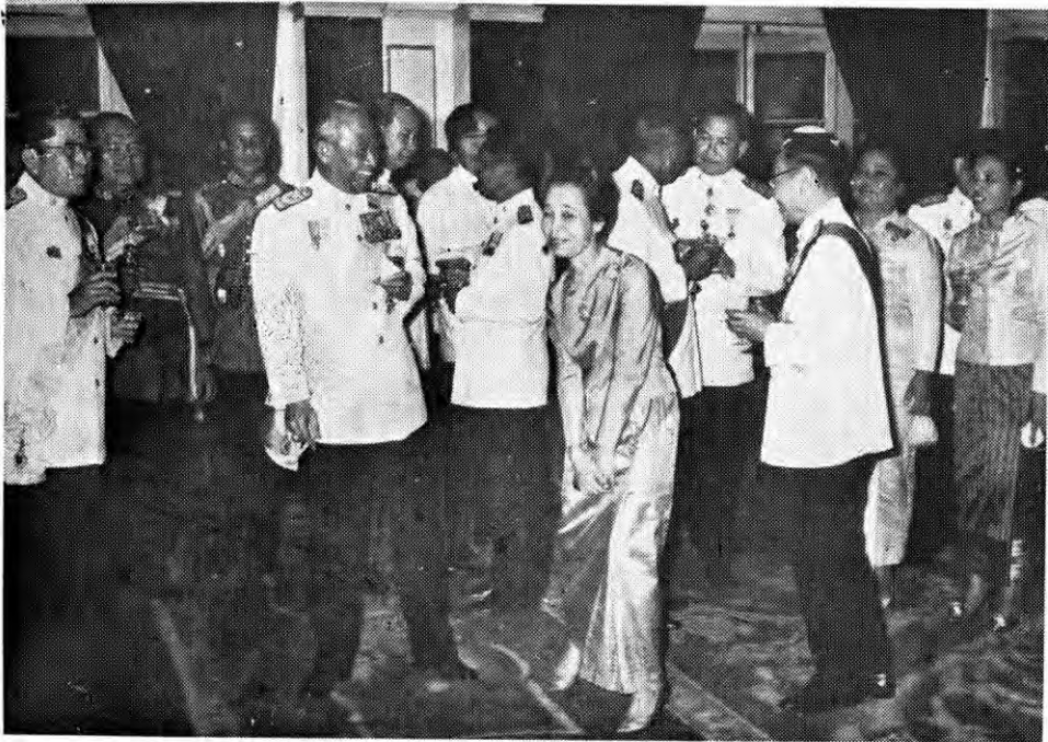
ร่วมในงานเลี้ยงรับรองเนื่องในวันเฉลิมพระชนมพรรษา ณ ตึกสันติไมตรี ทำเนียบรัฐบาล วันที่ ๕ ธันวาคม ๒๕๑๒