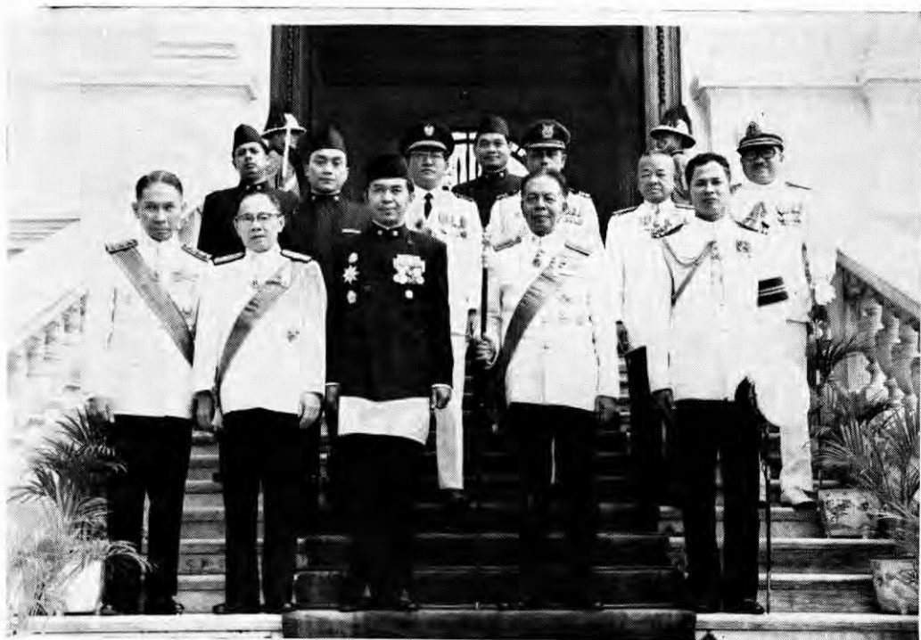
นำเอกอัครราชทูตอินโดนีเซียเจ้าฟ้าถวายเป็นศาสน์ตราตั้ง ณ พระที่นั่ง จักรมहाปราสาท เมื่อที่ ๑๕ กันยายน ๒๕๑๒