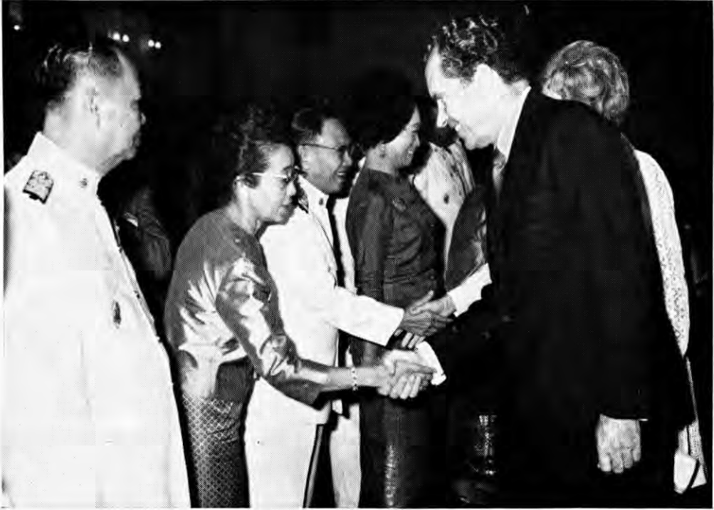
ร่วมในงานสโมสรสันนิบาตที่รัฐบาลจัดขึ้นเป็นเกียรติแก่ ฯพณฯ ริชาร์ด เอ็ม. นิกสัน ประธานาธิบดีสหรัฐและภริยา ตึกสันติไมตรี ทำเนียบรัฐบาล วันที่ ๒๕ กรกฎาคม ๒๕๑๒