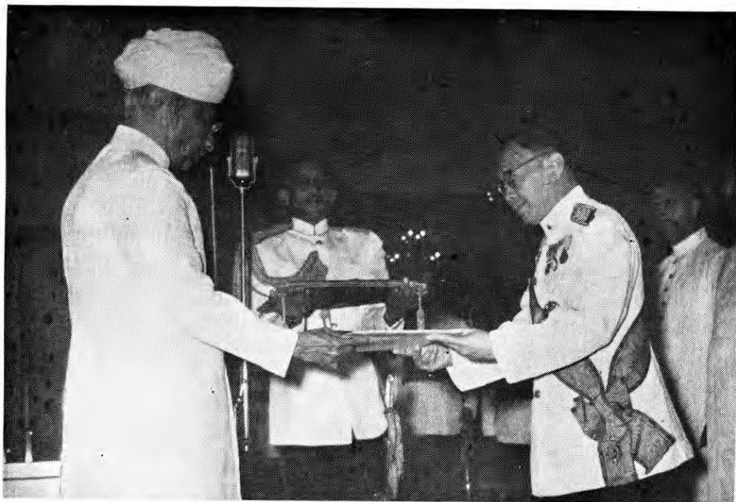
๒๕ ๒๗ ๒๕๐๖ ๒๕๐๖ เข้าเฝ้าพระศาสน์ตราตั้งเป็นเอกอัครราชทูตไทยประจำประเทศอินเดียต่อ ประธานาธิบดีราชา กฤษณ์ ณ เมื่อวันที่ ๒ พฤศจิกายน ๒๕๐๖ ณ ทำเนียบประธานาธิบดี กรุงนิวเดลี