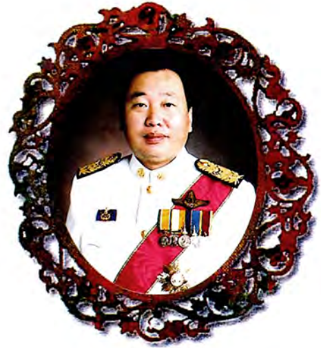
นายอุชาติ ตันเจริญ รองประธานสภาผู้แทนราษฎร คนที่ ๒