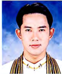
นายอิทธิพล คุณปลื้ม เลขาธิการคณะกรรมการธิการ