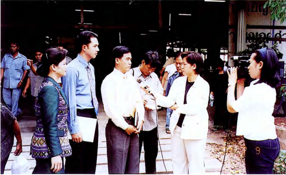
คณะกรรมการเดินทางไปศึกษาดูงานและร่วมฟังการประชาพิจารณ์ กรณีการอนุญาตประกอบกิจการโรงฆ่าและชำแหละสุกร ณ จังหวัดสมุทรสงคราม เมื่อวันที่ ๙ กรกฎาคม ๒๕๕๔