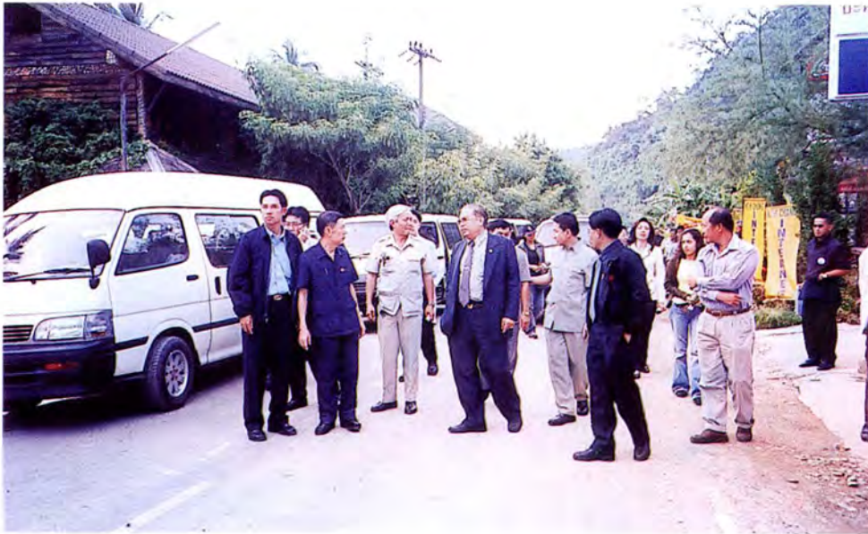
คณะกรรมการเดินทางไปศึกษาดูงานและตรวจสอบภาพข้อเท็จจริงกรณีการก่อสร้างท่าเทียบเรือ บริเวณกิ่งอำเภอเกาะช้าง จังหวัดตราด เมื่อวันที่ ๒๖ ตุลาคม ๒๕๕๔