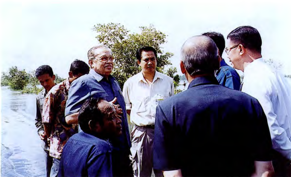
คณะกรรมการเดินทางไปศึกษาดูงานและตรวจสอบภาพข้อเท็จจริงกรณีโครงการกำจัดขยะมูลฝอยของเทศบาลนครอุบลราชธานี ณ จังหวัดอุบลราชธานี เมื่อวันที่ ๑๔ กันยายน ๒๕๕๔