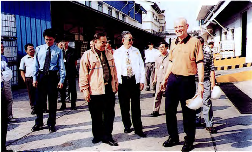
คณะกรรมการเดินทางไปศึกษาดูงานและตรวจสภาพสิ่งแวดล้อม ณ พื้นที่ในจังหวัดสมุทรสาคร เมื่อวันที่ ๑๘ มกราคม ๒๕๔๕