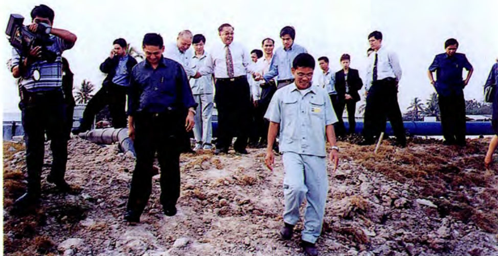
คณะกรรมการเดินทางไปศึกษาดูงานและตรวจสภาพข้อเท็จจริง ณ โรงงานฟอกย้อมผ้า จังหวัดระยอง เมื่อวันที่ ๒๕ มกราคม ๒๕๔๕