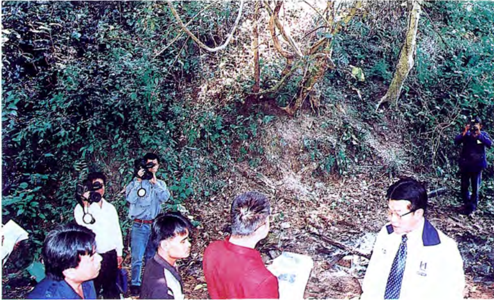
คณะกรรมการการเดินทางไปศึกษาดูงานและตรวจสภาพป่าไม้ ณ อุทยานแห่งชาติน้ำตกแม่สุรินทร์ จังหวัดแม่ฮ่องสอน เมื่อวันที่ ๑๓ ธันวาคม ๒๕๕๕