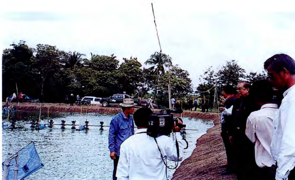
คณะกรรมการเดินทางไปศึกษาดูงานและตรวจสอบภาพข้อเท็จจริงบริเวณพื้นที่ทำการเกษตรซึ่งได้รับผลกระทบจากการเลี้ยงกุ้งกุลาดำ ณ จังหวัดนครปฐม เมื่อวันที่ ๒๑ กันยายน ๒๕๔๔