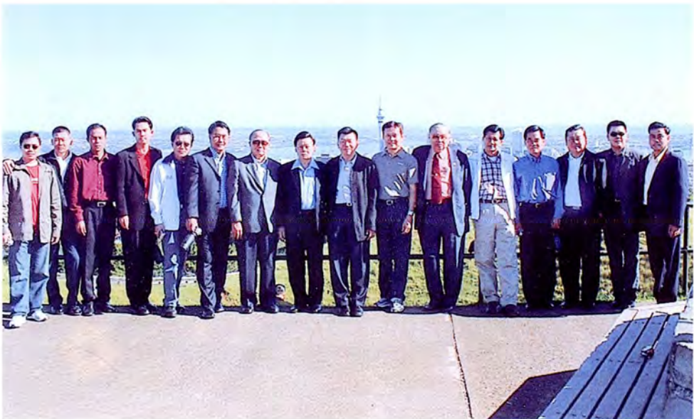
คณะกรรมการเดินทางไปศึกษาดูงานเกี่ยวกับด้านทรัพยากรธรรมชาติและสิ่งแวดล้อม ประเทศนิวซีแลนด์ ระหว่างวันที่ ๑๔ - ๒๒ มกราคม ๒๕๕๖