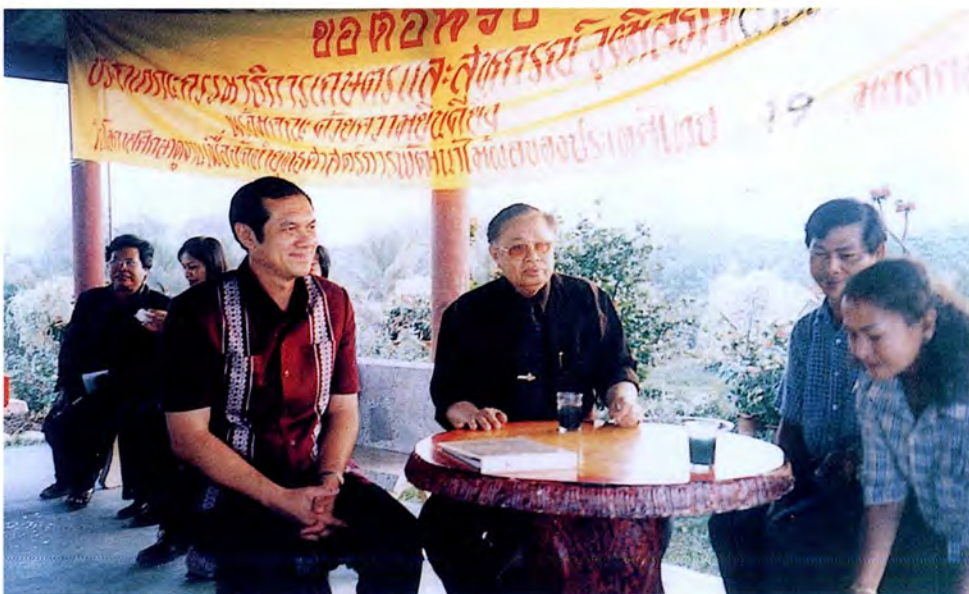
คณะกรรมการเดินทางไปศึกษาดูงานและตรวจสภาพข้อเท็จจริงเกี่ยวกับโครงการบำบัดน้ำเสียและโครงการกำจัดขยะของจังหวัดชัยนาท ณ จังหวัดชัยนาท เมื่อวันที่ ๑๙ มกราคม ๒๕๕๕