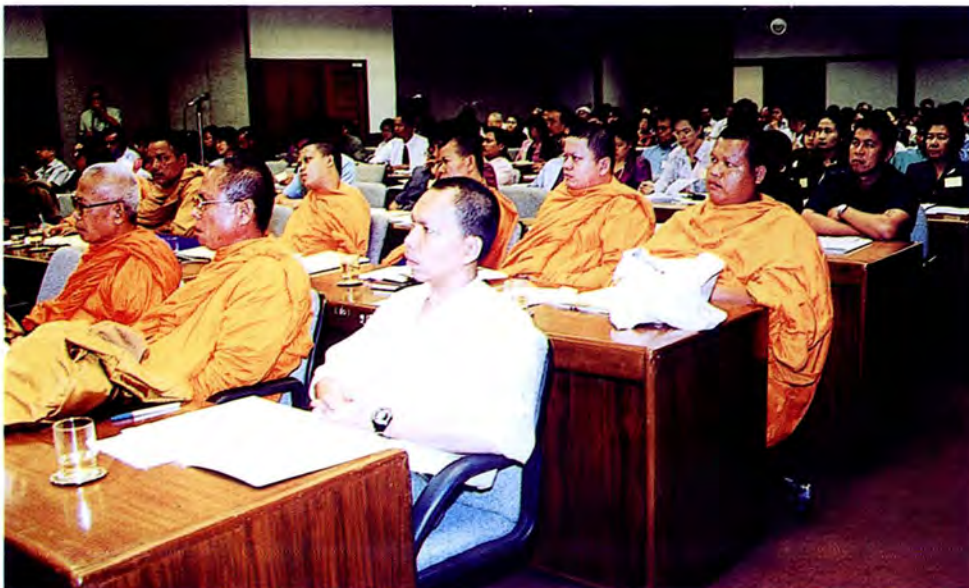
คณะกรรมการ จัดสัมมนาเรื่อง “ปัญหามลพิษทางอากาศจากเตาเผาศพ” ณ ห้องประชุม คณะกรรมการ หมายเลข ๒๑๓ - ๒๑๖ ชั้น ๒ อาคารรัฐสภา ๒ เมื่อวันที่ ๒๑ พฤษภาคม ๒๕๔๕