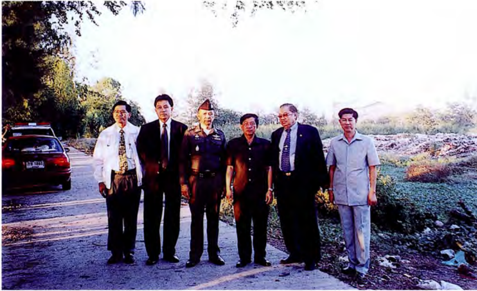
คณะกรรมการเดินทางไปศึกษาดูงานและตรวจสอบภาพข้อเท็จจริงบริเวณพื้นที่ใช้ฝังกลบขยะของอำเภออุ้มทอง จังหวัดสุพรรณบุรี เมื่อวันที่ ๒๑ ธันวาคม ๒๕๔๔