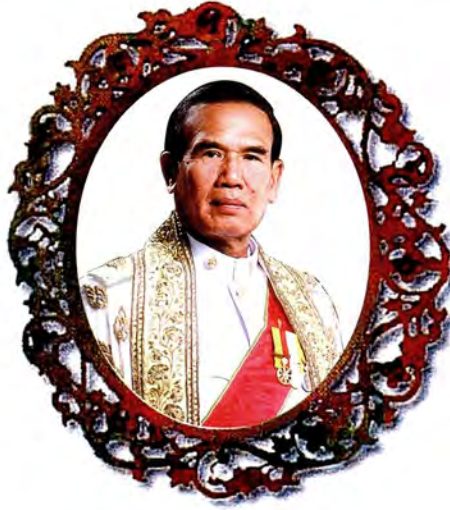
นายอุทัย พิมพ์ใจชน ประธานรัฐสภาและประธานสภาผู้แทนราษฎร