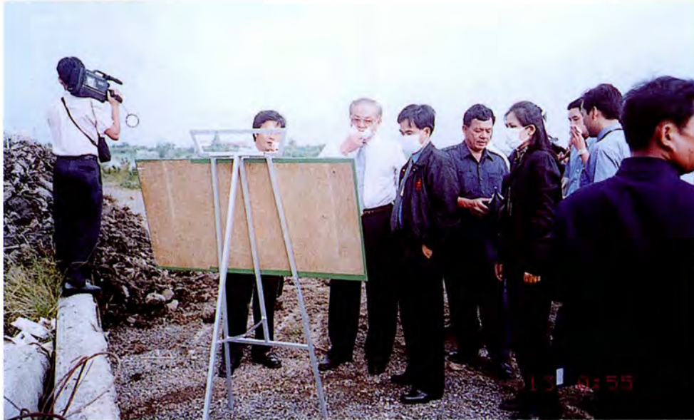
คณะกรรมการเดินทางไปศึกษาดูงานและตรวจสอบภาพข้อเท็จจริงเกี่ยวกับพื้นที่ที่ใช้ในการ ฝังกลบขยะของเทศบาลนครนนทบุรี ณ จังหวัดนนทบุรี เมื่อวันที่ ๒ พฤศจิกายน ๒๕๔๔