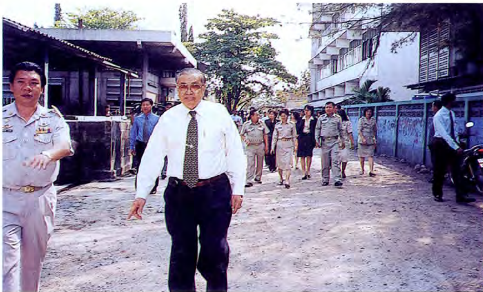
คณะกรรมการการเดินทางไปศึกษาดูงานและตรวจสภาพโรงฆ่าสัตว์แห่งเก่าของเทศบาลเมืองสระบุรี เมื่อวันที่ ๒๗ มกราคม ๒๕๕๖