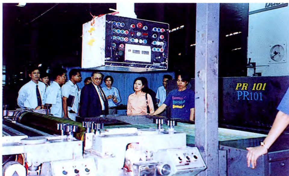
คณะกรรมการเดินทางไปศึกษาดูงานเกี่ยวกับเทคโนโลยีที่ใช้ในการทิ้งกากขยะมีพิษ ณ จังหวัดระยอง เมื่อวันที่ ๒๕ มกราคม ๒๕๔๕