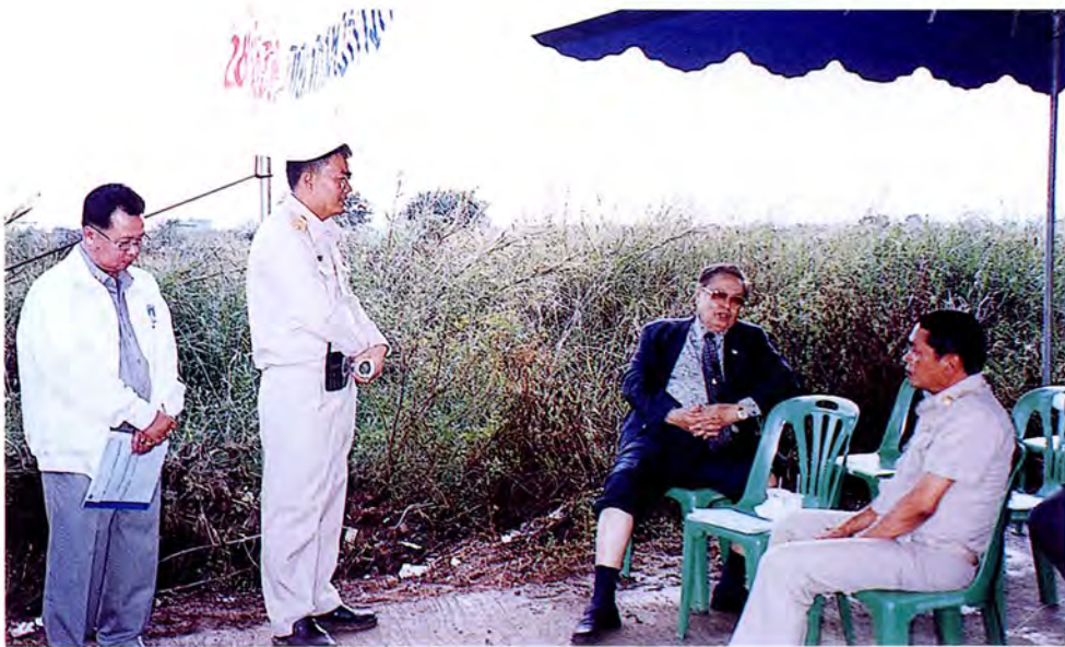
คณะกรรมการเดินทางไปศึกษาดูงานและตรวจสอบภาพข้อเท็จจริงบริเวณพื้นที่ที่ใช้ฝังกลบขยะ ของเทศบาลในเขตอำเภอนครหลวง จังหวัดพระนครศรีอยุธยา เมื่อวันที่ ๑๓ ธันวาคม ๒๕๕๔