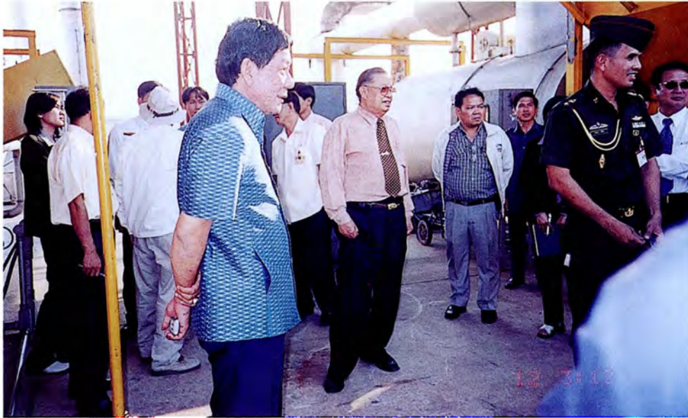
คณะกรรมการเดินทางไปศึกษาดูงานและตรวจสภาพข้อเท็จจริงเกี่ยวกับระบบการกำจัดน้ำเสียและกำจัดขยะของโรงเรียนนายร้อย จปร. จังหวัดนครนายก เมื่อวันที่ ๒๑ กุมภาพันธ์ ๒๕๕๕