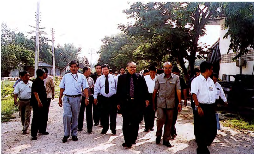
คณะกรรมการเดินทางไปศึกษาดูงานและตรวจสภาพข้อเท็จจริงกรณีการปล่อยน้ำเสีย ของบริษัท สยามพรหมประทาน จำกัด เป็นเหตุให้ราษฎรในพื้นที่และบริเวณใกล้เคียงได้รับความ เดือดร้อน ณ จังหวัดเชียงใหม่ เมื่อวันที่ ๑๙ ตุลาคม ๒๕๕๔