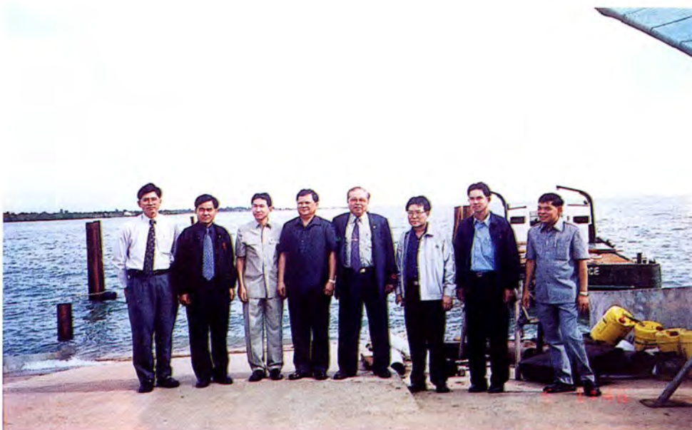
คณะกรรมการเดินทางไปศึกษาดูงานและตรวจสอบภาพข้อเท็จจริงกรณีการก่อสร้างท่าเทียบเรือ บริเวณกิ่งอำเภอเกาะช้าง จังหวัดตราด เมื่อวันที่ ๒๖ ตุลาคม ๒๕๕๔