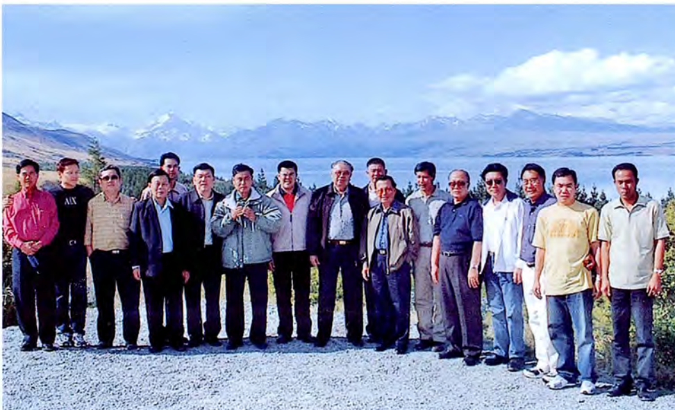
คณะกรรมการเดินทางไปศึกษาดูงานเกี่ยวกับด้านทรัพยากรธรรมชาติและสิ่งแวดล้อม ณ ประเทศนิวซีแลนด์ ระหว่างวันที่ ๑๔ - ๒๒ มกราคม ๒๕๔๖