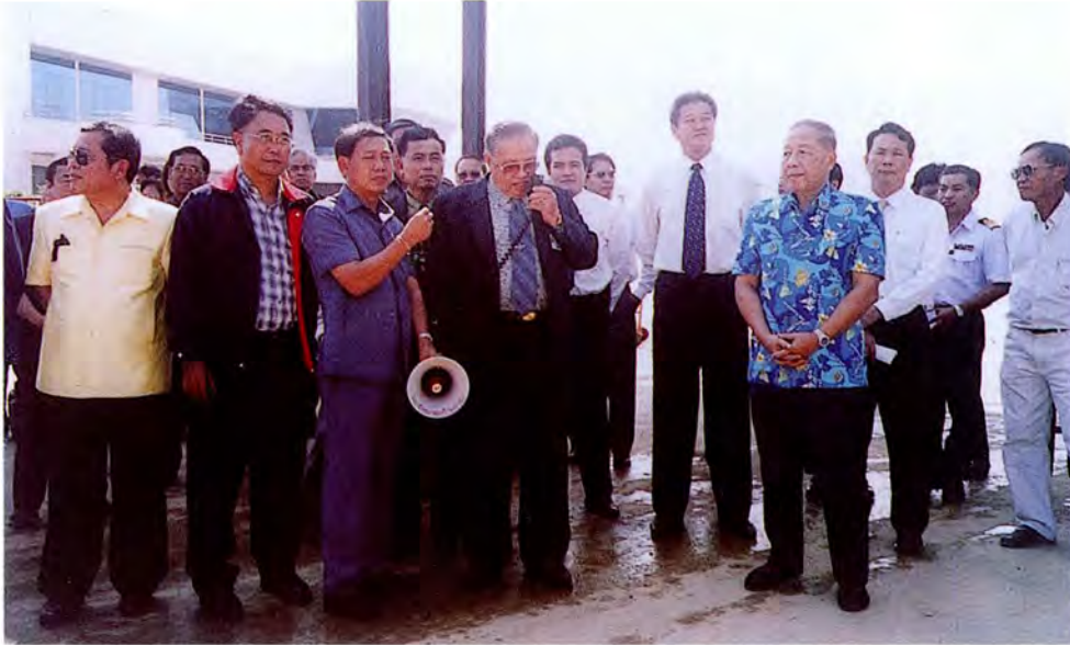
คณะกรรมการเดินทางไปศึกษาดูงานและตรวจสภาพข้อเท็จจริงกรณีการสร้างโรงกลั่น น้ำมันและการสร้างโกดังเก็บน้ำมันดิบ ณ จังหวัดเพชรบุรี เมื่อวันที่ ๑๒ ตุลาคม ๒๕๕๔