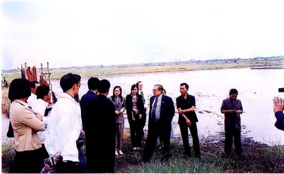
คณะกรรมการเดินทางไปศึกษาดูงานและตรวจสอบภาพข้อเท็จจริงบริเวณพื้นที่ที่ใช้ฝังกลบขยะ ณ จังหวัดพระนครศรีอยุธยา เมื่อวันที่ ๑๓ ธันวาคม ๒๕๕๔