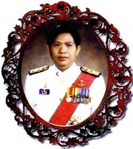
นายสมศักดิ์ ปริศนานันทกุล รองประธานสภาผู้แทนราษฎร คนที่หนึ่ง