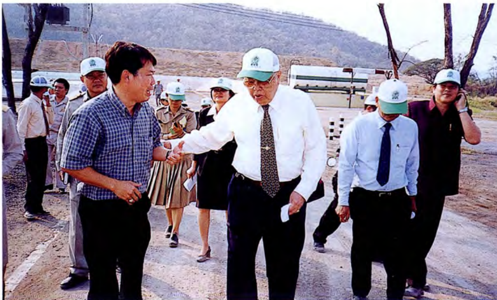
คณะกรรมการเดินทางไปศึกษาดูงานและตรวจสอบสภาพข้อเท็จจริง ณ บริเวณพื้นที่ที่ใช้ฝังกลบ ขยะของบริษัท เบตเตอร์เวิลด์กรีน จำกัด จังหวัดสระบุรี เมื่อวันที่ ๒๗ มกราคม ๒๕๕๖