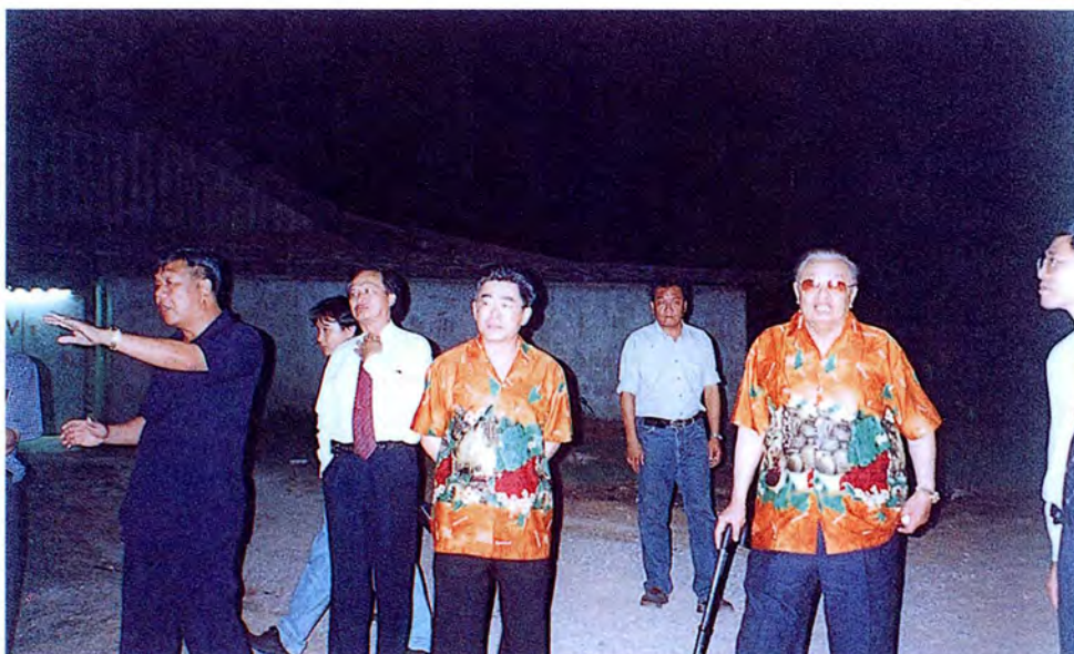
คณะกรรมการเดินทางไปศึกษาดูงานและตรวจสอบภาพข้อเท็จจริงกรณีปล่อยน้ำเสียจากฟาร์มเลี้ยงสุกรในพื้นที่จังหวัดราชบุรี เมื่อวันที่ ๒๒ กุมภาพันธ์ ๒๕๔๕