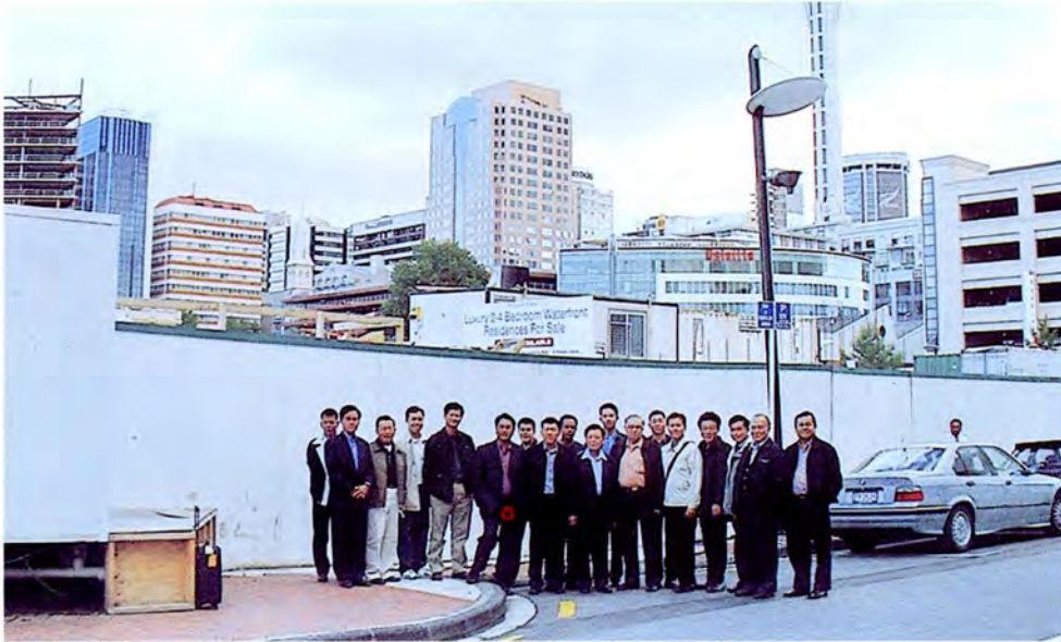
คณะกรรมการเดินทางไปศึกษาดูงานเกี่ยวกับด้านทรัพยากรธรรมชาติและสิ่งแวดล้อม ประเทศนิวซีแลนด์ ระหว่างวันที่ ๑๔ - ๒๒ มกราคม ๒๕๕๖