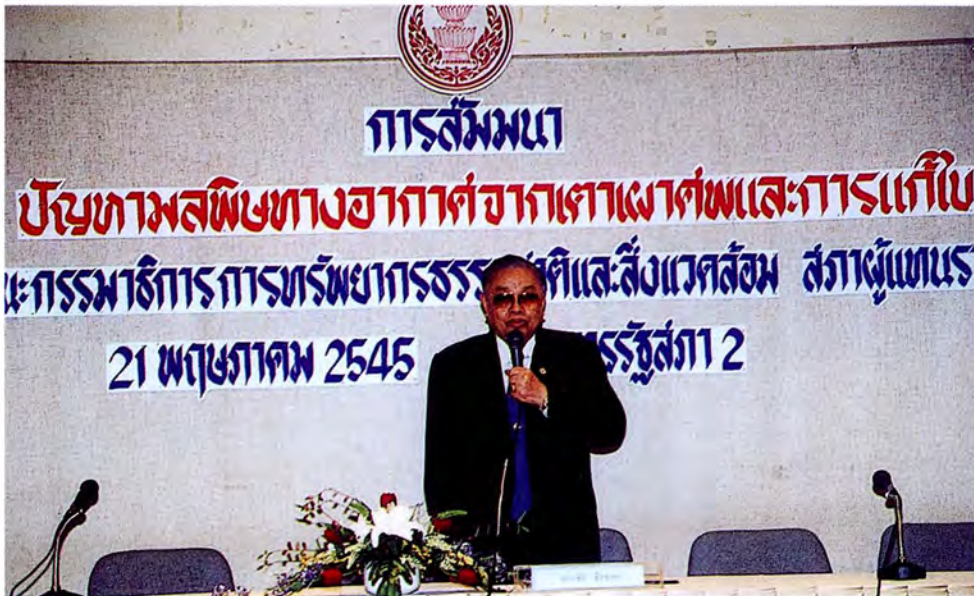
คณะกรรมการ จัดสัมมนาเรื่อง “ปัญหามลพิษทางอากาศจากเตาเผาศพ” ณ ห้องประชุม คณะกรรมการ หมายเลข ๒๑๓ - ๒๑๖ ชั้น ๒ อาคารรัฐสภา ๒ เมื่อวันที่ ๒๑ พฤษภาคม ๒๕๔๕