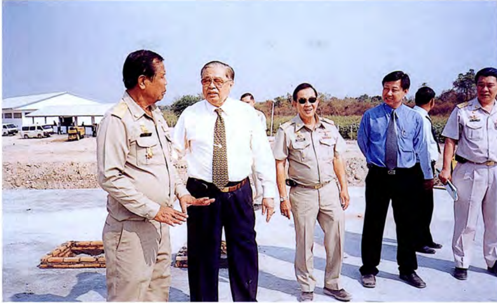
คณะกรรมการเดินทางไปตรวจสอบสภาพข้อเท็จจริงเกี่ยวกับการก่อสร้างโรงฆ่าสัตว์แห่งใหม่ ของเทศบาลเมืองสระบุรี จังหวัดสระบุรี เมื่อวันที่ ๒๗ มกราคม ๒๕๕๖