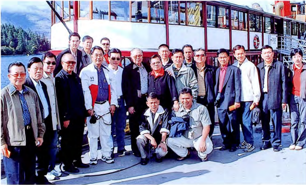
คณะกรรมการเดินทางไปศึกษาดูงานเกี่ยวกับด้านทรัพยากรธรรมชาติและสิ่งแวดล้อม ณ ประเทศนิวซีแลนด์ ระหว่างวันที่ ๑๔ - ๒๒ มกราคม ๒๕๔๖