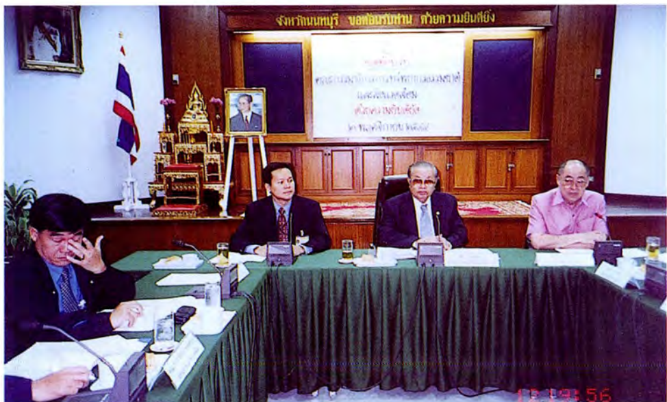
คณะกรรมการเดินทางไปศึกษาดูงานและร่วมประชุมกับผู้ว่าราชการจังหวัดนนทบุรีและ ผู้บริหารของจังหวัด เกี่ยวกับสถานที่ที่ใช้ในการฝังกลบขยะของจังหวัดนนทบุรี ณ จังหวัดนนทบุรี เมื่อวันที่ ๒ พฤศจิกายน ๒๕๔๔