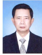
พลเอก ยุทธศิลป์ โดยชื่นงาม กรรมการ