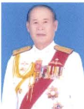
พลตรี จาริก อารีราชกัณย์ กรรมการและที่ปรึกษา