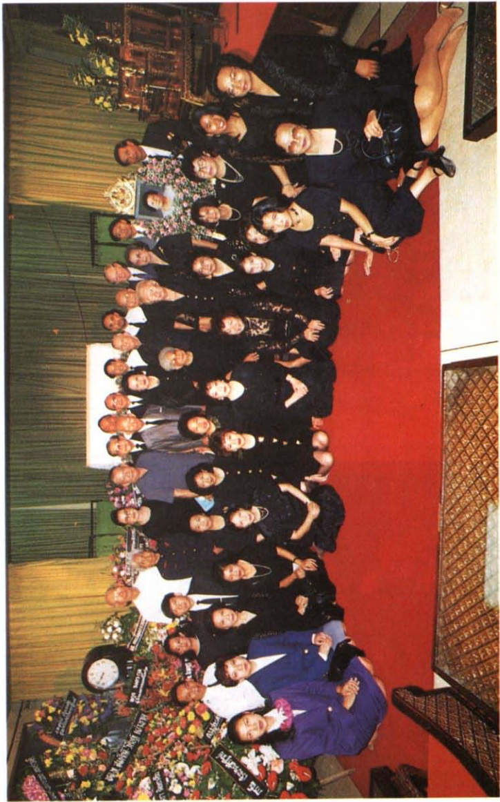
ญาติพี่น้องบางส่วนของสุนทรสืมา และศิษย์ศิริม