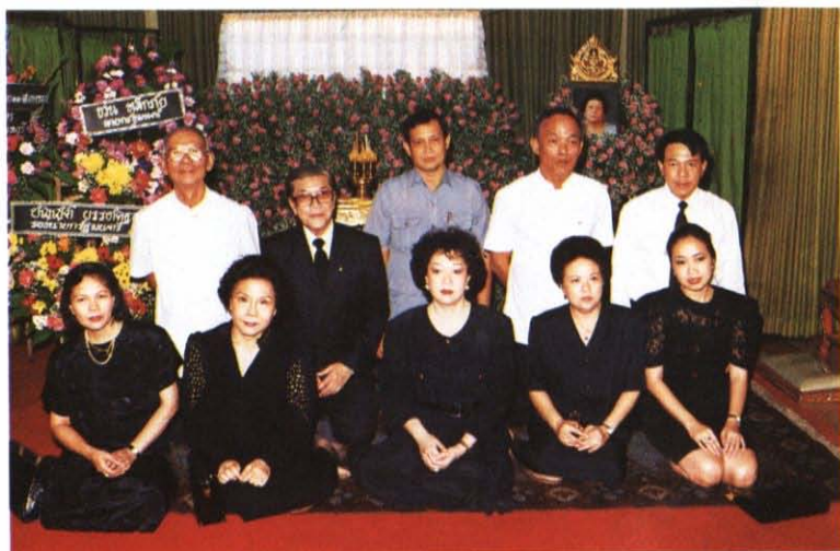
ลูก ๆ คุณแม่ ตอนสิ้นคุณแม่