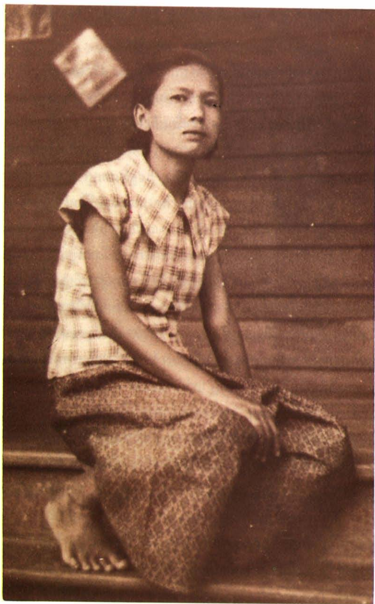
คุณแม่ตอนอายุ ๒๕ ปี เมื่อ พ.ศ. ๒๔๘๐