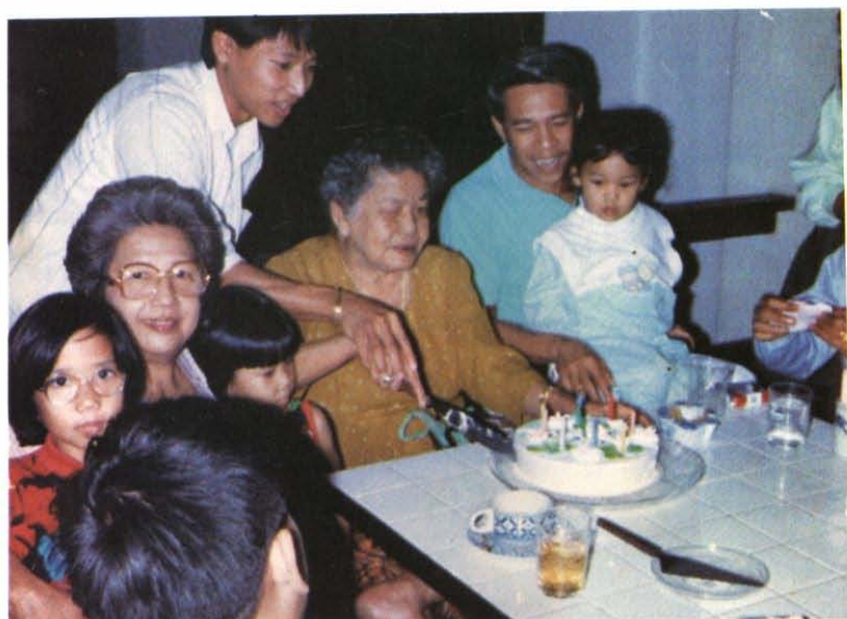
สุขสันต์วันเกิดคุณแม่กับลูก ๆ หลาน ๆ