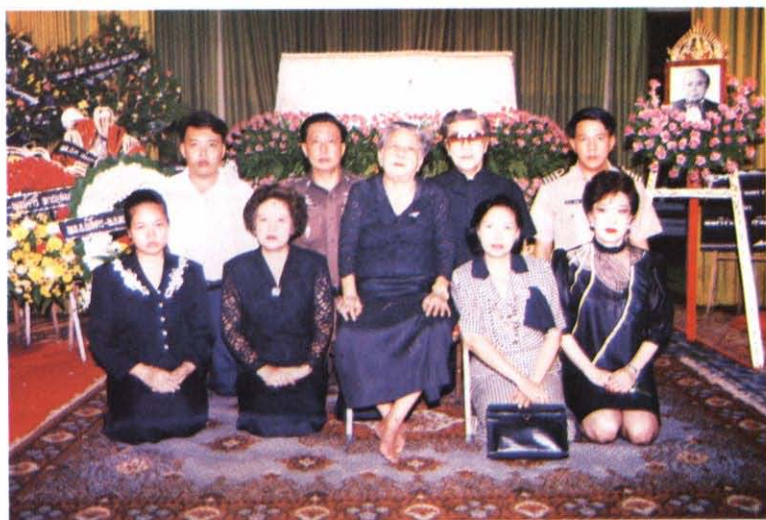
คุณแม่กับลูก ๆ เมื่อคุณพ่อจากไปก่อน