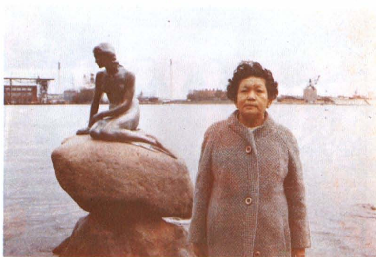
คุณแม่ตอนท่องเที่ยวยุโรป