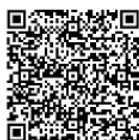
ดาวน์โหลดเอกสารประกอบ การประชุมวุฒิสภา ครั้งที่ ๑๒