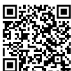
ดาวน์โหลด หนังสือนัดประชุมวุฒิสภา