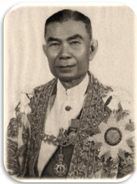
ภาพที่ 3 พระยามานวราชเสวี (พลอด-วิเชียร ณสงขลา)

ภายหลังการเลือกตั้งได้มีการตรา “พระราชกฤษฎีกาเรียกประชุมสามัญแห่งสภาผู้แทนราษฎร พุทธศักราช 2480” ซึ่งกำหนดเปิดประชุมในวันที่ 10 ธันวาคม เนื่องจากตรงกับ