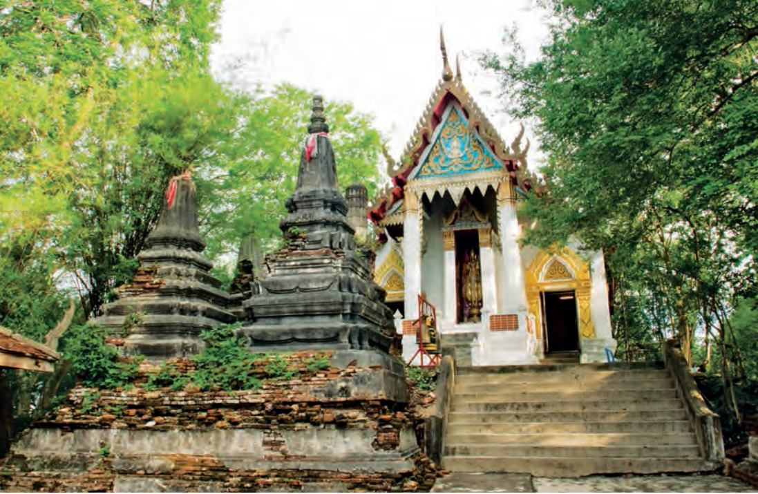
วัดแก่นจันทร์เจริญ

ชมคอนหอยหลอด คนละ ๒๐ บาท หรือเหมาลำ ลำละ ๑๒๐ บาท (ไม่เกิน ๖ คน) ชมปากอ่าว ลำละ ๒๐๐ บาท (ไม่เกิน ๔ คน) ชมทิวทัศน์ป่าชายเลน ลำละ ๔๐๐ บาท (ไม่เกิน ๗ คน) (หรือตามราคาที่ตกลงกับคนขับเรือ) นักท่องเที่ยวสามารถสอบถามเวลาน้ำขึ้น-น้ำลง ได้ที่ อบต.บางจะเกร็ง มูลนิธิศาลกรมหลวงชุมพรเขตอุดมศักดิ์ โทร. ๐ ๓๔๗๒ ๓๗๓๖