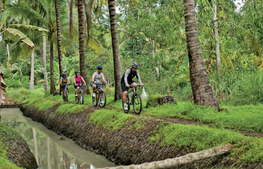
กิจกรรมปั่นจักรยานชมสวน