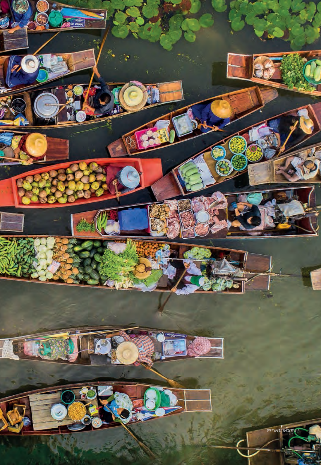
ตลาดน้ำอัมพวา