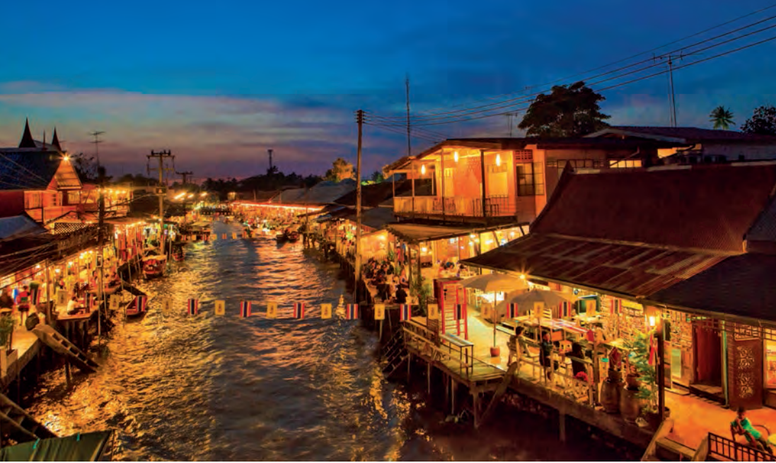
ตลาดน้ำยามเย็นอัมพวา

ผ่านอาสนวิหารแม่พระบังเกิด ข้ามสะพานบาง นกแขวก ป้ายวัดอยู่ด้านขวามือ เลี้ยวขวาเข้าไป ๕๐๐ เมตร