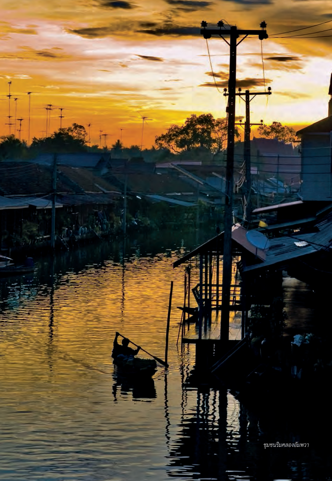
ชุมชนริมคลองอัมพวา