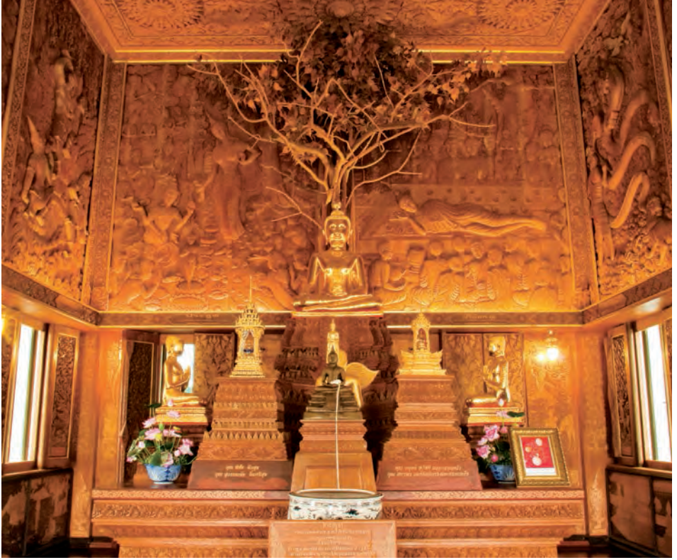
วัดบางแคน้อย

มารวิชัยทำด้วยศิลาแลง มีธรรมเจดีย์ ๗ องค์สร้างเมื่อ พ.ศ. ๒๔๑๕ มีกำแพงแก้วล้อมรอบ นอกจากนี้ฝา ประจัน (ฝาปั้นห้อง) กุฏิสงฆ์มีภาพจิตรกรรมฝาผนัง ที่เขียนด้วยสีฝุ่นผสมกาวเขียนในปลายสมัยรัชกาล ที่ ๒ เป็นเรื่องราวการทำสงครามไทย-พม่า ซึ่งน่าจะเป็นครั้งที่รัชกาลที่ ๒ โปรดให้ไปขัดดาทัพที่ราชบุรี เมื่อ พ.ศ.๒๓๖๔ ซึ่งไม่ได้เปิดให้ชมทั่วไปต้องขอ อนุญาตล่วงหน้า