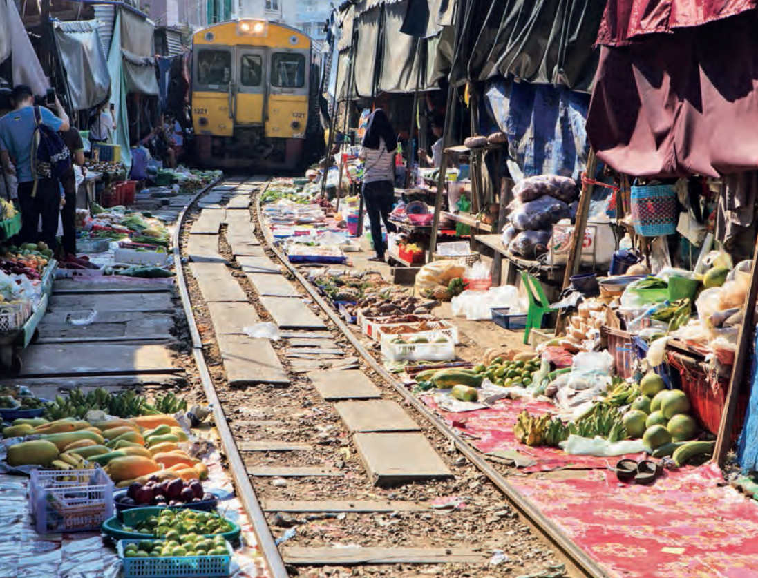
ตลาดร่มหุบ

ตลาดร่มหุบ อยู่ติดกับสถานีรถไฟแม่กลอง ตลาดร่มหุบ หรือที่ชาวบ้านเรียกกันว่า “ตลาดเสียงตายน” หรือ “ตลาดริมทางรถไฟ” ตั้งขายอยู่ริมทางรถไฟใกล้สถานีรถไฟแม่กลอง ความยาวของตลาดประมาณ ๑๐๐ เมตร บรรดาพ่อค้าแม่ค้าจะวางขายสินค้าบนพื้นที่ติดกับรางรถไฟ เวลารถไฟมาแม่ค้าต่างหุบร่มที่กางและเก็บสินค้าภายในพริบตา เป็นภาพแปลกตาน่าตื่นเต้น จนเป็นที่มาของชื่อตลาดร่มหุบ สินค้าที่วางขายเป็นผัก ผลไม้ อาหารทะเลสดๆ เป็นตลาดยอดนิยมของชาวบ้าน เพราะราคาถูกและคุณภาพดี เปิดขายทุกวัน เวลา ๐๖.๐๐-๑๘.๐๐ น. เวลารถไฟวิ่งผ่านตลาดร่มหุบ วันละ ๘ รอบ เวลา ๐๖.๒๐, ๐๘.๓๐, ๐๙.๐๐, ๑๑.๑๐, ๑๑.๓๐, ๑๔.๓๐, ๑๕.๓๐, ๑๗.๔๐ น.