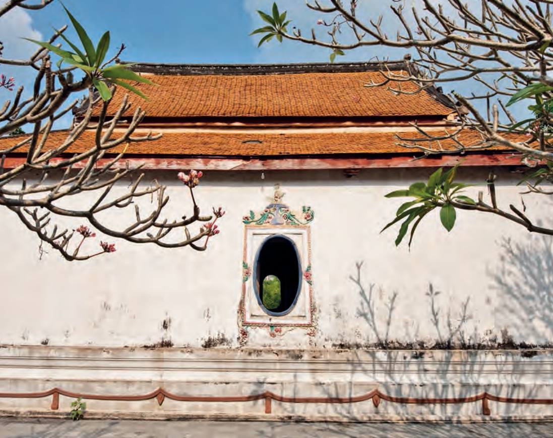
วัดบางกะพ้อม

เข้าไปเยี่ยมชมบรรยากาศแบบไทยที่ยังคงอนุรักษ์ไว้ อุทยานฯ เปิดให้เข้าชมทุกวัน เวลา ๐๘.๓๐-๑๗.๓๐ น. ค่าเข้าชมผู้ใหญ่ ๓๐ บาท เด็ก ๑๐ บาท สอบถามข้อมูลเพิ่มเติม โทร. ๐ ๓๔๗๕ ๑๖๖๖, ๐ ๓๔๗๕ ๑๓๗๖ โทรสาร ๐ ๓๔๗๕ ๑๓๗๖