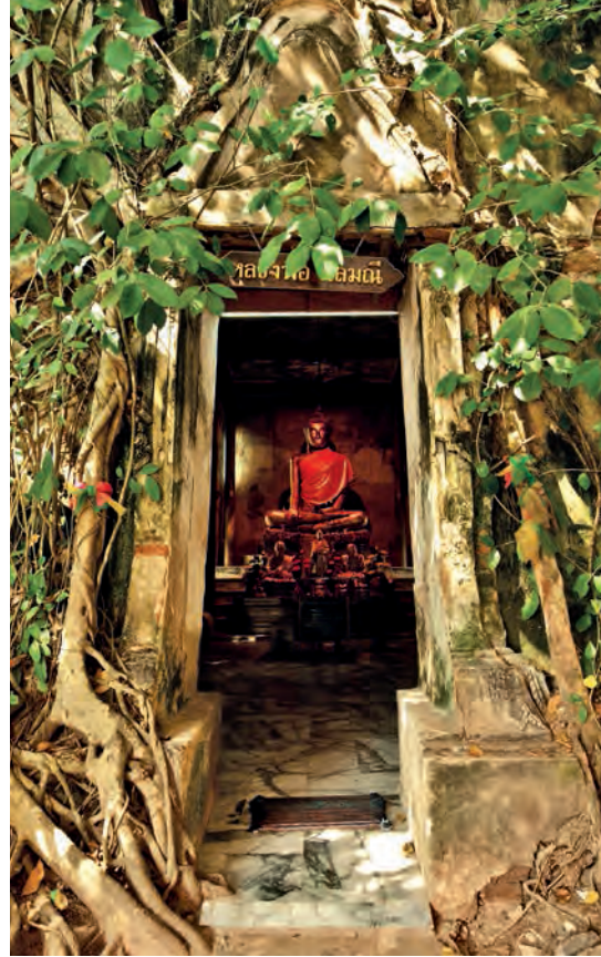
วัดบางกุ้ง

การเดินทาง ไปตามเส้นทางสายแม่กลอง-บางนกแขวก ผ่านอุทยาน ร.๒ อาสนวิหารแม่พระบังเกิดอยู่เลยแยกสะพานสมเด็จพระอัมรินทร์ไป ๑๐๐ เมตร