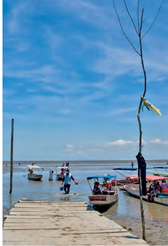
ดอนหอยหลอด

- ชายหาดหมู่บ้านบางบ่อ ตำบลบางแก้ว สามารถเดินทางไปได้ทางรถยนต์ ใช้เส้นทางสายธนบุรี-ปากท่อ (ถนนพระราม ๒) ก่อนถึงหลักกิโลเมตรที่ ๖๒ มีป้ายชี้บอกทางเข้าดอนหอยหลอดอีก ๗ กิโลเมตร