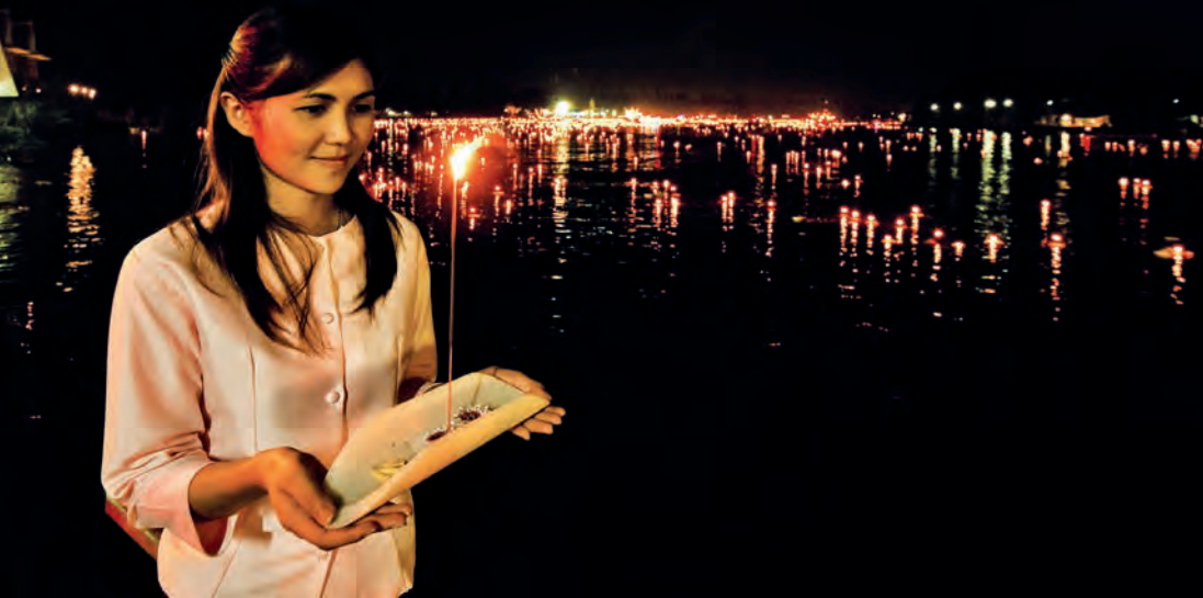
งานประเพณีลอยกระทงกาบกล้วยเมืองแม่กลอง

กลุ่มสตรีและเยาวชนสหกรณ์ประมงบางจะเกร็ง-บางแก้ว ๒๘/๒ หมู่ที่ ๘ ตำบลบางแก้ว โทร. ๐ ๓๔๗๖ ๙๘๗๗ (ผลิตเรือจำลองต่างๆ เช่น เรือแจว เรือหางยาว เรือผีหลอก ฯลฯ ซึ่งส่วนใหญ่ทำด้วยไม้สักซึ่งมีลวดลายสวยงาม รวมทั้งผลิตและจำหน่าย “ปลาหยอง”) (สินค้ามีหรือไม้ขึ้นอยู่กับวัตถุประสงค์)