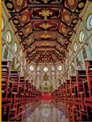
อาสนวิหารแม่พระบังเกิด