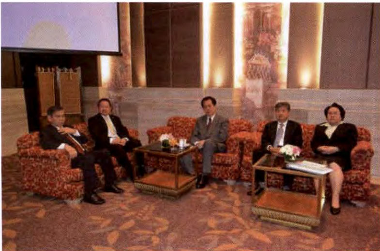
ประธานศาลปกครองสูงสุด และตุลาการศาลปกครองของแผนกคดีสิ่งแวดล้อมในศาลปกครองสูงสุด