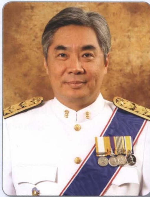
นายกิตติพงษ์ กิตยารักษ์ ปลัดกระทรวงยุติธรรม