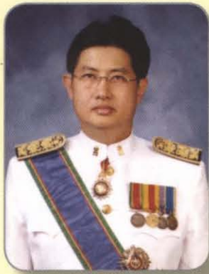
นายชาญเชาวน์ ไชยานุกิจ รองปลัดกระทรวงยุติธรรม หัวหน้ากลุ่มภารกิจด้านอำนวยความสะดวก