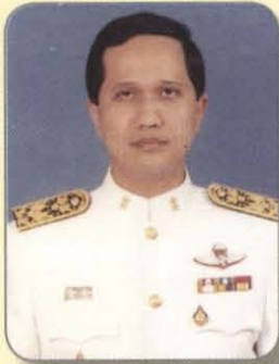
พันตำรวจโทพงษ์ธร รัญญูสิริ