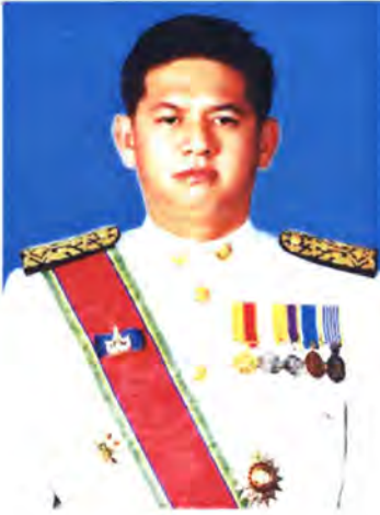
เลขที่ ส.ส. 204