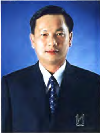
เลขที่ ส.ส. 148