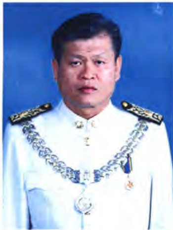
เลขที่ ส.ส. 167