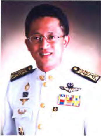
เลขที่ ส.ส. 030