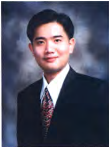
เลขที่ ส.ส. 082