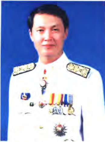
เลขที่ ส.ส. 386