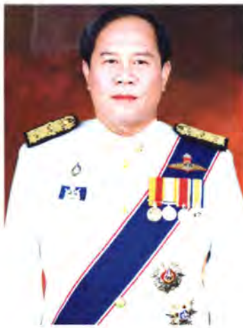
เลขที่ ส.ส. 253