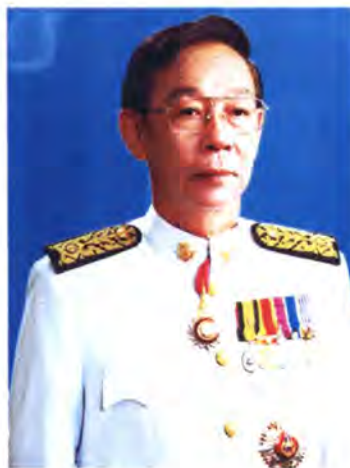
เลขที่ ส.ส. 124