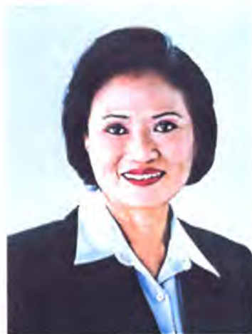
เลขที่ ส.ส. 014

พรรค ไทยรักไทย เกิด 30 ก.ย. 2486 อายุ 57 ปี ที่อยู่ 59/10 ถนนศรีสวัสดิ์ดำเนิน ตำบลตลาด อำเภอเมือง จังหวัดมหาสารคาม 44000 31/109 ซอยอากาศิรมย์ ถนนรัชดาภิเษก แขวงจตุจักร เขตจตุจักร กรุงเทพฯ 10900 โทรศัพท์ (043) 721-176, 513-1308 โทรสาร (043) 723-530