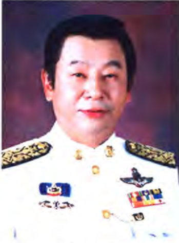
เลขที่ ส.ส. 432