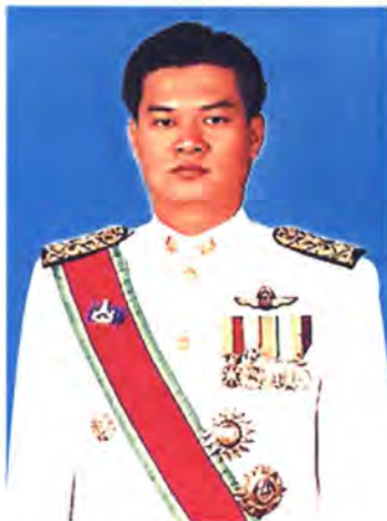
เลขที่ ส.ส. 198