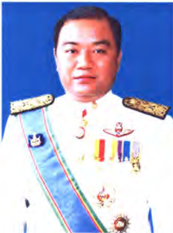
เลขที่ ส.ส. 412