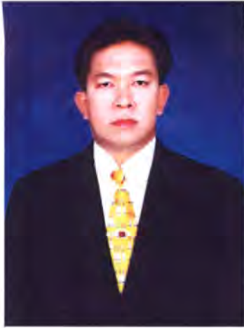
เลขที่ ส.ส. 152