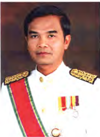
เลขที่ ส.ส. 141