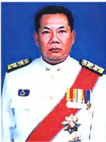
เลขที่ ส.ส. 210