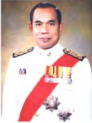
เลขที่ ส.ส. 391