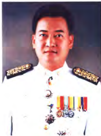
เลขที่ ส.ส. 330