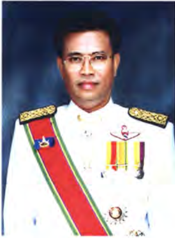
เลขที่ ส.ส. 321