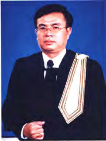
เลขที่ ส.ส. 405