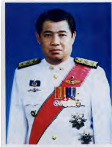
เลขที่ ส.ส. 422