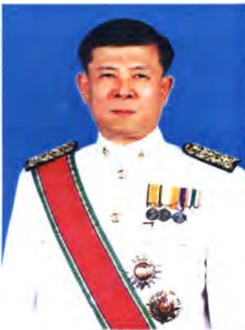
เลขที่ ส.ส. 325