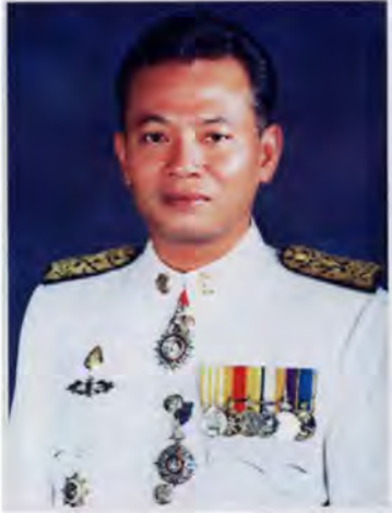
เลขที่ ส.ส. 421