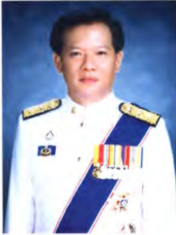
เลขที่ ส.ส. 338