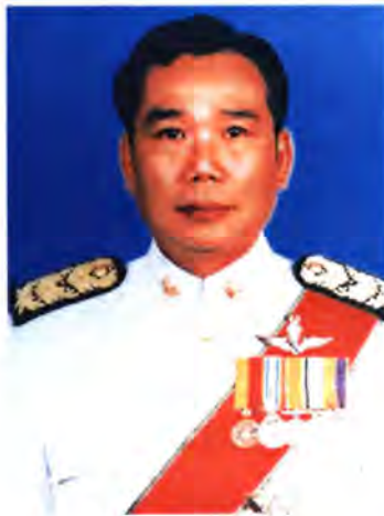
เลขที่ ส.ส. 451