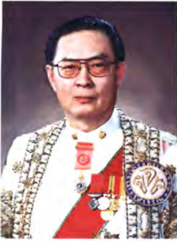
เลขที่ ส.ส. 263