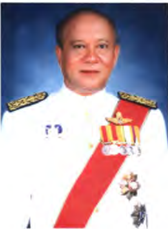
เลขที่ ส.ส. 266