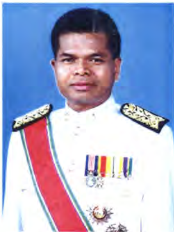
เลขที่ ส.ส. 172