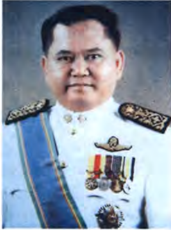
เลขที่ ส.ส. 340