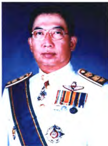
เลขที่ ส.ส. 226