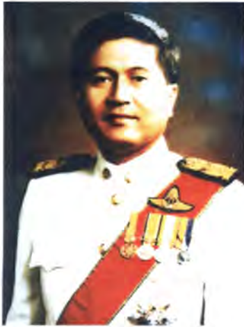
เลขที่ ส.ส. 050