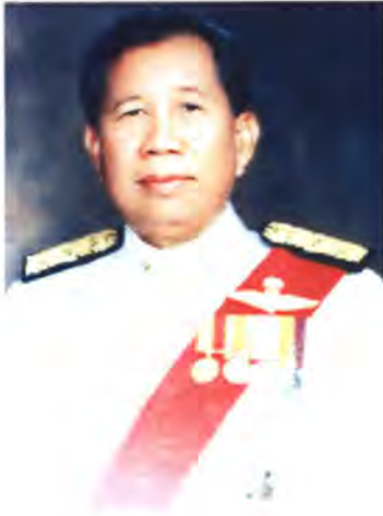
เลขที่ ส.ส. 005