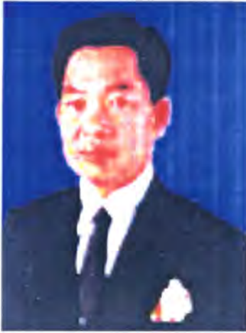
เลขที่ ส.ส. 040