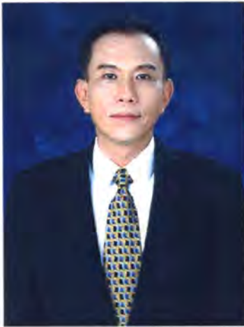
เลขที่ ส.ส. 162