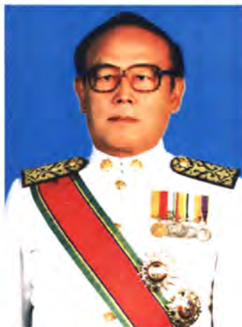
เลขที่ ส.ส. 458