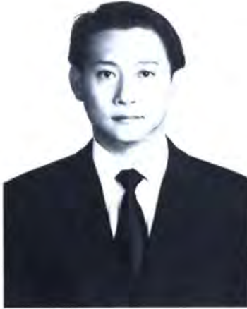
เลขที่ ส.ส. 384