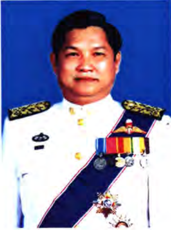
เลขที่ ส.ส. 449