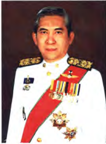
เลขที่ ส.ส. 230