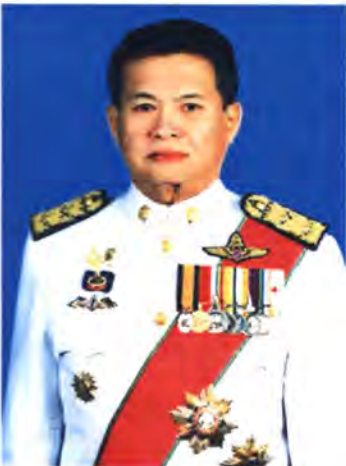
เลขที่ ส.ส. 065

พรรค ความหวังใหม่ เกิด 13 ก.ค. 2505 อายุ 38 ปี ที่อยู่ 53 หมู่ 3 ตำบลหาดนางแก้ว อำเภอภักดีบดินทร์บุรี จังหวัดปราจีนบุรี 25110 416 หมู่ 8 ถนนสุวรรณศร ตำบลเมืองเก่า อำเภอภักดีบดินทร์บุรี จังหวัดปราจีนบุรี 25240 โทรศัพท์ (037) 215-151, 213-644, 281-128 โทรสาร (037) 281-128 มือถือ (01) 864-9964