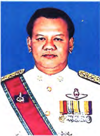
เลขที่ ส.ส. 441