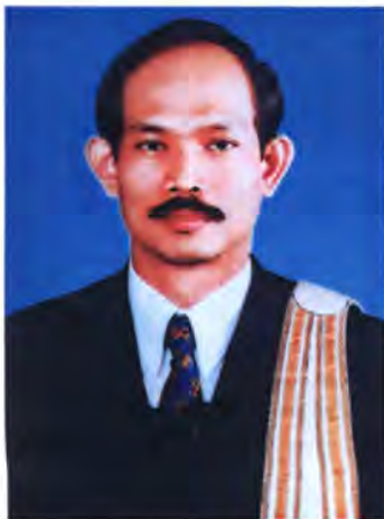
เลขที่ ส.ส. 297