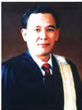
เลขที่ ส.ส. 128