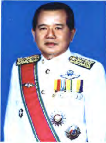
เลขที่ ส.ส. 175