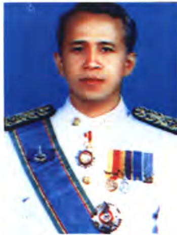
เลขที่ ส.ส. 363