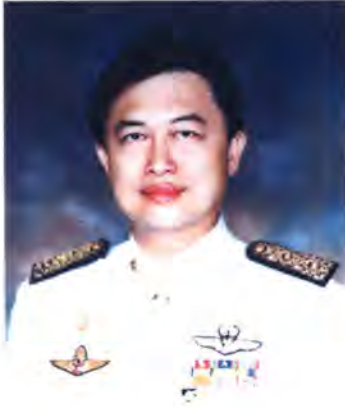
เลขที่ ส.ส. 310