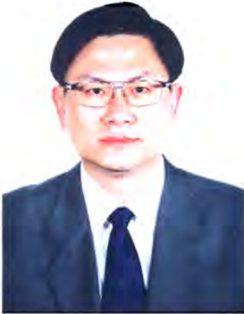
เลขที่ ส.ส. 499