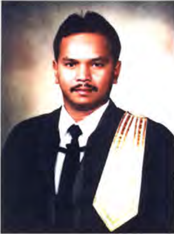
เลขที่ ส.ส. 136