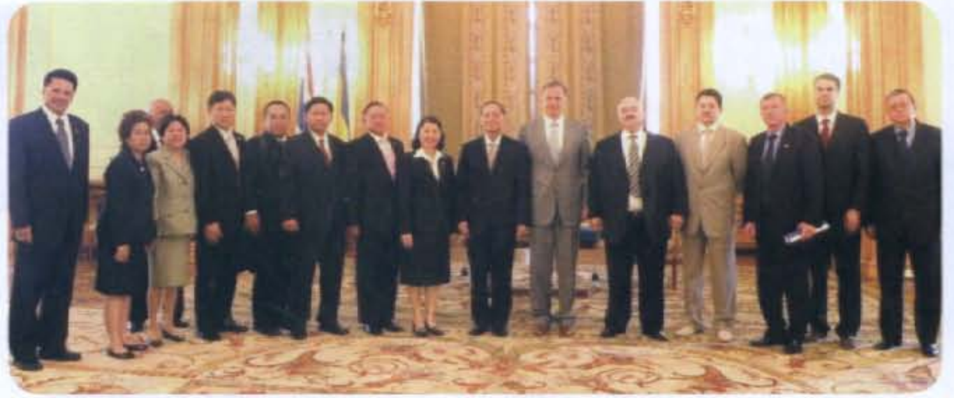
● คณะถ่ายภาพร่วมกับประธานวุฒิสภาและสมาชิกวุฒิสภาโรมาเนีย

รองประธานวุฒิสภาโรมาเนีย ได้เป็นเจ้าภาพเลี้ยงอาหารกลางวันเพื่อเป็นเกียรติแก่ประธานวุฒิสภาและคณะฯ อีกด้วย