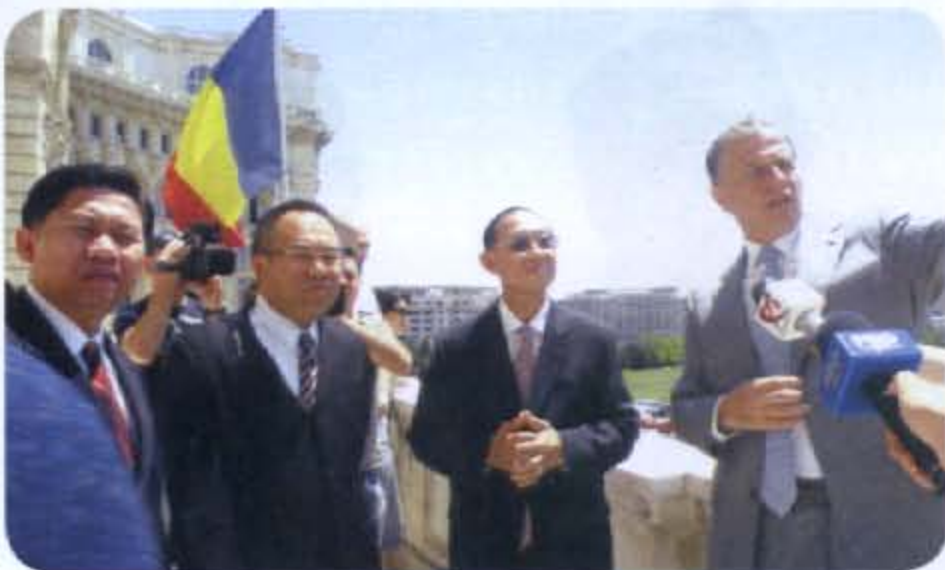
● ระหว่างการนำชมบริเวณระเบียงห้องทำงานประธานวุฒิสภาโรมาเนีย

คณะฯ ได้เยี่ยมชมอาคารรัฐสภาโรมาเนีย (People's House) ซึ่งเป็นอาคารทำการของราชการที่มีขนาดใหญ่เป็นอันดับสองของโลก รองจากอาคารเพนตากอนของสหรัฐอเมริกา อย่างไรก็ตามถือเป็นอาคารรัฐสภาที่ใหญ่ที่สุดของโลก ด้วยขนาดอาคารกว้าง ๒๔๐ เมตร ยาว ๒๗๐ เมตร สูงเหนือพื้นดิน ๘๖ เมตร หรือสูง ๑๒ ชั้น และลึกลงไปใต้พื้นดิน ๙๒ เมตร หรือลึกลงไปอีก ๘ ชั้น ซึ่งนายพลเซาเซสคู