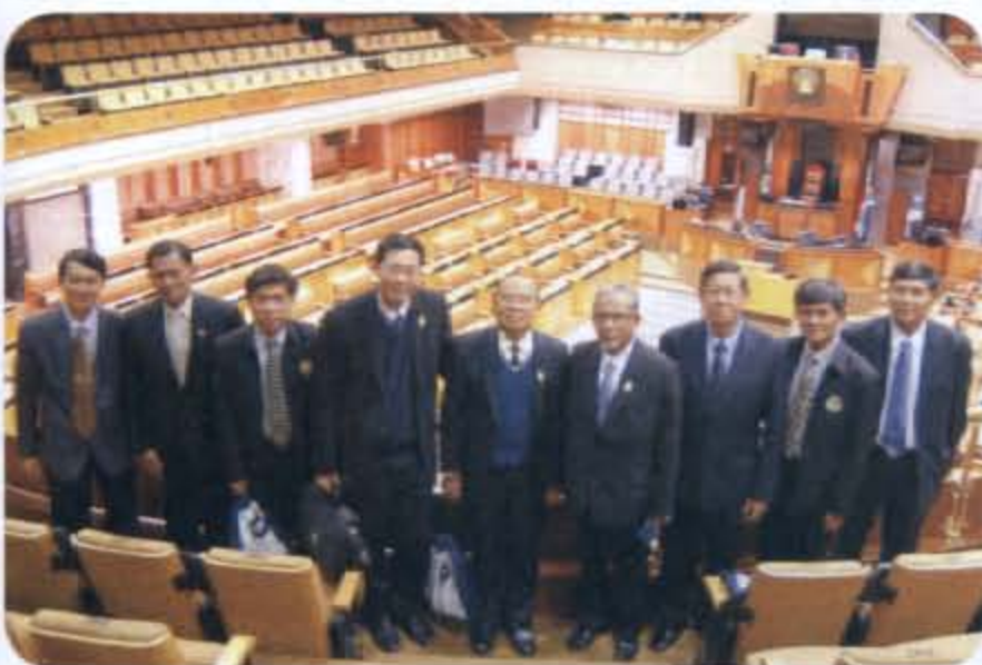
• คณะกรรมการเยี่ยมชมห้องประชุมรัฐสภา สาธารณรัฐแอฟริกาใต้