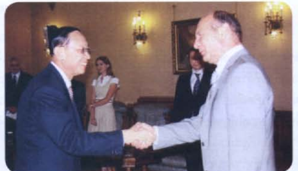
● ประธานวุฒิสภานำคณะเข้าเยี่ยมคารวะประธานาธิบดีโรมาเนีย ทำเนียบประธานาธิบดี