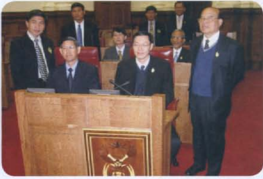
• คณะกรรมาธิการเยี่ยมชมห้องประชุมรัฐสภาแห่งชาติของจังหวัด (วุฒิสภา) สาธารณรัฐแอฟริกาใต้

Commission) ผู้ตรวจการแผ่นดิน (The Public Protector) คณะกรรมการเพื่อส่งเสริมและคุ้มครองสิทธิทางวัฒนธรรม ศาสนาและชุมชนเกี่ยวกับภาษาศาสตร์ (The Commission for the Promotion and Protection of the Rights of Cultural, Religious and Linguistic Communities) และคณะกรรมการเพื่อความเสมอภาคทางเพศ (The commission for Gender Equality) เป็นต้น