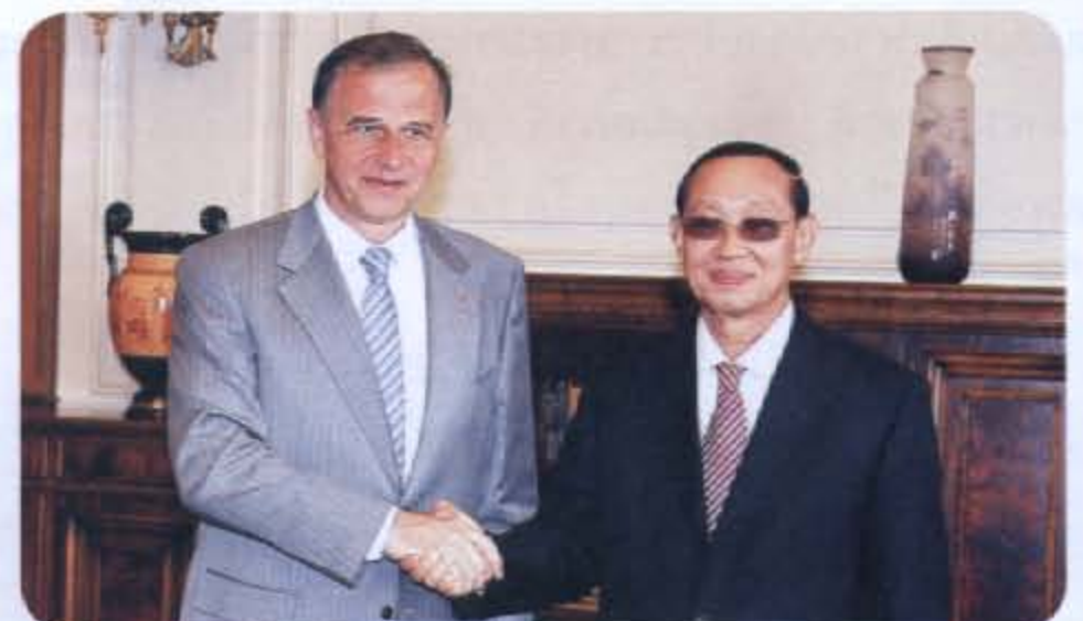
● ประธานวุฒิสภาโรมาเนียนำชมห้องทำงาน