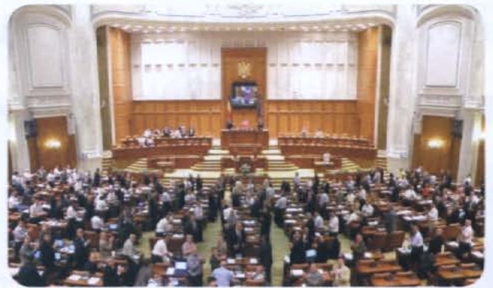
● สมาชิกสภาผู้แทนราษฎรโรมาเนียลุกขึ้นปรบมือต้อนรับประธานวุฒิสภาและคณะ

การสนทนาในโอกาสต่างๆ ข้างต้น ยังผลให้ทั้งสองฝ่ายต่างหารือและแลกเปลี่ยนข้อคิดเห็นและประสบการณ์ในประเด็นสำคัญต่างๆ อาทิ ความสัมพันธ์ระหว่างไทยและโรมาเนียที่เป็นไปด้วยความราบรื่นมาโดยตลอดนับจากการสถาปนาความสัมพันธ์ทางการทูตระหว่างกันอย่างเป็นทางการนานถึง ๓๖ ปีมาแล้ว การแสวงหาหนทางในการเพิ่มพูนความร่วมมือระหว่างกันในด้านต่างๆ อาทิ การค้าการลงทุน การท่องเที่ยว และการกีฬา ให้ทวีคูณยิ่งขึ้น การแลกเปลี่ยนการเยือนระหว่างกันตลอดจนสถานการณ์ของประเทศและวิกฤตเศรษฐกิจโลก เป็นต้น และทั้งสองฝ่ายยังมีความมุ่งมั่นปรารถนาพ้องกันในการที่จะมุ่งส่งเสริมและสนับสนุนให้ทั้งสองประเทศมีความสัมพันธ์กันอย่างแน่นแฟ้นในทุกภาคส่วนและทุกระดับ โดยเฉพาะอย่างยิ่งในระดับรัฐสภา ให้มีการแลกเปลี่ยนการเยือนระหว่างกันระหว่างผู้นำของสถาบันนิติบัญญัติและกลุ่มมิตรภาพสมาชิกวุฒิสภาซึ่งทั้งสองฝ่ายได้จัดตั้งขึ้น เพื่อทวีความเข้าใจอันดีอันจะยังประโยชน์ร่วมกันของทั้งสองประเทศเป็นสำคัญ ทั้งนี้ การเดินทางไปเยือนครั้งนี้ได้สะท้อนให้เห็นเป็นนัยสำคัญถึงการยกระดับความสัมพันธ์ของไทยและโรมาเนียที่ยังผลให้เกิดความสัมพันธ์อันลึกซึ้งและมีมิติที่จริงจังอันแน่นแฟ้นยิ่งขึ้นสืบต่อไป อนึ่ง ประธานวุฒิสภาโรมาเนียได้กล่าวเน้นย้ำกับประธานวุฒิสภาไทยและคณะฯ ว่าการเดินทางมาเยือนโรมาเนียครั้งนี้ถือเป็นเหตุการณ์สำคัญแห่งความสัมพันธ์ไทย - โรมาเนีย ซึ่งช่วยยกระดับความสัมพันธ์ระหว่างรัฐสภาทั้งสองประเทศให้แน่นแฟ้นยิ่งขึ้นสืบไป