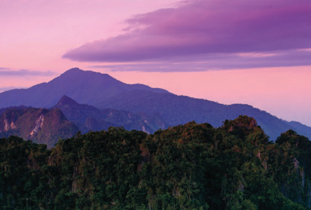
อุทยานแห่งชาติเขาค้อ

อุทยานแห่งชาติเขาค้อ โทร. ๐๖ ๑๒๓๒ ๔๙๐๑ www.dnp.go.th