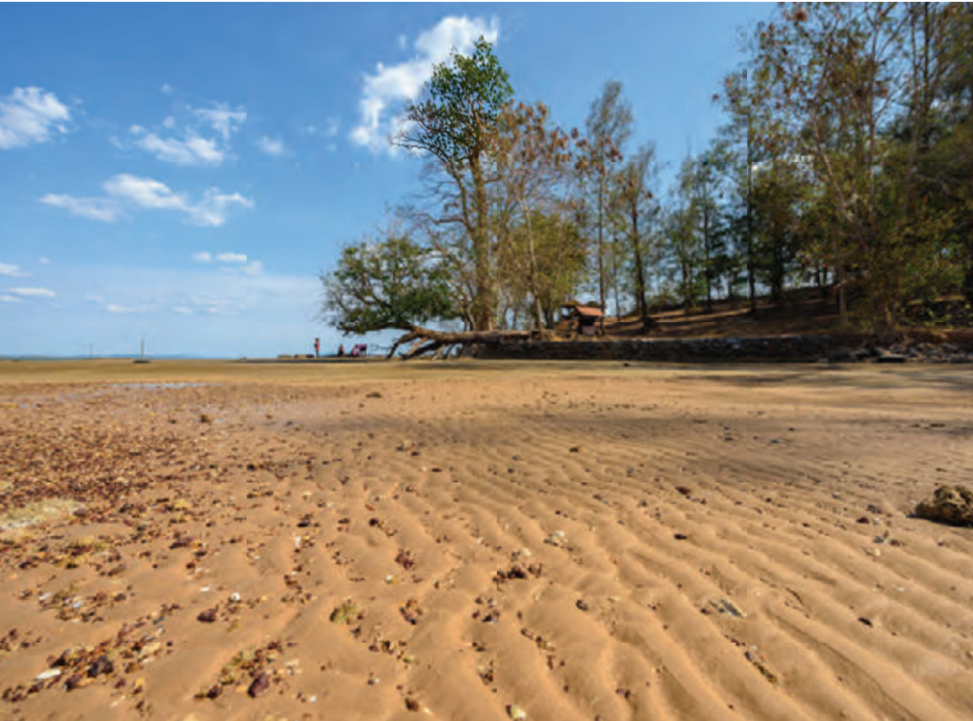
สุสานหอยแกลมโพธิ์ หรือ สุสานหอยเจ็ดลิบห้าล้านปี

สุสานหอยแกลมโพธิ์ หรือ สุสานหอยเจ็ดลิบห้าล้านปี อยู่บริเวณชายทะเลบ้านแกลมโพธิ์ ลักษณะเป็นชั้นหินแผ่นหินปูน มีความหนาตั้งแต่ ๐.๕๐-๑ เมตร แต่ละแผ่นหินมีซากของหอยกาบเดี่ยว (Gastropod) จำพวกหอยขมน้ำจืด (Viviparus) ทับถมซ้อนกันเป็นชั้น ๆ สุสานหอยแกลมโพธิ์นี้มีชื่อเรียกกันแต่เดิมว่า สุสานหอยเจ็ดลิบห้าล้านปี เนื่องจากข้อมูลซากหอยที่สุสานหอยแกลมโพธิ์มีอายุยุคเทอร์เชียรี ซึ่งในสมัย