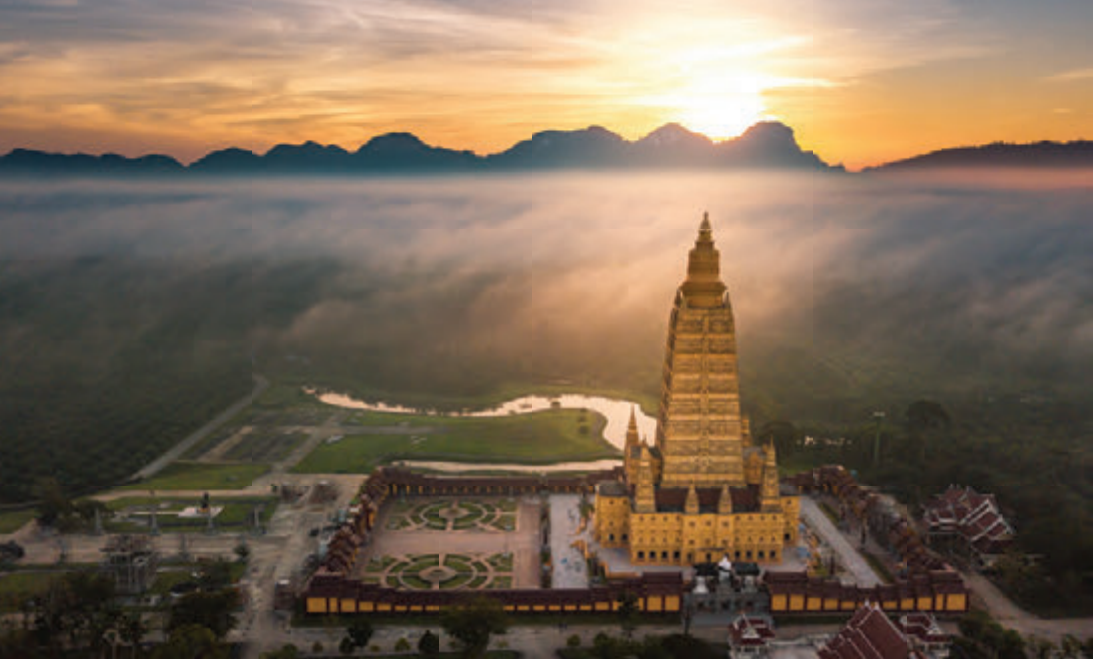
วัดมหาธาตุวชิรมงคล

ผาเขา คล้ายปากปล่องภูเขาไฟ เรือสามารถเล่นได้ เมื่อระดับน้ำทะเลขึ้น