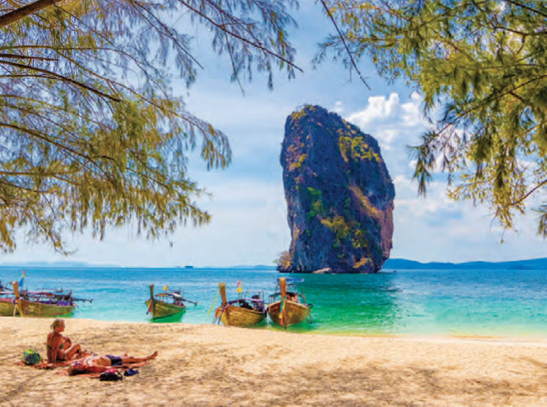
เกาะปอดะ

๔ เกาะแบบวันเดย์ทัวร์หรือแบบครึ่งวัน ได้แก่ ทะเลแหวก เกาะทับ เกาะไก่ เกาะปอดะ อ่าวไร่เลย์ใช้เวลาเดินทางประมาณ ๒๕ นาที สอบถามข้อมูล สหกรณ์เรือหางยาวตำบลอ่าวนาง โทร. ๐ ๗๕๖๖ ๑๑๓๑