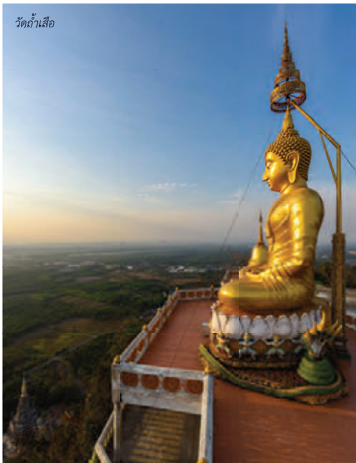
วัดถ้ำเสือ