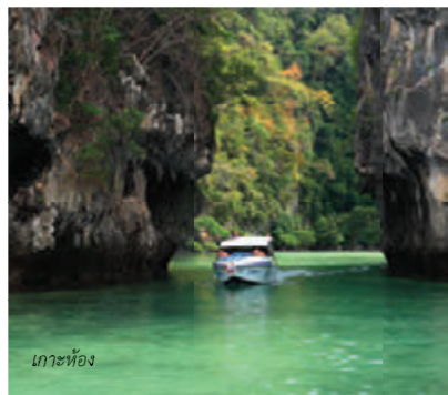
เกาะห้อง