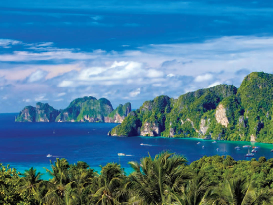
จุดชมวิวเกาะพีพีตอน

ฉากกับผืนทะเลโดยรอบเกือบทั้งเกาะ มีบริเวณน้ำลึกที่สุด ๓๔ เมตรอยู่ทางตอนใต้ของเกาะ บนเกาะไม่มีที่พัก ยังคงมีความสมบูรณ์ของธรรมชาติ เกาะแห่งนี้มีเวียงอ่าวสวยงามและมีชื่อเสียง ได้แก่ อ่าวปิละ หรือ ลากูน เป็นเวียงอ่าวขนาดใหญ่ มีช่องเขาเป็นทางเข้า ล้อมรอบด้วยเขาหินปูนคล้ายห้องโถง น้ำทะเลสีเขียวมรกต *อ่าวมาหยา เป็นอ่าวที่มีชื่อเสียงของเกาะพีพีเล ล้อมรอบด้วยภูเขา มีชายหาดเม็ดทรายขาวละเอียด น้ำทะเลสีเขียวมรกต อ่าวโล๊ะซามะ เป็นจุดดำน้ำที่สวยงามที่สุดแห่งหนึ่งของเกาะพีพีเล มีกองหินแนวปะการัง ดอกไม้ทะเลหลากสี รวมถึงฝูงปลาจำนวนมาก นอกจากนี้ทางทิศตะวันออกเฉียงเหนือยังมีถ้ำไวกิ้ง เมื่อปี พ.ศ. ๒๕๑๕ พระบาทสมเด็จพระประปรมินทรมหาภูมิพลอดุลยเดช (รัชกาลที่ ๙)