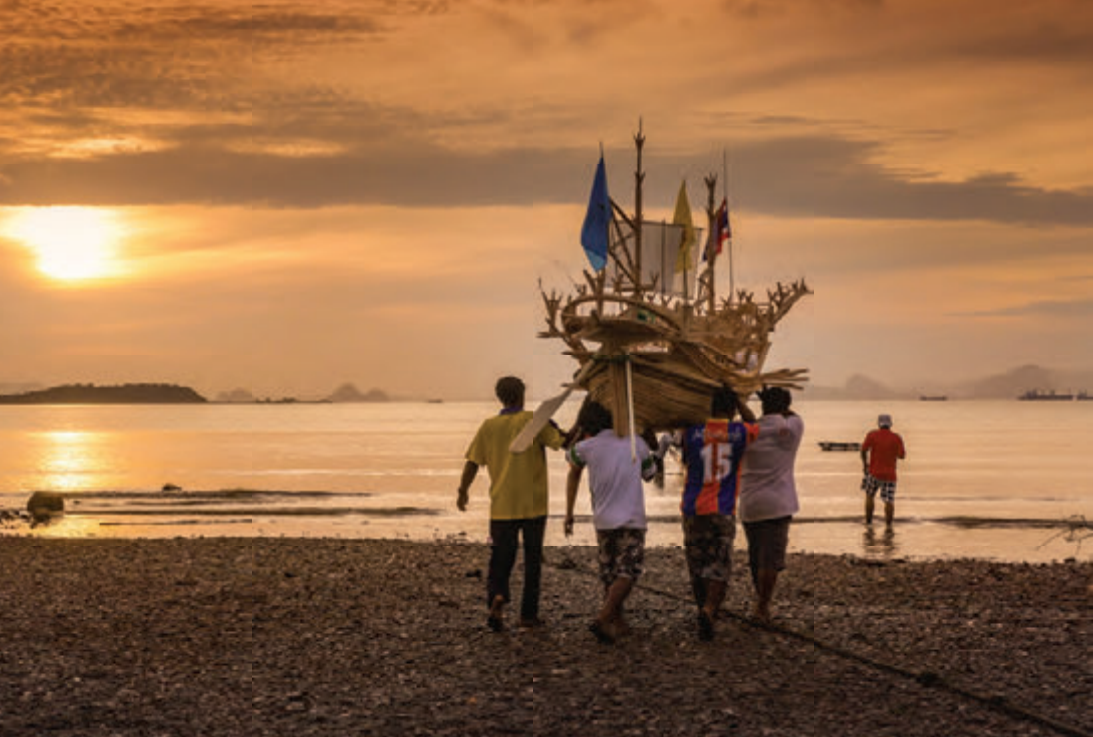
งานประเพณีลอยเรือชาวเล

ที่ทำการอุทยานแห่งชาติหมู่เกาะลันตาซึ่งอยู่ตอนใต้สุดของเกาะ