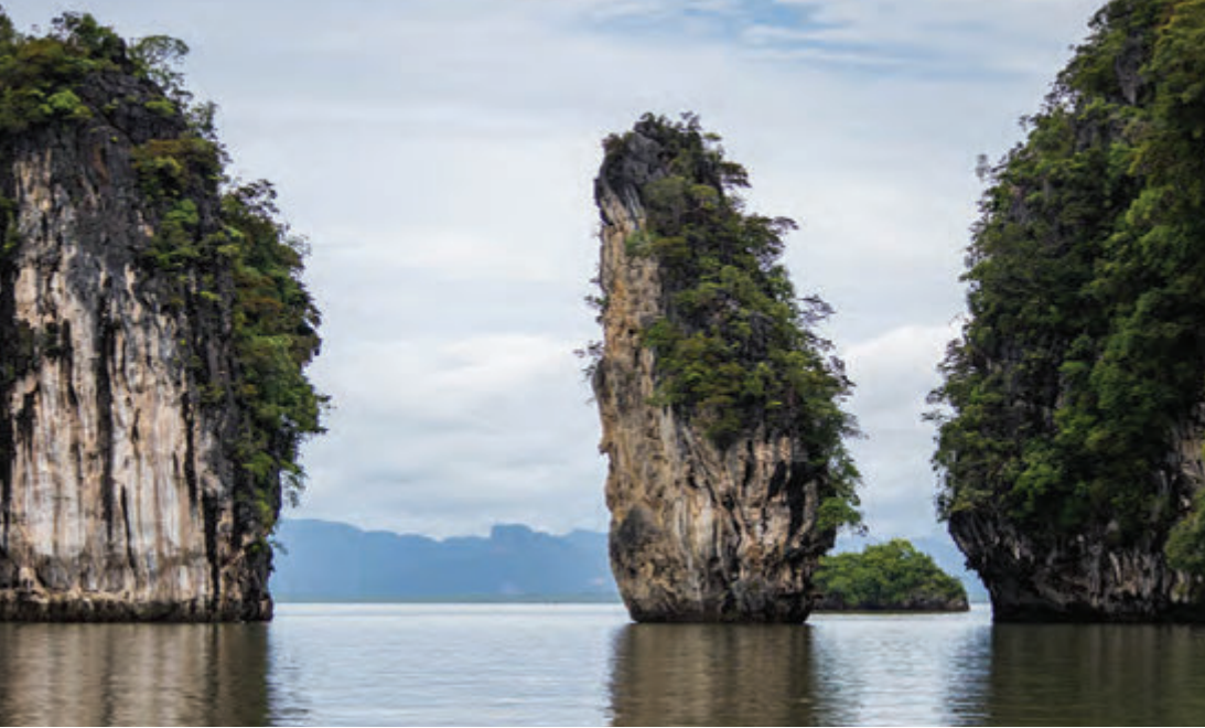
เขาเหล็กโค่น ชุมชนท่องเที่ยวแหลมลึก

เขาหินปูน ชาวบ้านส่วนใหญ่เป็นชาวมุสลิม ประกอบอาชีพประมงพื้นบ้านและมีบางส่วนทำสวนยางและปาล์ม ชุมชนมีกิจกรรมที่หลากหลาย เช่น สัมผัสวิถีชีวิตชาวประมงพื้นบ้าน ชมภาพเขียนสีที่เขากาโรส เล่นน้ำที่อ่าวม่วง มีที่พักโฮมสเตย์ให้บริการ