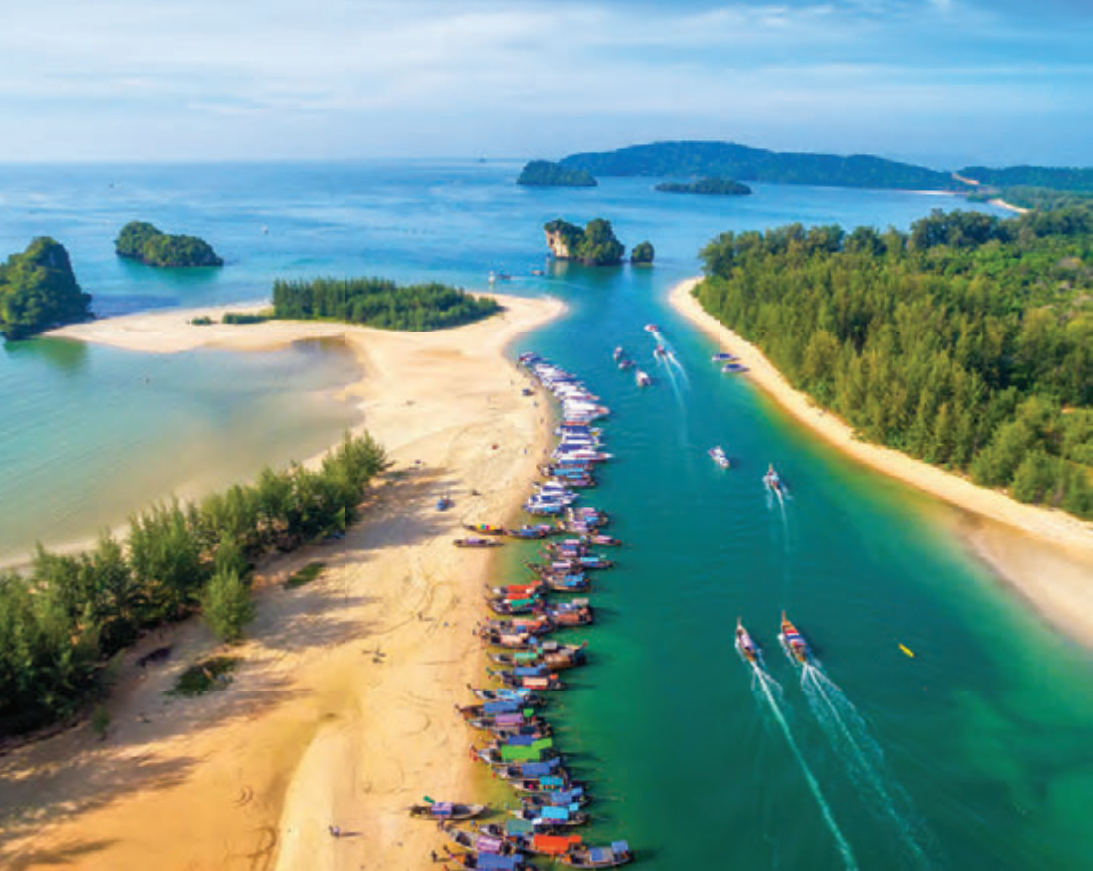
หาดนพรัตน์ธารา

สถานที่ท่องเที่ยวภายในเขตอุทยานฯ ได้แก่ หาดนพรัตน์ธารา มีความยาว ๓ กิโลเมตร เดิมชาวบ้านเรียกว่า “หาดคลองแห้ง” ทั้งนี้เพราะเมื่อน้ำลง น้ำคลองที่ไหลมาจากภูเขาทางด้านเหนือจะแห้งขอดกลายเป็นหาดทรายยาวเหยียดทอดลงไปบนทะเล บรรจบกับเกาะเขาปากคลอง บริเวณหาดเป็นทรายละเอียดปะปนด้วยเปลือกหอยเล็ก ๆ ประดับด้วยทิวสนเรียงรายตามชายทะเลยาวเหยียด บริเวณชายหาดมีที่พักการอุทยานฯ ตั้งอยู่ จากที่ทำการอุทยานฯ ไปตามชายหาดด้านทิศตะวันตก มีรีสอร์ตหลายแห่งให้บริการนักท่องเที่ยว ชายหาดบริเวณนี้ค่อนข้างเงียบสงบ