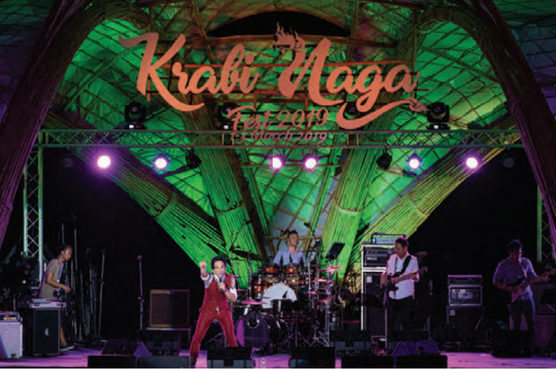
กระป๋องคา เฟส (Krabi Naga Fest)

สักการะ ชมขบวนแห่พระและม้าทรงของศาลเจ้าต่าง ๆ สอบถามข้อมูล องค์การบริหารส่วนจังหวัดกระบี่ โทร. ๐ ๗๕๖๒ ๗๑๑๑