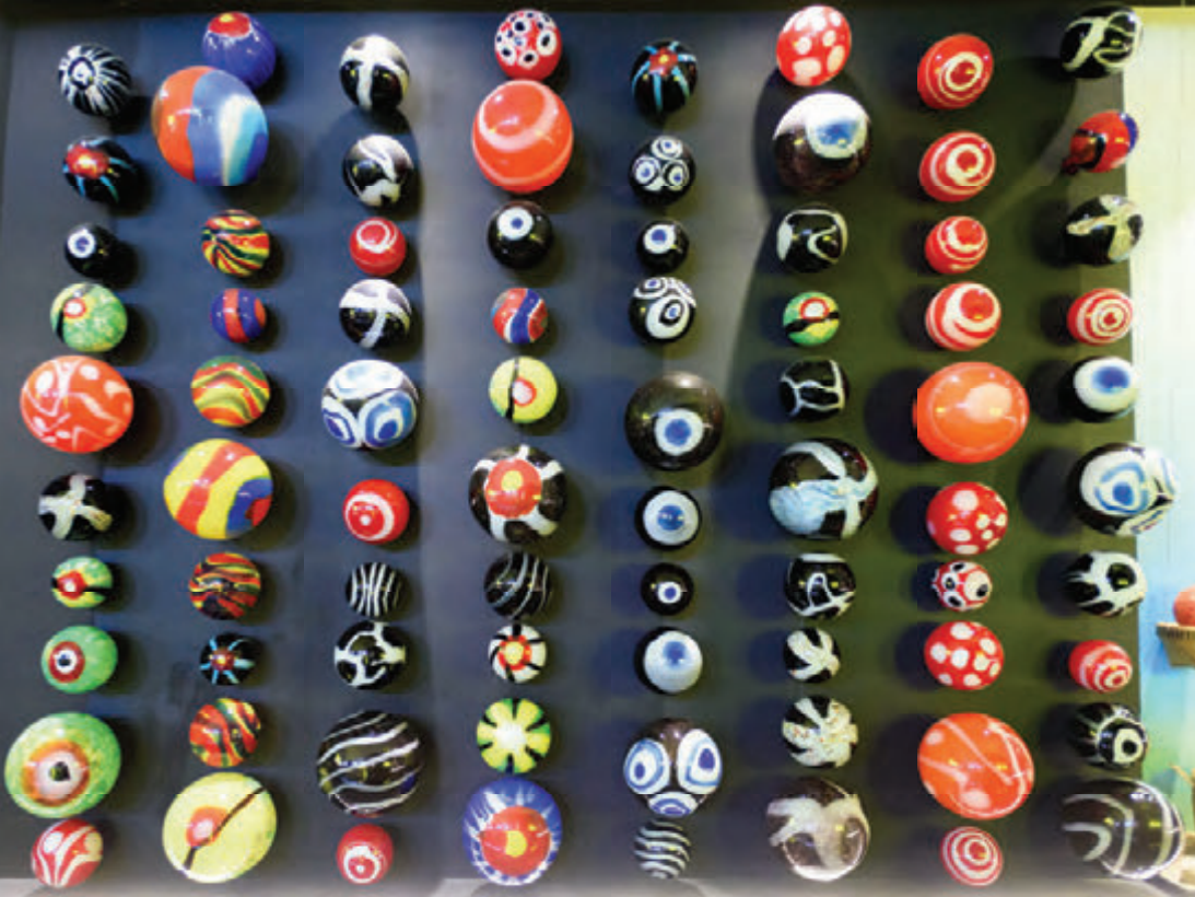
ลูกปัดอันดามัน ศูนย์การเรียนรู้วัฒนธรรมอันดามัน หรือ หอศิลป์กระป๋อง

ออกจากท่าอากาศยานดอนเมือง (เส้นทางกรุงเทพฯ-กระบี่-กรุงเทพฯ) สอบถามข้อมูล