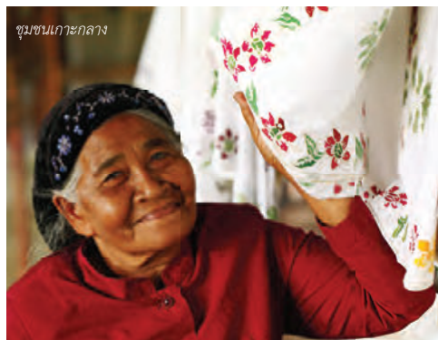
ชุมชนเกาะกลาง