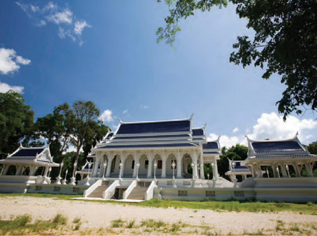
วัดแก้วโกรวาราม

อาคารสาธิตการผลิตลูกปัดอันดามัน หอศิลป์อันดามัน อาคารแสดงนิทรรศการหมุนเวียนและโรงเรียนต้นกล้าอันดามัน สอบถามข้อมูล โทร. ๐ ๗๕๖๒ ๑๓๕๙, ๐๘ ๓๔๒๖ ๗๓๙๔