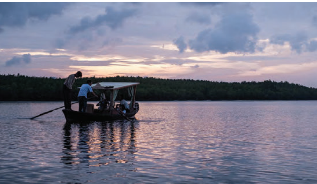
เรือแจวโบราณ หมู่บ้านท่องเที่ยวเชิงอนุรักษ์ทุ่งหยีเพ็ง

จุดชมวิวแหลมงู ตั้งอยู่ที่เกาะลันตาน้อย เหมาะสำหรับพักผ่อนท่ามกลางบรรยากาศริมทะเลที่เงียบสงบ โดยเฉพาะช่วงเย็นจะมีชาวบ้านในพื้นที่นิยมออกมาพักผ่อน พร้อมทั้งมีร้านค้าขายอาหารเรียงราย จากจุดชมวิวนี้นสามารถมองเห็นเกาะตะละเบ็งได้