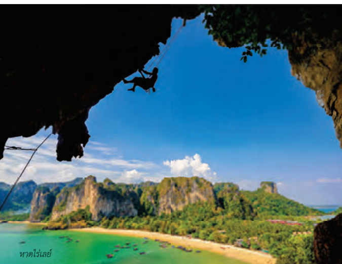
หาดไร่เลย์