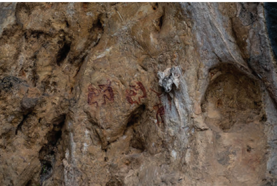
ภาพเขียนสีโบราณ ถ้ำชาวล

ถ้ำชาวล บ้านแหลมสัก ตำบลแหลมสัก ในเวียงอ่าวที่ แวดล้อมด้วยธรรมชาติอันสวยงามของเกาะแก่งและ ภูเขา ภายในถ้ำมีหินงอกหินย้อยและภาพเขียนสมัย ก่อนประวัติศาสตร์เป็นรูปคน รูปสัตว์ และรูปทรง เรขาคณิตต่าง ๆ หลายภาพด้วยกัน สันนิษฐานว่าจะ มีอายุอยู่ในช่วงหลังภาพเขียนที่ถ้ำผีหัวโต บริเวณถ้ำ ชาวลสามารถพายเรือแคนูได้ สำหรับการไปเที่ยว ชมสามารถเช่าเรือจากท่าเรือบ้านแหลมสัก ใช้เวลา เดินทาง ๑๕ นาที