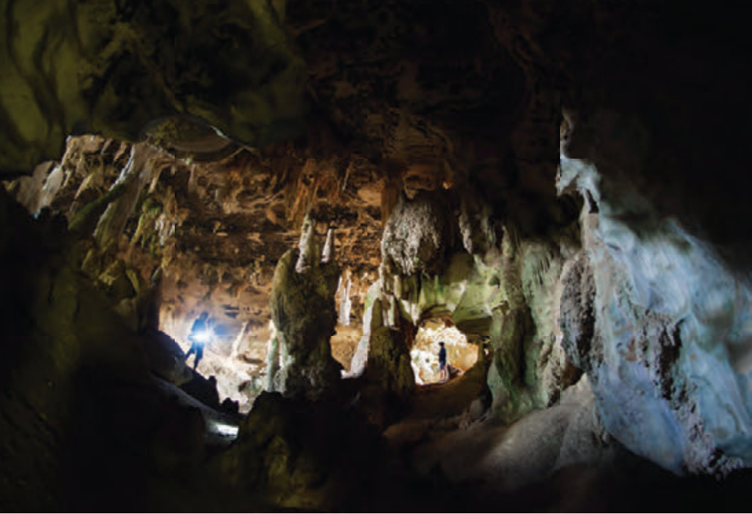
ถ้ำผีหัวโต หรือ ถ้ำหัวกะโหลก