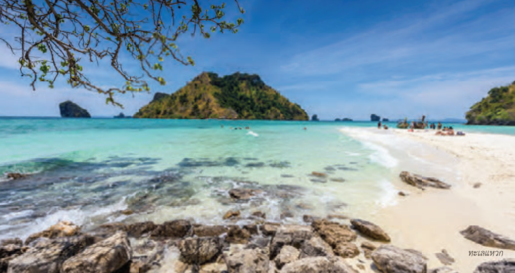
ทะเลแหวก