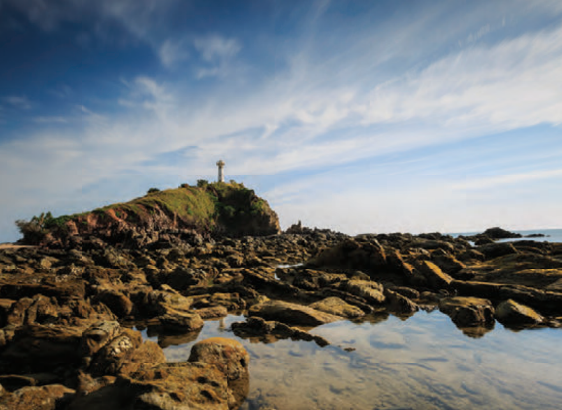
อุทยานแห่งชาติหมู่เกาะลันตา

จะมีทางแยกเลี้ยวขวาไปสระมรกตอีกประมาณ ๘ กิโลเมตร มีป้ายบอกทางชัดเจน