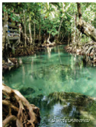
น้ำตกร้อนคลองท่อม