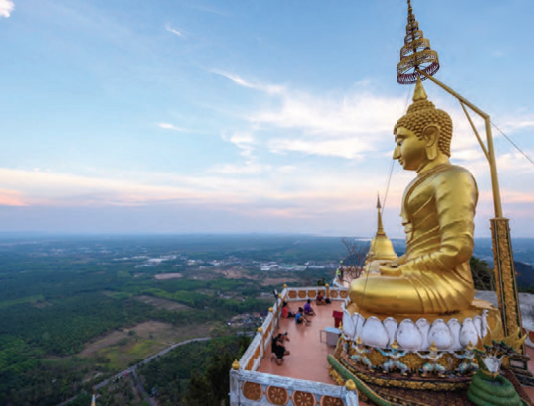
วัดถ้ำเสือ

จัดให้เข้าชมในส่วนของกระซังเลี้ยงปลา ตู้กระจกจัดแสดงพันธุ์ปลา และบ่อเพาะเลี้ยงพันธุ์ปลาทะเล รวมทั้งให้บริการความรู้ทางวิชาการแก่เกษตรกร และบุคคลทั่วไปที่เข้ามาติดต่อขอคำแนะนำเกี่ยวกับการเพาะเลี้ยงสัตว์น้ำ เปิดให้เข้าชมทุกวันตั้งแต่ ๐๘.๓๐-๑๖.๓๐ น. ไม่เสียค่าเข้าชม สอบถามข้อมูล โทร. ๐ ๗๕๖๖ ๒๐๕๙-๖๒