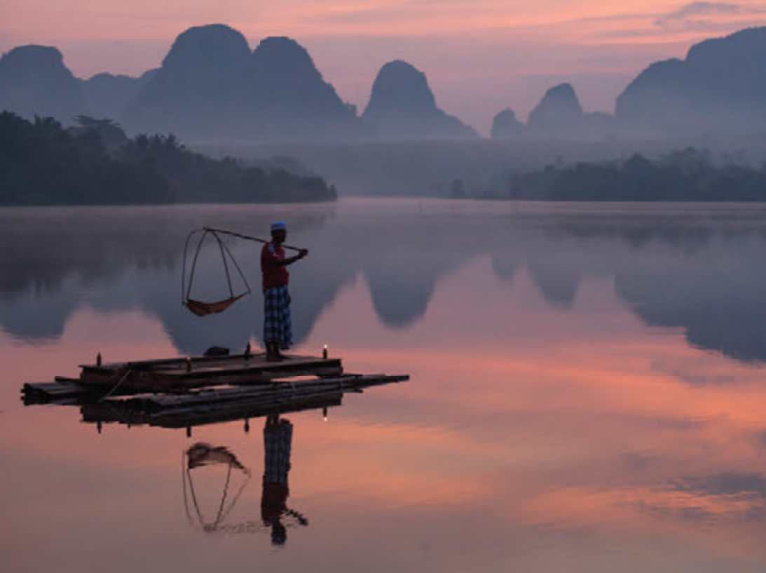
หนองทะเล

เชิงวัฒนธรรม มีโฮมสเตย์และกิจกรรมท่องเที่ยวที่หลากหลาย เช่น กิจกรรมท่องเที่ยวทางทะเล เกาะปอดะ ทะเลแหวก ปันจักรยานชมวิถีชีวิต เรียนรู้การทำผ้าบาติก การทำอาหาร ขนมพื้นบ้านร่วมกับชุมชน การทำผลิตภัณฑ์กะลามะพร้าว การทำเรียนหัวโหลง สอบถามข้อมูล โทร. ๐๘ ๑๙๖๘ ๘๕๓๒ หรือ www.bannateen.com