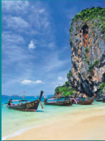
หาดเจ้าพระนาง