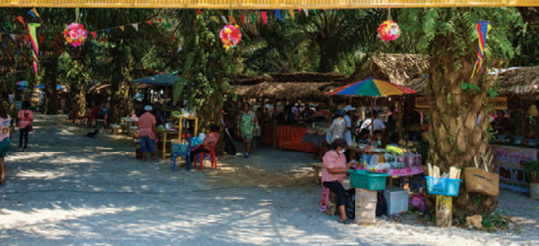
ตลาดบางทอง

ตลาดบางทอง ตั้งอยู่ใกล้วัดบางทอง ภายในบริเวณสวนปาล์ม บรรยากาศร่มรื่น ตกแต่งสถานที่ด้วยวัสดุจากธรรมชาติ และใช้ภาชนะใส่อาหารที่มาจากธรรมชาติเพื่อลดขยะและรักษาสิ่งแวดล้อม มีซุ้มจำหน่ายสินค้ากว่า ๑๐๐ ร้านค้า โดยเป็นสินค้าที่มาจากชุมชน เช่น ผลผลิตทางการเกษตร ผัก ผลไม้ปลอดสารพิษ อาหารทะเลสด อาหารและขนมพื้นบ้าน รวมไปถึงของที่ระลึกแฮนด์เมดหลากหลายรูปแบบ ตลาดเปิดทุกวันเสาร์ ตั้งแต่เวลา ๐๘.๐๐ น. เป็นต้นไป