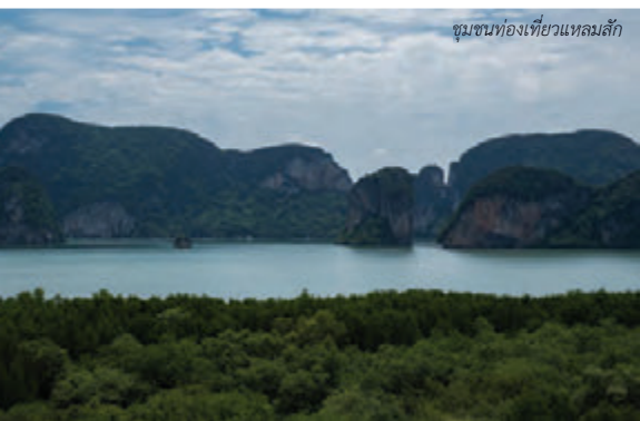
ชุมชนท่องเที่ยวแหลมลิ้ม