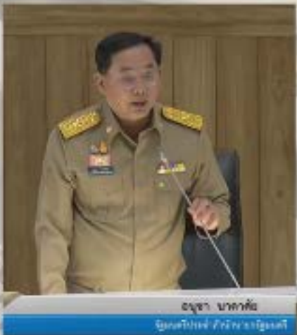
อูชา นาคาคิ รัฐมนตรีช่วยว่าการกระทรวงมหาดไทย