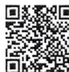
เอกสารประกอบ การพิจารณา สำนักวิชาการ