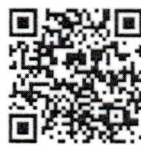
บันทึกการประชุมร่วมกัน ของรัฐสภา สำนักปรายงาน การประชุมและชวเลข