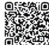
สถานการณ์ และแนวโน้ม เศรษฐกิจการคลัง ต่อการกำหนดนโยบายภาครัฐ