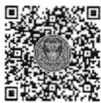
หนังสือนัดประชุม และระเบียบวาระการประชุม

หมายเหตุ การแจ้งนัดประชุมและการเผยแพร่เอกสารการประชุมได้ดำเนินการทางสื่ออิเล็กทรอนิกส์ ตามข้อบังคับการประชุมรัฐสภา พ.ศ. ๒๕๖๓ ข้อ ๑๓ สมาชิกรัฐสภาสามารถอ่านและดาวน์โหลดเอกสารประกอบการพิจารณาได้โดยการสแกน QR code หรือทาง www.parliament.go.th