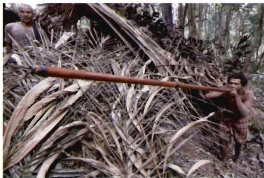
ภาพที่ ๓ อาวุธสำหรับล่าสัตว์ที่เรียกว่า “ตุต” หรือ “บอเลา”

สำหรับลักษณะที่พักของกลุ่มชาติพันธุ์มานิที่สร้างด้วยไม้ไผ่และใบไม้ตระกูลปาล์ม เรียกว่า “ทับ” มีลักษณะเป็นเพิงหมาแหงน สำหรับอาศัยหลบร้อนและพร้อมเคลื่อนย้ายไปตามแหล่งอาหาร แต่ละทับจะอยู่กันเป็นกลุ่ม ๆ ละประมาณ ๒๐ - ๓๐ คน