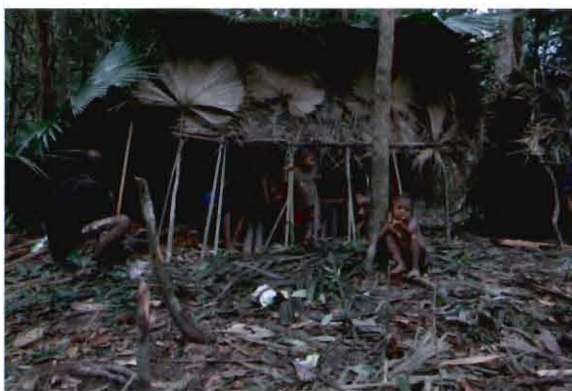
ภาพที่ ๔ ลักษณะที่พักของมานิที่สร้างด้วยไม้ไผ่และใบไม้ตระกูลปาล์มเรียกว่า “ทับ”