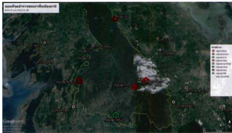
ภาพที่ ๒ แสดงแผนที่จุดสำรวจชนเผ่าพื้นเมืองมานิ

กลุ่มชาติพันธุ์มานิ ในปัจจุบันได้มีการเคลื่อนย้ายอยู่ในผืนป่าเทือกเขาบรรทัด ซึ่งตั้งแต่ปี พ.ศ. ๒๕๑๘ รัฐบาลได้ประกาศเป็นเขตรักษาพันธุ์สัตว์ป่าเขาบรรทัด พื้นที่ประมาณ ๘๐๕,๐๐๐ ไร่ ครอบคลุมบางส่วนของเขตปกครองจังหวัดตรัง สตูล พัทลุง และสงขลา