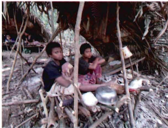
ภาพที่ ๑ แสดงลักษณะรูปร่างพื้นฐานของกลุ่มชาติพันธุ์มานิ

“กลุ่มชาติพันธุ์มานิ” เป็นคนดั้งเดิมในแหลมมลายู เป็นผู้บุกเบิกเข้ามาอยู่อาศัยใช้ชีวิต เคลื่อนย้ายไปตามแหล่งอาหาร ครอบครองพื้นที่ในผืนป่าแหลมมลายูมายาวนานหลายร้อยหลายพันปี กลุ่มชาติพันธุ์มานิ มีลักษณะรูปร่างพื้นฐานที่ค่อนข้างลำเตี้ย สันทัด ผิวสีดำแดง ผมหยิก เป็นกลุ่มคนที่จัดอยู่ในตระกูลนีกริโต (Negrito) และตระกูลออสโตรเนเซียน (Austronesian) ทั้งนี้ กลุ่มชาติพันธุ์มานิ มีพัฒนาการชาติพันธุ์อย่างต่อเนื่องและยาวนานในผืนป่าแหลมมลายู ตั้งแต่ภาคใต้ของไทยไปจนถึงประเทศ มาเลเซีย โดยอาศัยและเคลื่อนย้ายที่อยู่อย่างต่อเนื่อง บริเวณผืนป่าเทือกเขาบรรทัดและสันกาลาศีรี ในปัจจุบัน