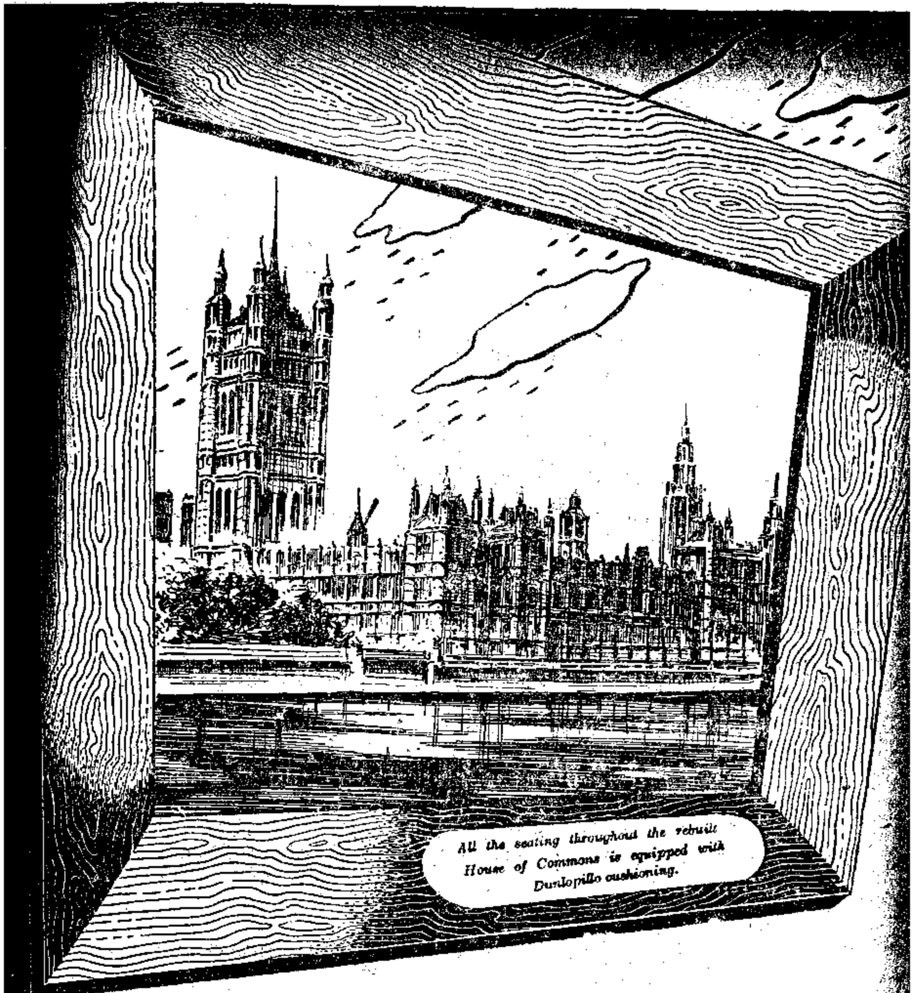
All the seating throughout the rebuilt House of Commons is equipped with Dunlopillo cushioning.