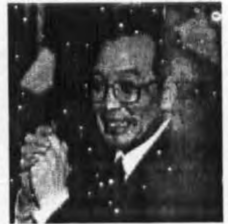
เวิน เจียเป่า

ประเทศจีนมีการปกครองเป็นลัทธิสังคมนิยมใน ลักษณะของตนเอง มีพรรคคอมมิวนิสต์จีนเป็นผู้กำหนดนโยบายต่างๆ ปัจจุบันมีนายหู จิ่นเทาเป็นประธานาธิบดี เลขาธิการพรรค และ ประธานคณะกรรมการทหารส่วนกลาง และมีนายเวิน เจียเป่า เป็นนายกรัฐมนตรี