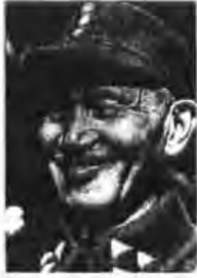
เจียง ไคเช็ก เป็นผู้นำของ จีนระหว่าง พ.ศ. ๒๔๗๑ ถึง พ.ศ. ๒๔๙๒

ระบอบสังคมนิยม หรือคอมมิวนิสต์ มีสาเหตุซึ่งสรุปได้ดังนี้