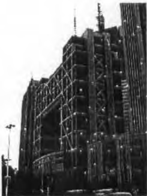
อาคารตลาดหลักทรัพย์เซี่ยงไฮ้

อาคารตลาดหลักทรัพย์เซี่ยงไฮ้ในย่านธุรกิจเขตผู้ตง เซี่ยงไฮ้ตั้งแต่เริ่มมีการเปิดเสรีทางเศรษฐกิจในปี พ.ศ. ๒๕๒๑ เศรษฐกิจของจีนซึ่งนำโดยการลงทุนและการส่งออก เติบโตขึ้น