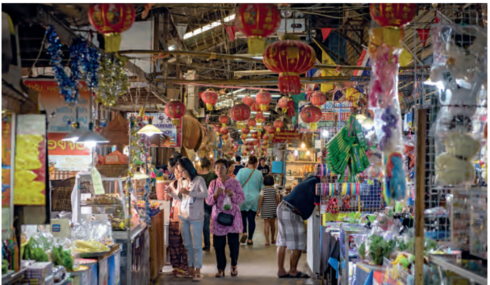
ตลาดคลองสวน ๑๐๐ ปี

รถโดยสารประจำทาง นั่งรถประจำทางสาย ฉะเชิงเทรา-ลาดกระบัง ลงหน้าทางเข้าตลาด แล้วเดินต่อเข้าไปประมาณ ๒๐๐ เมตร