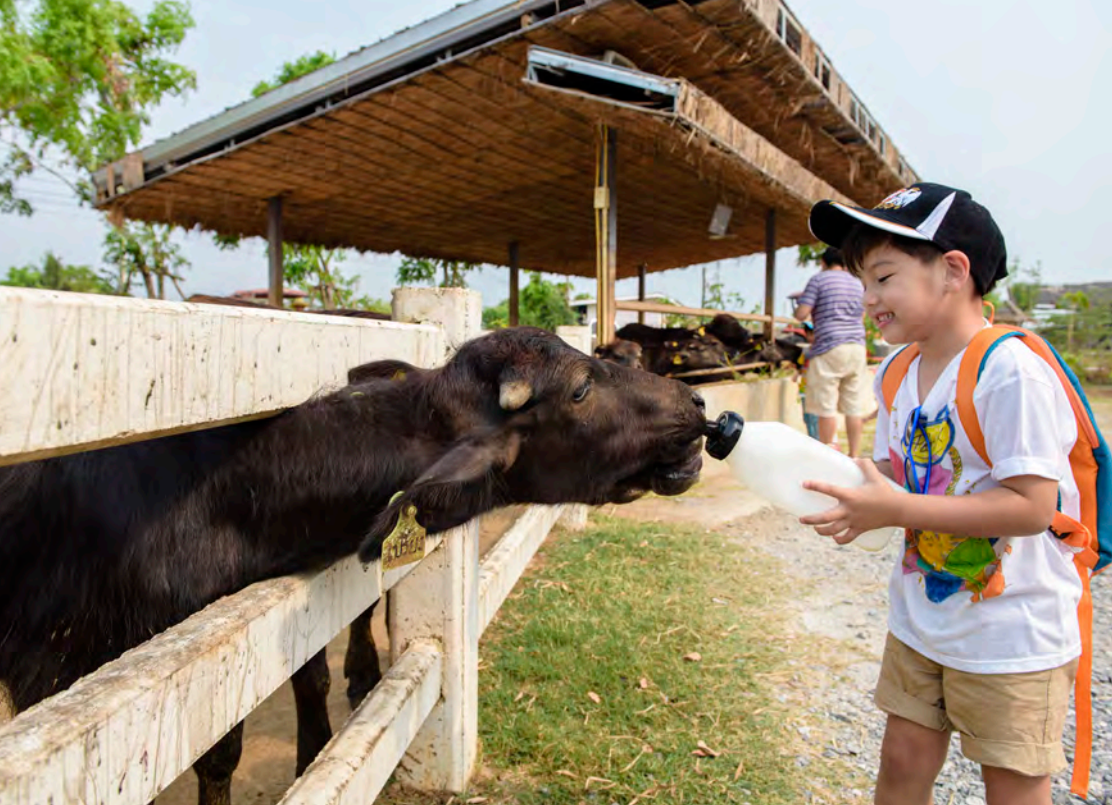
มินิมูร่าห์ฟาร์ม

นอกจากนั้นยังมี น้ำตกอ่างฤาไน หรือ น้ำตกบ่อทอง อยู่ที่หน่วยพิทักษ์ป่า น้ำตกบ่อทอง เกิดจากคลองหมากบนเขาอ่างฤาไน เป็นน้ำตกที่มีน้ำไหลตลอดปี ห่างจากที่ทำการเขตรักษาพันธุ์สัตว์ป่าเขาอ่างฤาไน ประมาณ ๔๐ กิโลเมตร มีทางเข้าจากบริเวณบ้านหนองคอก เส้นทางต้องใช้รถขับเคลื่อนสี่ล้อ ตัวน้ำตกอยู่ห่างจากหน่วยพิทักษ์ป่า น้ำตกบ่อทอง ประมาณ ๒ กิโลเมตร เป็นเส้นทางเดินป่าศึกษาธรรมชาติ เหมาะสำหรับผู้ที่สนใจเรียนรู้ศึกษาธรรมชาติอย่างแท้จริง และน้ำตกเขาตะกรับ ขึ้นอยู่กับหน่วยพิทักษ์ป่าเขาตะกรับ เลียดจากที่ทำการเขตรักษาพันธุ์สัตว์ป่าเขาอ่างฤาไน ประมาณ ๓๐ กิโลเมตร