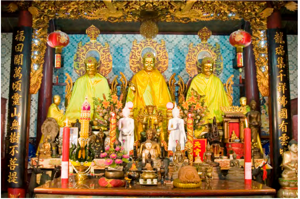
วัดจีนประชาลไมรม

กับการสวดมนต์ซึ่งได้บุญกุศล นอกจากนี้ยังมีวิหารศักดิ์สิทธิ์ต่างๆ เช่น วิหารบูรพาจารย์ วิหารเจ้าแม่กวนอิม วิหารตั้งจิ้งอ้วงและสระนทีสวรรค์ เป็นต้น