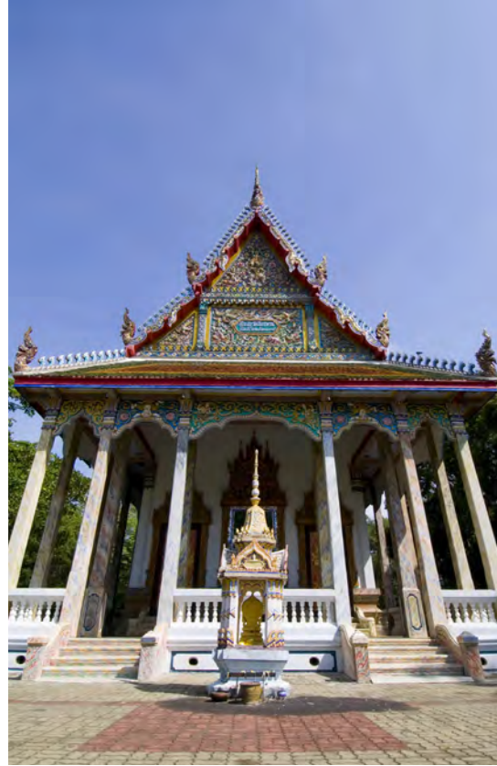
วัดสัมปทวนนอก

วัดสัมปทวนนอก อยู่ถนนศุภกิจ เดิมชื่อวัดสวนพริก (นอก) สร้างขึ้นปลายสมัยกรุงธนบุรี โดยพระภิกษุอิน และชาวบ้าน มีตำนานเกี่ยวกับหลวงพ่อกุศลโสธร ที่ลอยทวนน้ำในแม่น้ำบริเวณหน้าวัด มาเป็นชื่อเรียกวัดและสถานที่แห่งนี้ว่า “สามพระทวน” และกลายเป็น “สัมปทวน” ในที่สุด สิ่งที่น่าชมคือ พระอุโบสถที่มีลายปูนปั้นอยู่บนชายคากระเบื้องโบล