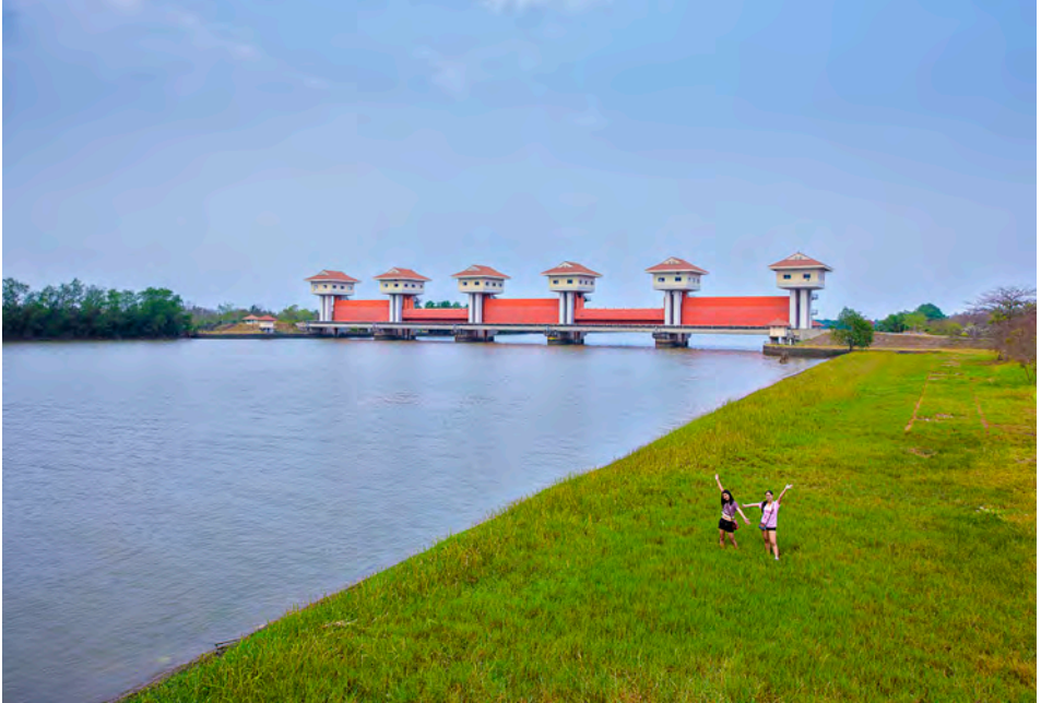
เขื่อนทดน้ำบางปะกง

ประดิษฐานพระพุทธรูปปางต่างๆ เปิดให้นักท่องเที่ยวเข้าชมทุกวัน