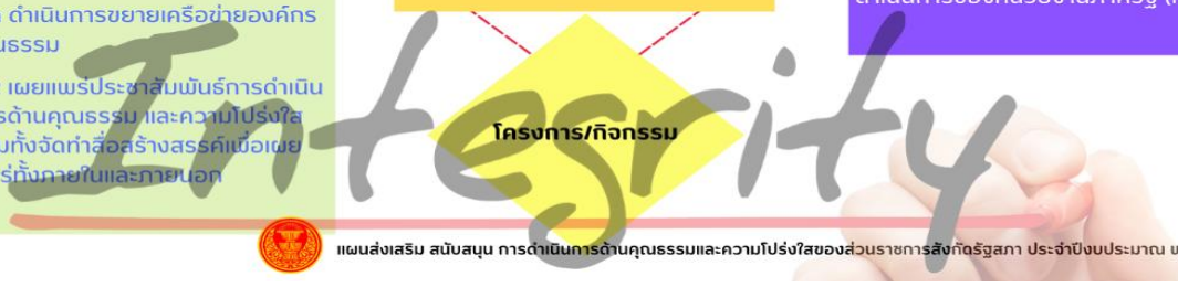
แผนส่งเสริม สนับสนุน การดำเนินการด้านคุณธรรมและความโปร่งใสของส่วนราชการสังกัดรัฐสภา ประจำปีงบประมาณ พ.ศ. ๒๕๖๖

แนวทางการดำเนินการตามมาตรการ ๓.๑ ขับเคลื่อนและประเมินการดำเนินการตามประมวลจริยธรรมและวินัยข้าราชการรัฐสภา ๓.๒ สนับสนุนการขับเคลื่อนการดำเนินการของชมรม STRONG MODEL ๓.๓ ขับเคลื่อนมาตรการสนับสนุนการประเมินคุณธรรมและความโปร่งใสในการดำเนินการของหน่วยงานภาครัฐ (ITA)