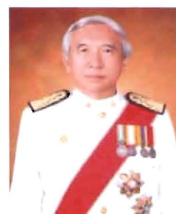
ศ.ศรีราชา วงศารยางกูร