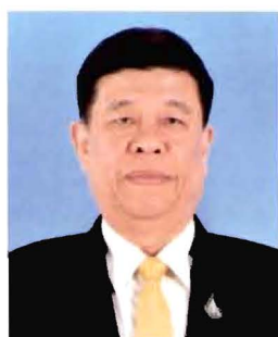
พลเอก สุรศักดิ์ กาญจนรัตน์