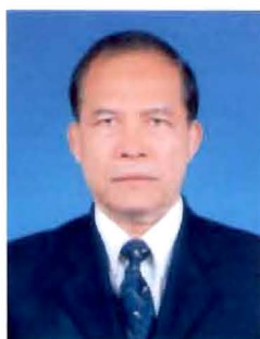
พลโท จเรศักดิ์ อานุภาพ