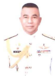
พลเอก ณ์ฐ อินทรเจริญ ที่ปรึกษาคณะกรรมการ