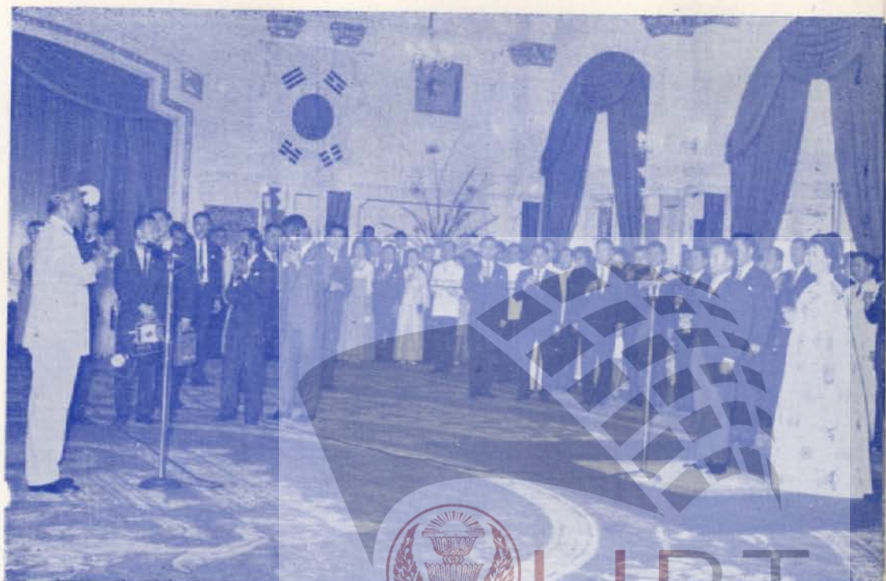
ฯพณฯ นายกรัฐมนตรี และท่านผู้หญิง จดงานสโมสร สันนิบาต เพื่อ เป็น เกียรติ แด่ ฯพณฯ ประธานาธิบดีแห่งสาธารณรัฐเกาหลีและภริยา ทำเนียบรัฐบาล ๑๑ กุมภาพันธ์ ๒๕๐๕