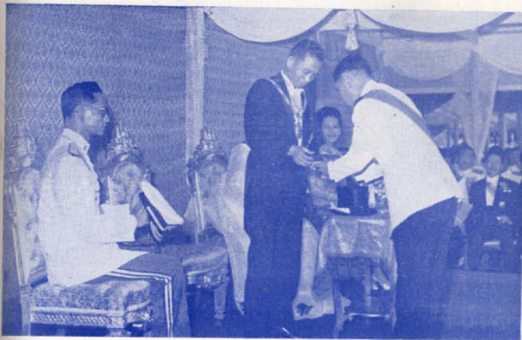
ปก - พระบาทสมเด็จพระเจ้าอยู่หัว และ สมเด็จพระนางเจ้า ฯ พระบรมราชินีนาถ ทรงต้อนรับ ฯพณฯ ปาร์กจุงฮี แห่งสาธารณรัฐเกาหลีและภริยา ทำอากาศยานดอนเมือง เมื่อเวลา ๑๐.๕๐ น. ๑๐ กุมภาพันธ์ ๒๕๐