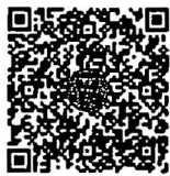
หนังสือนัดประชุม และระเบียบวาระการ ประชุมร่วมกันของรัฐสภา

เอกสารประกอบการประชุมร่วมกันของรัฐสภา ได้เผยแพร่ทางสื่ออิเล็กทรอนิกส์ ตามข้อบังคับการประชุมรัฐสภา พ.ศ. ๒๕๖๓ ข้อ ๑๓ โดยท่านสมาชิกฯ สามารถอ่านเอกสารประกอบการประชุมได้ โดยการสแกน QR code หรือทาง www.parliament.go.th