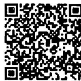
บันทึกการประชุมสภา สำนักrayงาน การประชุมและตัวเลข