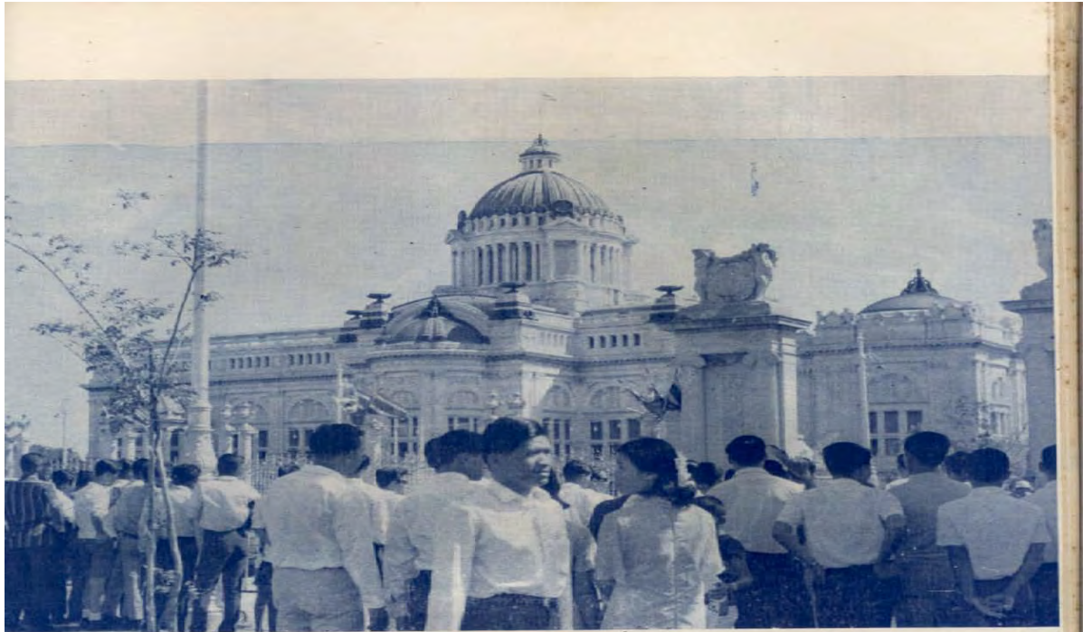
ประชาชนสนใจเข้าฟังการประชุมสภา ฯ นัคส์สำคัญ ๆ