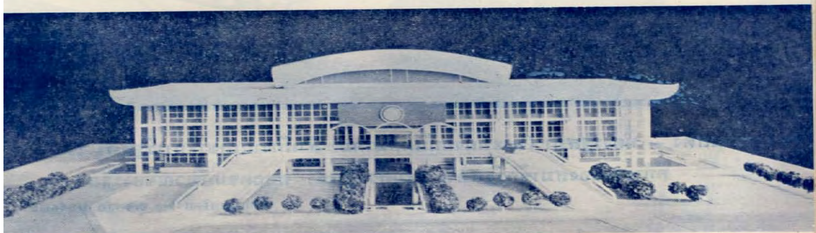
หุ่นจำลองแสดง — สำนักงานเลขาธิการรัฐสภา ออกแบบโดย พล จุลเสวก และคณะ

พระที่นั่งอนันตสมาคมซึ่งใช้เป็นี่ประชุมรัฐสภาาระหว่างปี 2475-2517