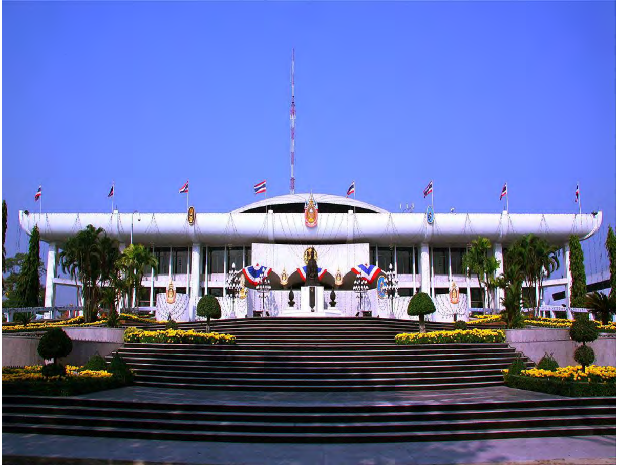
อาคารรัฐสภาที่ถนนอุทองโน

ถนนอุทองโน เป็นการประชุมสภานิติบัญญัติแห่งชาติ ชุดที่ 2 ครั้งที่ 67 วันพฤหัสบดีที่ 19 กันยายน 2517 เพื่อพิจารณารัฐธรรมนูญแห่งราชอาณาจักรไทย พุทธศักราช 2517 เช่นเดียวกัน ในขณะนี้อาจกล่าวได้ว่า พระที่นั่งอนันตสมาคมทำหน้าที่อาคารรัฐสภาในช่วงเวลาประมาณ 42 ปี (ปี 2475–2517) ขณะที่อาคารรัฐสภา ถนนอุทองโน ทำหน้าที่มาแล้วไม่น้อยกว่า 44 ปี (ปี 2517–2561)