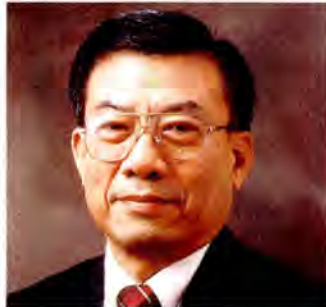
ศาสตราจารย์ ดร.ลิปพนธ์ เกตุทัต การศึกษา

นั้น ยังตามไม่ทัน จึงต้องมีการปฏิรูปต่อโครงสร้าง ระบบกฎเกณฑ์และผ่อนคลายความเข้มงวดของฝ่ายรัฐ ที่มีต่อภาคเอกชน ส่วนการปฏิรูปการศึกษานั้นควรปรับปรุงด้านโครงสร้างการบริหารจัดการศึกษา รวมถึงกฎหมายที่กำหนดระเบียบกฎเกณฑ์กำกับการศึกษา และพัฒนา หลักสูตรรวมทั้งการประเมินผลการศึกษาให้มีคุณภาพมากขึ้น"