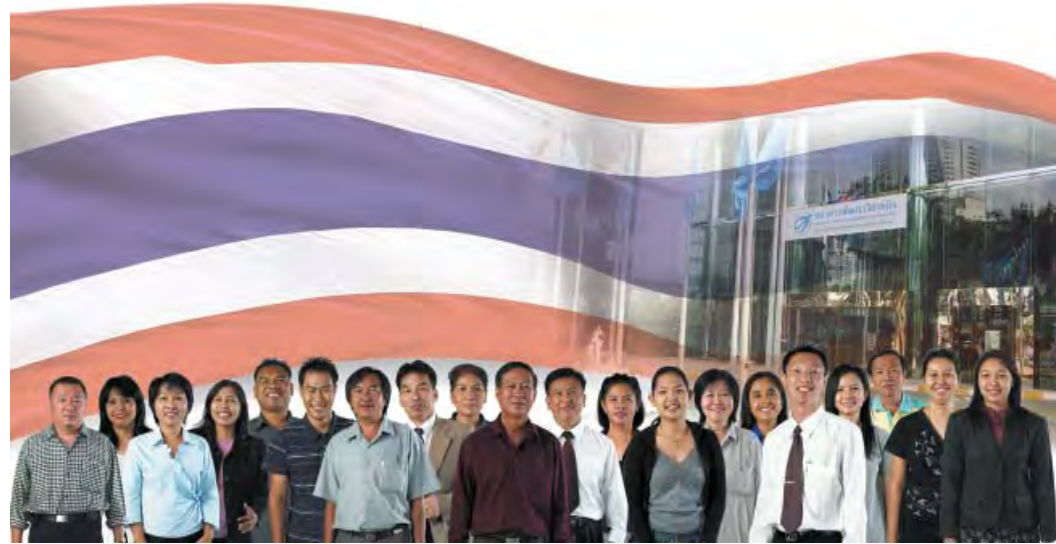
เป็นธนาคารเพื่อการสร้างสังคมผู้ประกอบการไทย