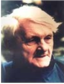
Dr. Joseph Needham

เป็นชาวอังกฤษซึ่งใช้เวลาเกือบ 50 ปีในการศึกษาค้นคว้าด้านวิทยาศาสตร์และเทคโนโลยีในสมัยโบราณของจีนเป็นคนแรกของโลก และเรียบเรียงเป็นหนังสือชื่อว่า Science and Civilisation in China ทำให้ความรู้ด้านวิทยาศาสตร์และเทคโนโลยีในสมัยโบราณของจีนเผยแพร่สู่ทั่วโลก ได้คะแนน 2,870,664