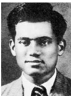
Dwarkanath S. Kotnis

เป็นชาวนิวซีแลนด์ และเป็นผู้เชี่ยวชาญด้านการศึกษาดังที่มุนาอะ ต่อสู้ที่จีนเป็นเวลา 60 ปี ได้คะแนน 2,356,251