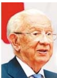
Juan Antonio Samaranchi

เป็นชาวเยอรมันที่ช่วยเหลือชีวิตชาวจีนจำนวน 250,000 คน จากการสังหารหมู่ในระหว่างสงครามเมืองนานกิงของกองทัพจักรวรรดิญี่ปุ่น ถือเป็นโศกนาฏกรรมที่ได้รับการประณามไปทั่วโลก ด้วยพฤติกรรมที่โหดร้ายทารุณ อย่างไม่เลือกเพศและวัย ได้คะแนน 4,097,787