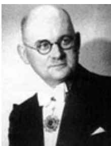
John H. D. Rabe

เป็นแพทย์แผนกศัลยกรรมชาวแคนาดาที่อาสาเข้ามาทำงานในหน่วยช่วยเหลือจีนระหว่างประเทศในระหว่างสงครามต่อต้านการรุกรานของญี่ปุ่น และเป็นผู้พลีชีวิตเพื่อสงครามต่อต้านการรุกรานของญี่ปุ่นต่อจีน ได้คะแนน 4,694,484