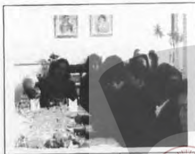
คณะกรรมการและคณะพบปะแลกเปลี่ยนความคิดเห็นกับนักเรียนไทย

เทศบาลจัดการพัฒนาครูร่วมกับมหาวิทยาลัยและสถาบันอื่น ๆ โดยรัฐบาลกลางรับผิดชอบค่าใช้จ่ายในเรื่องพัฒนาระดับชาติทั้งหมด และในส่วนท้องถิ่นโดยเทศบาลรับผิดชอบค่าใช้จ่ายในการฝึกอบรมหลักสูตรระยะสั้น