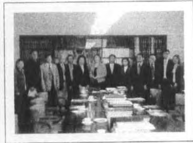
เข้าพบประธานคณะกรรมการการศึกษา