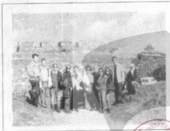
ศึกษาดูงาน ณ เกาะซัวเมนลันนา