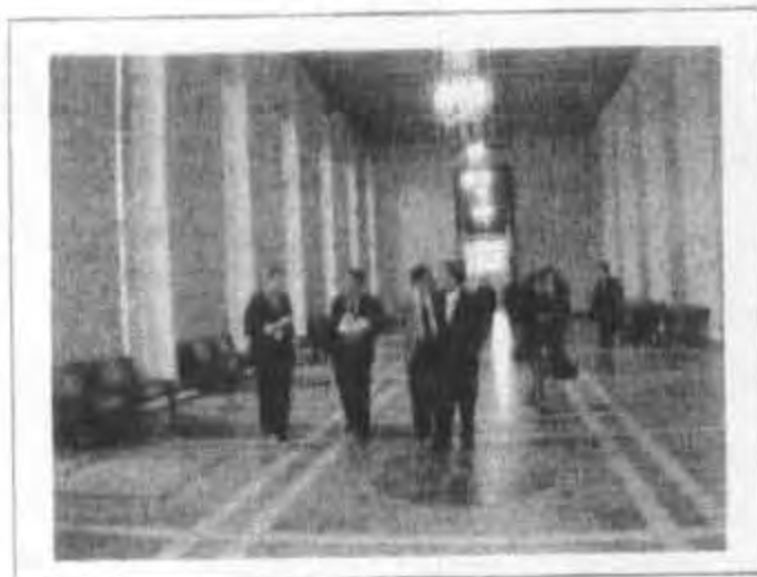
ศึกษาดูงาน ณ รัฐสภาฟินแลนด์