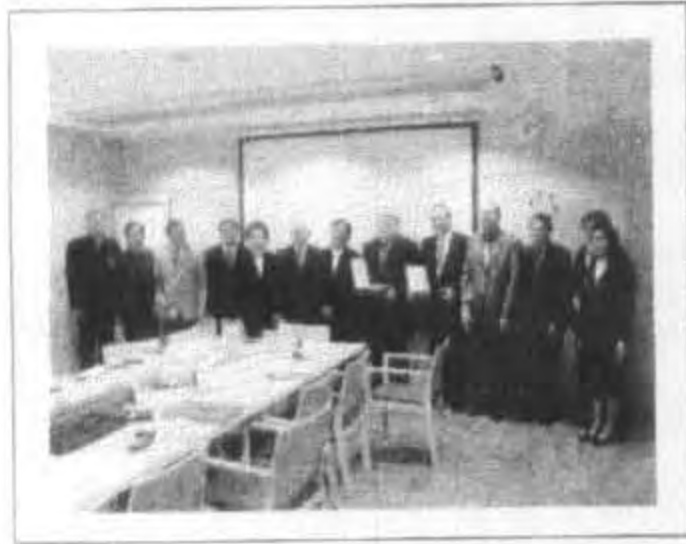
ศึกษาดูงาน ณ กระทรวงศึกษาธิการ