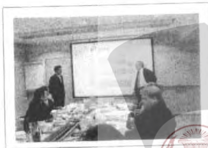
ศึกษาดูงานที่กระทรวงศึกษาธิการ

การจัดการการศึกษาของสาธารณสุขฟินแลนด์เป็นตัวอย่างการจัดการการศึกษาที่มี คุณภาพมาตรฐานสูงสู่นานท้องถิ่น ซึ่งเป็นหัวใจของคุณภาพการจัดการศึกษาอย่างแท้จริง