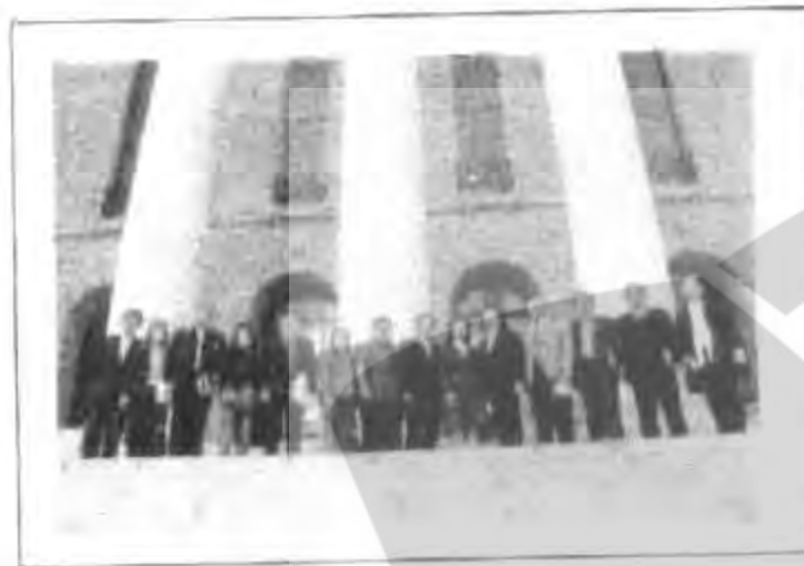
เยี่ยมชมและศึกษาดูงาน ณ รัฐสภาของสาธารณรัฐฟินแลนด์

๒. ในจำนวนสมาชิกสภา ๒๐๐ คน เป็นสุภาพสตรีถึง ๗๕ คน คิดเป็น ๓๗.๕% น่าจะได้ มีบทศึกษาจากผู้มีสิทธิเลือกตั้งว่าเขาคิดอย่างไร