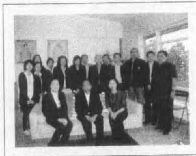
เข้าเยี่ยมคารวะอุปทูตไทย ประจำสาธารณรัฐฟินแลนด์