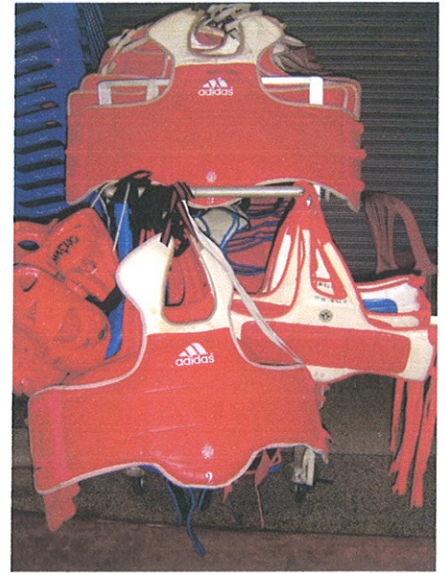
เกราะป้องกันลำตัว