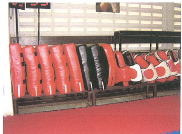
เป้าเตะ(ใหญ่)