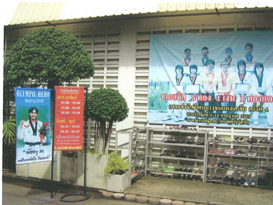
ป้ายแสดงรายละเอียดกำหนดการเรียนเทควันโดและเชิญชวน