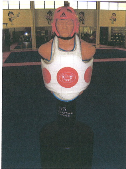
หุ้มเป้าเตะ