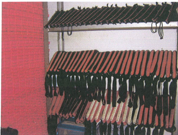
เป้าเตะ(เล็ก)