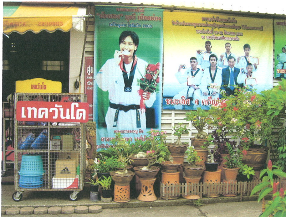
ป้ายแสดงผลงาน หน้าศูนย์ฝึกกีฬาเทควันโด ยิม 3