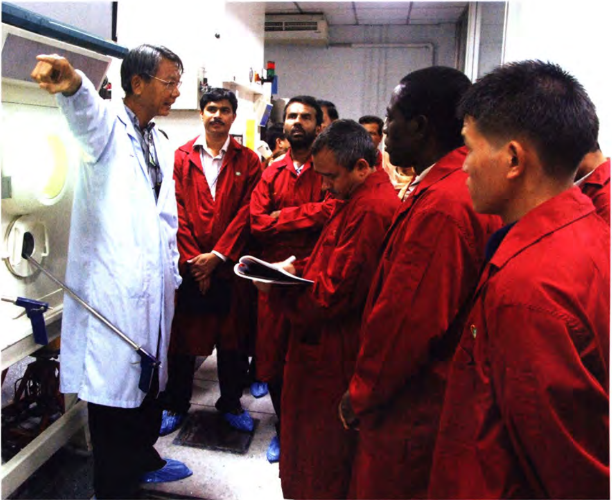
การฝึกอบรมหลักสูตรประจำปีด้านการจัดการขยะพิษ

กระทรวงและหน่วยงานต่าง ๆ ของรัฐที่ให้ความช่วยเหลือเพื่อการพัฒนาอย่างเป็นทางการ และข้อมูลและการประสานงานด้านความช่วยเหลือเพื่อการพัฒนาอย่างเป็นทางการ