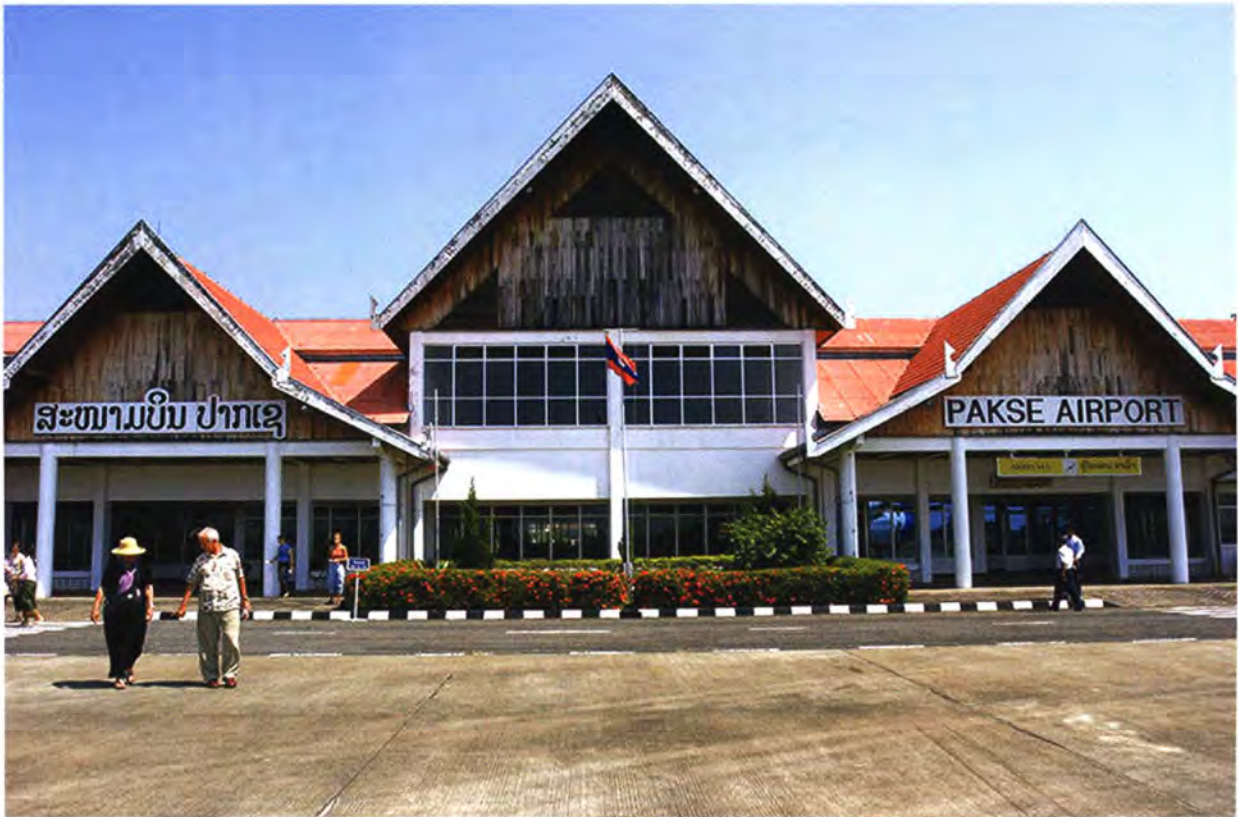
โครงการปรับปรุงสนามบินปากเซ ประเทศลาว

กระทรวงและหน่วยงานต่าง ๆ ของรัฐที่ให้ความช่วยเหลือเพื่อการพัฒนาอย่างเป็นทางการ และข้อมูลและการประสานงานด้านความช่วยเหลือเพื่อการพัฒนาอย่างเป็นทางการ