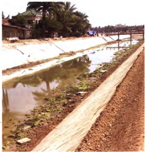
โครงการก่อสร้างร่องระบายน้ำ และปรับปรุงถนน T2 ในนครหลวงเวียงจันทน์

ความช่วยเหลือเพื่อการพัฒนาของไทยในรูปการให้ความร่วมมือทางวิชาการโดย สพร. และกระทรวงหลักๆ ส่วนใหญ่ มุ่งเน้นที่เป้าหมายดังกล่าว ตัวอย่างเช่น สำนักงานคณะกรรมการการอุดมศึกษาและกระทรวงสาธารณสุขร่วมกับสพร. ให้ความร่วมมือทางวิชาการด้านโรคเอดส์ สาธารณสุขและการดูแลสุขภาพ กระทรวงเกษตรและสหกรณ์ และกระทรวงพลังงานร่วมกับสพร. ให้การสนับสนุนในการพัฒนาและสร้างความหลากหลายทางการเกษตรใน สปป.ลาว ซึ่งจะช่วยลดความยากจน นอกจากนี้ กระทรวงพาณิชย์ ดำเนินโครงการด้านการส่งเสริมการส่งออกสินค้าหัตถกรรมจากลาว กระทรวงการท่องเที่ยวและกีฬา ดำเนินโครงการด้านการส่งเสริมการท่องเที่ยวในลาว ทั้งสองโครงการนี้ช่วยสร้าง