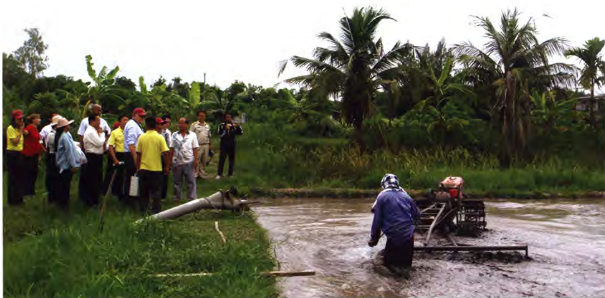
คณะผู้แทนจากแอฟริกาและเอเชียใต้ศึกษาดูงานด้านเศรษฐกิจพอเพียง ที่อำเภอหนองจอก กรุงเทพฯ (พฤษภาคม 2551)