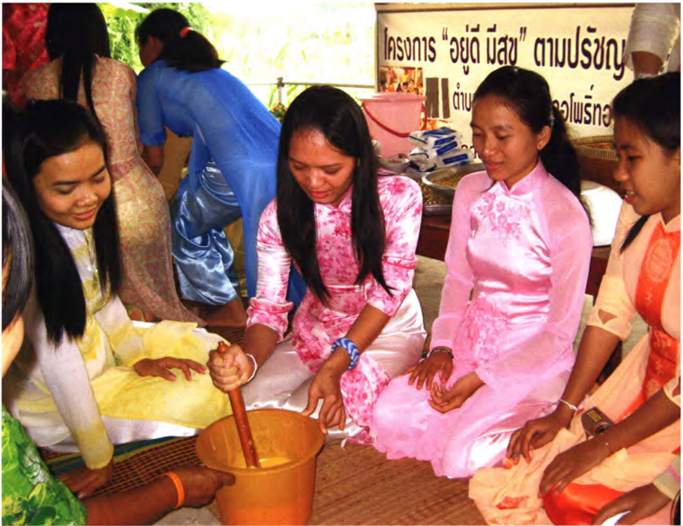
นักศึกษาเวียดนามร่วมโครงการโอมสเตย์