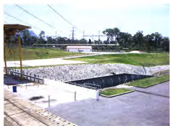
สถานีไฟฟ้าพลังน้ำจากเขื่อนแก่งหินปูน ประเทศลาว