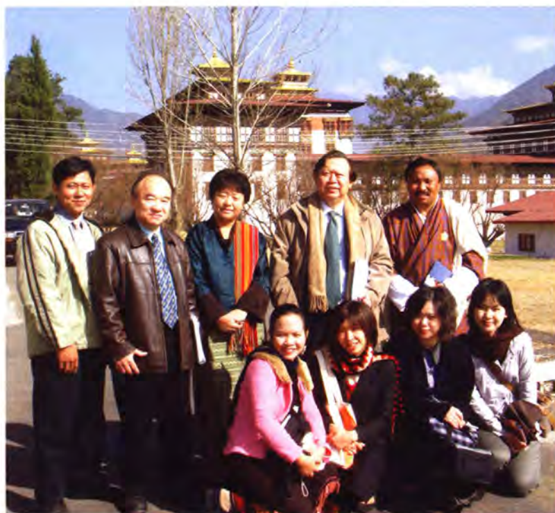
เจ้าหน้าที่อาสาสมัครชาวไทยที่ทำงานโครงการพัฒนาในพม่า (2551)

ในปี 2539 7 ไทยมีมูลค่าความช่วยเหลือเพื่อการพัฒนา รวมทั้งสิ้น 4,250 ล้านบาท หรือ 170 ล้านเหรียญสหรัฐ ซึ่งคิดเป็นร้อยละ 0.13 ของรายได้มวลรวมประชาชาติ (GNI) เป็นความช่วยเหลือแบบให้เปล่าร้อยละ 12 และเงินกู้ผ่อนปรนร้อยละ 88 ของมูลค่าความช่วยเหลือทั้งหมด เงินกู้ส่วนใหญ่เป็นการก่อสร้างโครงสร้างสาธารณูปโภคพื้นฐานในพม่า ทั้งนี้ เงินให้เปล่าส่วนใหญ่ให้แก่ประเทศในอนุภูมิภาคลุ่มน้ำโขง โดยเฉพาะอย่างยิ่งกัมพูชา และลาว ดังนั้น จึงกล่าวได้ว่าความช่วยเหลือเพื่อการพัฒนา ของไทยไม่น้อยกว่าร้อยละ 95 ของมูลค่ารวมเป็นโครงการที่ให้แก่ประเทศที่มีการพัฒนาน้อยที่สุด ในขณะที่เป้าหมายของ OECD คือประเทศผู้ให้จะต้องให้ความช่วยเหลือแก่ประเทศที่มีการพัฒนาน้อยที่สุดอย่างน้อยที่สุด ร้อยละ 20 ของความช่วยเหลือเพื่อการพัฒนา ทั้งหมด