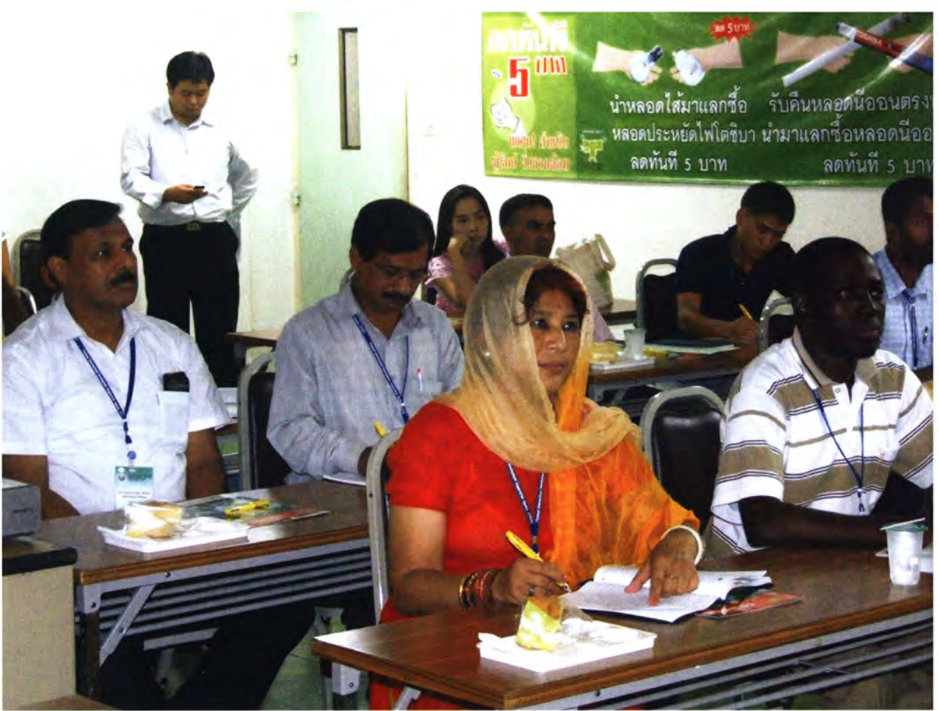
การฝึกอบรมหลักสูตรประจำปีด้านการจัดการขยะพิษ