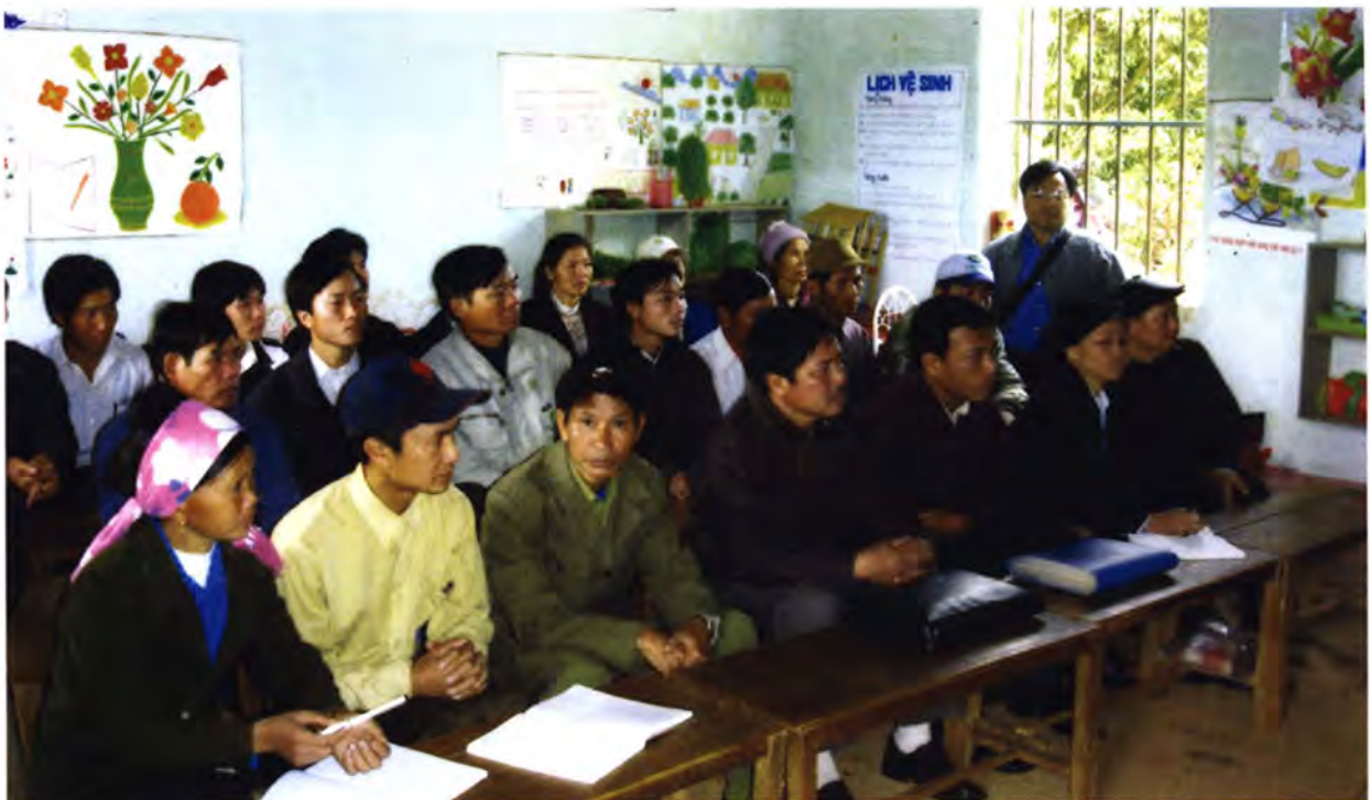
โครงการพัฒนาเกษตรเขตน้ำท่วม เมืองน้ำบัก แขวงหลวงพระบาง ประเทศลาว

ประเทศเพื่อนบ้าน (สพพ.) (องค์การมหาชน) (จำนวน 350 ล้านบาท เพื่อการก่อสร้างโครงสร้างพื้นฐานในกัมพูชาและลาว) สำนักงานความร่วมมือเพื่อการพัฒนาระหว่างประเทศ (สพร.) (จำนวน 330 ล้านบาท สำหรับโครงการความร่วมมือทางวิชาการต่างๆ และเพื่อให้การสนับสนุนแก่องค์การระหว่างประเทศ) กระทรวงการต่างประเทศ (จำนวน 278 ล้านบาทให้แก่องค์การระหว่างประเทศ) กระทรวงศึกษาธิการ และสำนักงานคณะกรรมการการอุดมศึกษา (76 ล้านบาทและ 7.6 ล้านบาทเพื่อการศึกษาและฝึกอบรม) กระทรวงพลังงาน (จำนวน 111 ล้านบาทสำหรับโครงการพลังงานหมุนเวียน) กระทรวงเกษตรและสหกรณ์ (จำนวน 58 ล้านบาทเพื่อการพัฒนาทางการเกษตร) และกระทรวงสาธารณสุข (จำนวน 23 ล้านบาทเพื่อการป้องกันโรคติดต่อและการส่งเสริมสุขภาพอื่นๆ)