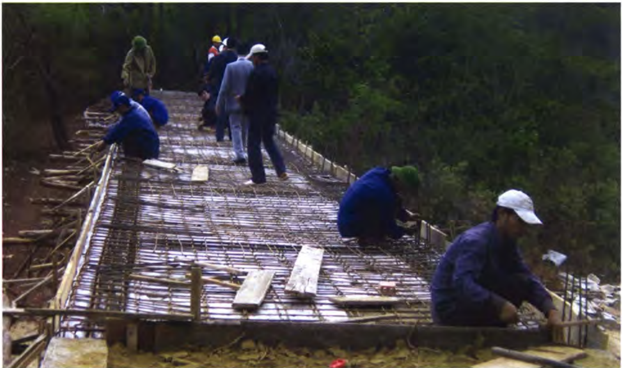
โครงการพัฒนาเกษตรเขตน้ำท่วม เมืองน้ำบาก แขวงหลวงพระบาง ประเทศลาว

งบประมาณของสพพ. สำหรับการให้ความร่วมมือทางวิชาการเพิ่มขึ้นอย่างมีนัยสำคัญระหว่างปี 2545 ถึง 2550 คือเพิ่มขึ้นถึงร้อยละ 37 ในขณะที่ สพพ. เป็นองค์กรที่ให้เงินช่วยเหลือแบบให้เปล่ารายใหญ่ ซึ่งทำให้เงินช่วยเหลือแบบให้เปลามีสัดส่วนที่สูงขึ้นมากกว่าปีที่ผ่านมากล่าวคือไม่น้อยกว่าร้อยละ 90 ของมูลค่าความช่วยเหลือเพื่อการพัฒนา ให้แก่ประเทศพัฒนาน้อยที่สุด และคิดเป็น