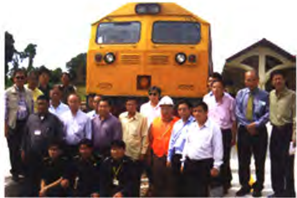
โครงการก่อสร้างเส้นทางรถไฟเชื่อมต่อระหว่างจังหวัดหนองคาย-ทวนาแล้ง ประเทศลาว

ความร่วมมือแบบใต้-ใต้ (South-South Cooperation) — หนึ่งในรูปแบบย่อยของความร่วมมือในลักษณะนี้ คือ “ความร่วมมือทางวิชาการระหว่างประเทศกำลังพัฒนา (TCDC)” ซึ่งตัวอย่างที่ดีที่สุดคือ งานของสพร. ด้านการพัฒนาทรัพยากรมนุษย์และการสร้างขีดความสามารถกับประเทศคู่ร่วมมือ รูปแบบความร่วมมือใต้-ใต้นี้เป็นหัวใจสำคัญของความช่วยเหลือเพื่อการพัฒนา ของไทยในภาพรวม ซึ่งรวมถึงความช่วยเหลือแก่องค์กรระหว่างประเทศและองค์กร