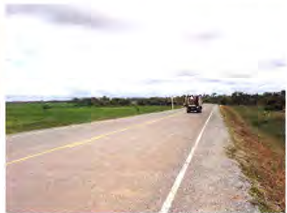
โครงการปรับปรุงและลาดยางผิวจราจรเส้นทาง สายตราด-เกาะกง-สระแรมเปิล (R4B) ประเทศกัมพูชา