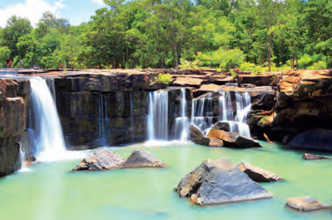
น้ำตกตาดโตน

ซ้าย ๒๑ กิโลเมตร ไปน้ำตกตาดโตน หากโดยรถโดยสารประจำทาง ใช้รถสองแถวสายชัยภูมิ-ทำหินโงม ลงที่ด่านเก็บค่าธรรมเนียมแล้วเดินเท้าเข้าไปอีก ๑ กิโลเมตร