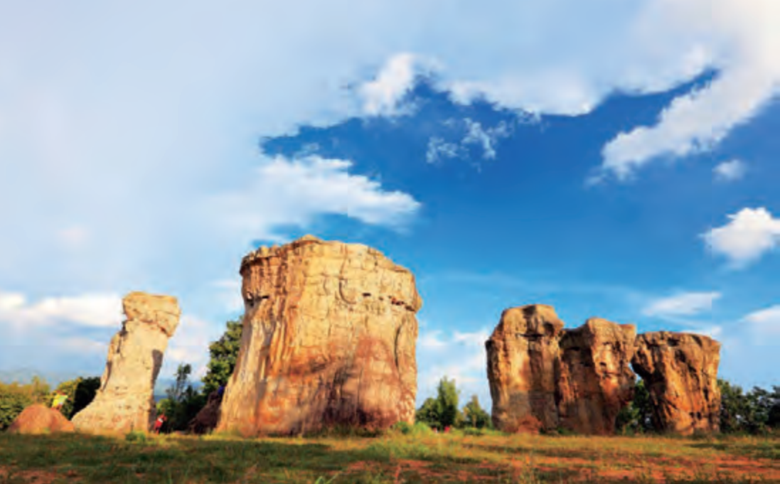
มอหินขาว

จุดชมวิวลานหินร่องกล้า เป็นลานหินกว้างใหญ่และหินแตกเป็นร่องลึกจำนวนมาก เป็นผาหินเด่นชัดสูงจากระดับน้ำทะเล ๗๐๐-๘๐๐ เมตร