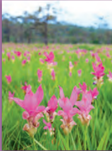
ทุ่งดอกกระเจียว