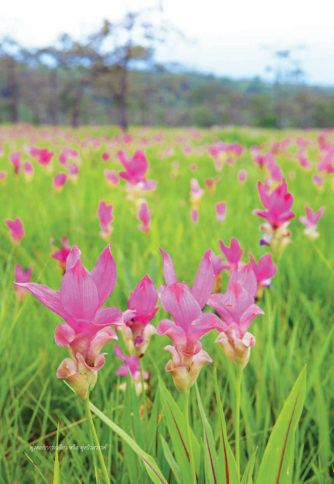
ทุ่งดอกกระเจียว หรือ ทุ่งบัวสวรรค์