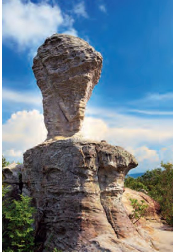
อุทยานป่าหินงาม

อุทยานแห่งชาติป่าหินงาม จัดตั้งเป็นอุทยานแห่งชาติเมื่อวันที่ ๖ มิถุนายน ๒๕๕๐ บนทิวเขาพังเหย ตำบลบ้านไร่ สูงจากระดับน้ำทะเล ประมาณ ๓๐๐-๘๔๖ เมตร มีเนื้อที่ประมาณ ๑๐๐ ตารางกิโลเมตร ภูมิประเทศเป็นเนินเขาสลับซับซ้อน มีลานหินรูปลักษณะสวยงามเป็นหมวดหินภูพาน หมวดหินพระวิหาร และหมวดหินภูกระดึงเป็นหินในยุคจูแรสซิก และไทรแอสซิก ประมาณ ๑๘๐-๒๓๐ ล้านปี ทั้งผืนป่าปกคลุมด้วยป่าเต็งรัง ป่าดิบแล้ง และป่าเบญจพรรณ มีดอกกุหลาบ ดอกเอนอ้า และดอก