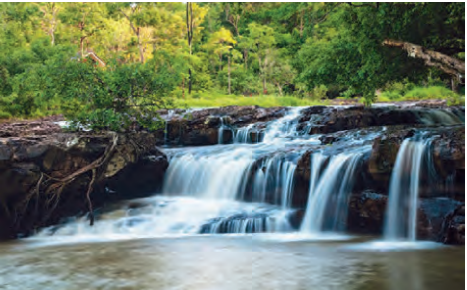
น้ำตกไทรทอง

ความหนาวเย็นของอากาศ ซึ่งขึ้นชื่อว่าเป็นหน้าผาที่หนาวเสียวที่สุดเมื่อขึ้นไปนั่งบนชะง่อนหินนั้น และเป็นจุดชมทิวทัศน์ที่สวยงามของจังหวัดชัยภูมิ ค่าธรรมเนียมเข้าอุทยานฯ ชาวไทย ผู้ใหญ่ ๔๐ บาท เด็ก ๒๐ บาท ชาวต่างชาติ ๒๐๐ บาท ยานพาหนะ ๔ ล้อ ๓๐ บาท ยานพาหนะ ๖ ล้อขึ้นไป ๑๐๐ บาท เปิดทุกวัน เวลา ๐๘.๐๐-๑๖.๓๐ น. อุทยานฯ มีบ้านพักรับรองและสถานที่กางเต็นท์พักผ่อน สอบถามข้อมูลได้ที่ อุทยานแห่งชาติไทรทอง ตู้ ปณ. ๑ อำเภอหนองบัวระเหว จังหวัดชัยภูมิ ๓๖๒๕๐ โทร. ๐๘ ๙๒๘๒ ๓๔๓๗ หรือ กรมอุทยานแห่งชาติ สัตว์ป่าและพันธุ์พืช โทร. ๐ ๒๕๖๒ ๐๗๖๐ www.dnp.go.th การเดินทาง จากที่ว่าการอำเภอหนองบัวระเหว ใช้ทางหลวงหมายเลข ๒๒๕ (ชัยภูมิ-นครสวรรค์) ประมาณ ๓๗ กิโลเมตร มีป้ายบอกทางแยกขวา