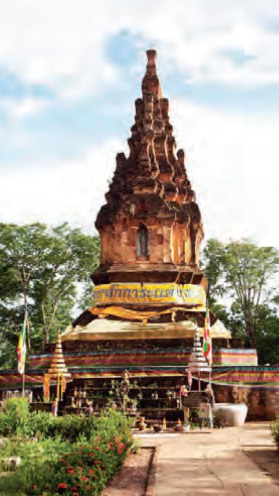
พระธาตุหนองสามหมื่น

ฟังเสียงสัตว์ป่าที่ออกหากินกลางคืน เส้นทางเข้าเป็นถนนดินลัดเลาะตามแนวป่า ไม่มีไฟฟ้า ไม่มีน้ำประปา การเดินทาง จากที่ว่าการอำเภอบ้านเขว้าใช้ทางหลวงหมายเลข ๒๒๕ ระยะทาง ๑๘ กิโลเมตร