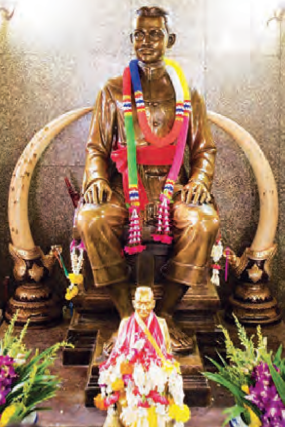
ศาลเจ้าพ่อพระยาแล

บริเวณบ้านท่าโป่งไปที่ทำการอุทยานฯ อีก ๗ กิโลเมตร อยู่ห่างจากตัวเมืองระยะทางประมาณ ๗๐ กิโลเมตร