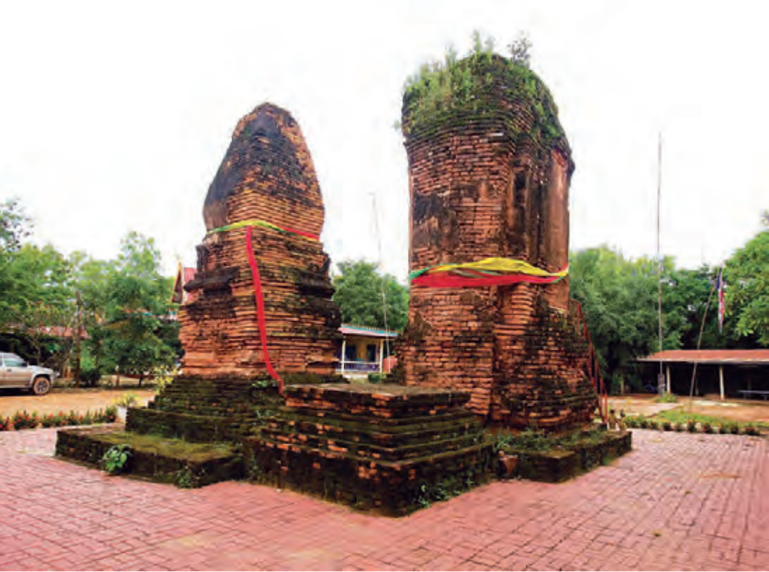
พระธาตุกุดจอก

เศียรเดียว ภายในเจดีย์ประดิษฐานพระพุทธรูปปูนปั้นแบบนูนสูง ปางถวายเนตรประทับยืน ยอดเจดีย์พังลงมาส่วนใหญ่ ธาตุเจดีย์องค์ที่สอง ทรงบัวทำเป็นรูปสอบปลายแหลมคล้ายพระธาตุพนม ธาตุเจดีย์องค์นี้มีฐานสูงประมาณ ๕ ชั้น เป็นมุขยื่นและเป็นมุมสวยงาม ภายในเจดีย์องค์นี้ประดิษฐานพระพุทธรูปหินทรายปางมารวิชัย ลักษณะธาตุเจดีย์ทั้งสององค์เป็นสถาปัตยกรรมแบบล้านช้าง มีอายุอยู่ในราวพุทธศตวรรษที่ ๑๙-๒๐ ปัจจุบันมีสำนักสงฆ์ตั้งอยู่ทุกวันขึ้น ๑๕ ค่ำ เดือน ๕ ของทุกปี ชาวบ้านอย่างน้อยจะจัดให้มีการสงฆ์พระธาตุ เพื่อเป็นการสืบสานประเพณีและรักษาขนบธรรมเนียม