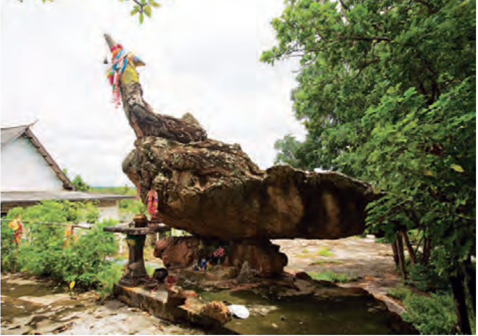
วัดสระหงษ์

๑๙.๐๐ น. สอบถามข้อมูล โทร. ๐๘ ๑๙๙๙ ๒๕๘๐, ๐๘ ๑๙๙๙ ๒๕๙๐