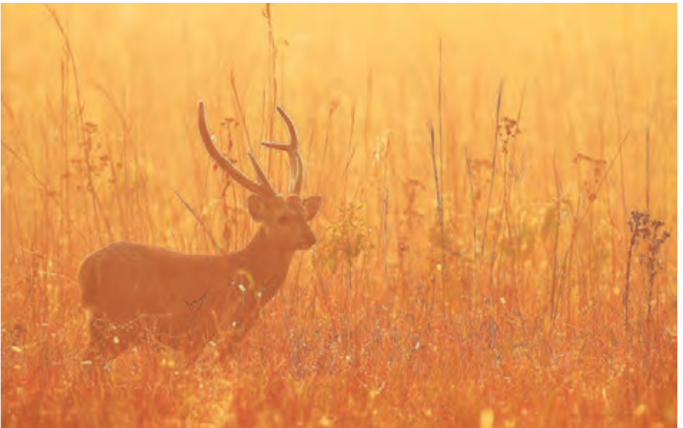
กวางป่าแซมบว