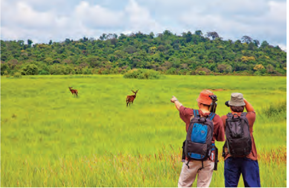
เขตรักษาพันธุ์สัตว์ป่าฯ หู่งกะมัง