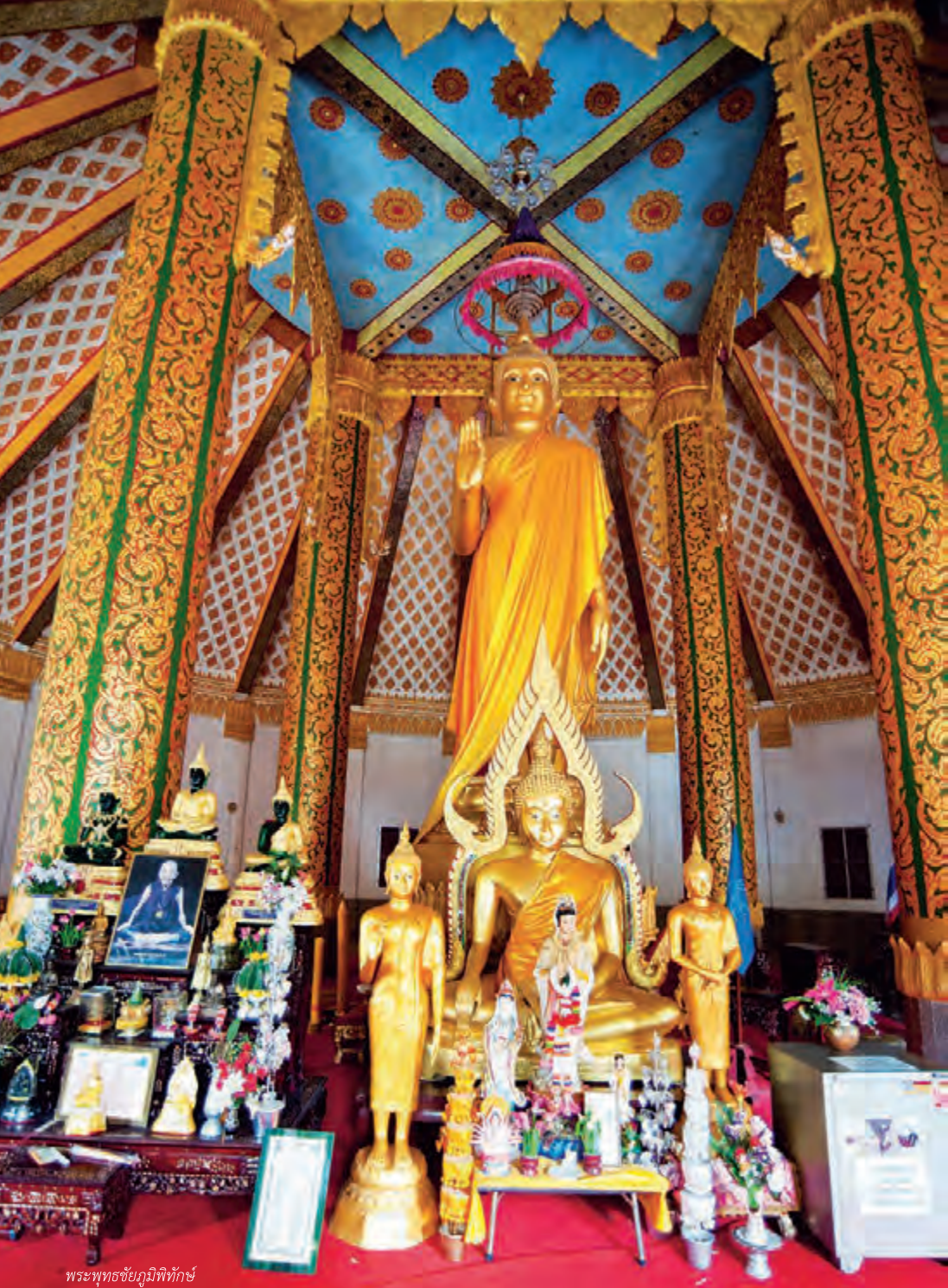
พระพุทธรูปชัยภูมิพิทักษ์