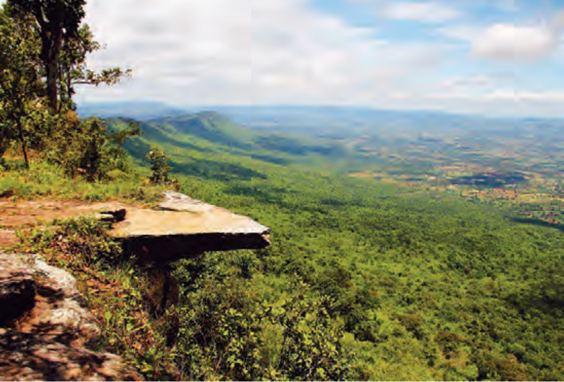
จุดชมทิวทัศน์ผาห้าหลด อุทยานแห่งชาติไทรทอง

ลงสู่หน้าตกไทรทอง มีความยาว ๑๕๐ เมตร จากหน้าตกไทรทองขึ้นไปถึงน้ำตกชวนชมมีเส้นทางเดินศึกษาธรรมชาติระยะทาง ๒ กิโลเมตร มีจุดเด่นต่าง ๆ ตามเส้นทาง เช่น ผาพิมใจ ดงเฟิร์นข้าหลวงหลังลาย น้ำตกบุษบากร ตลอดเส้นทางร่มรื่นด้วยพันธุ์ไม้สวยงามหลากหลายชนิด