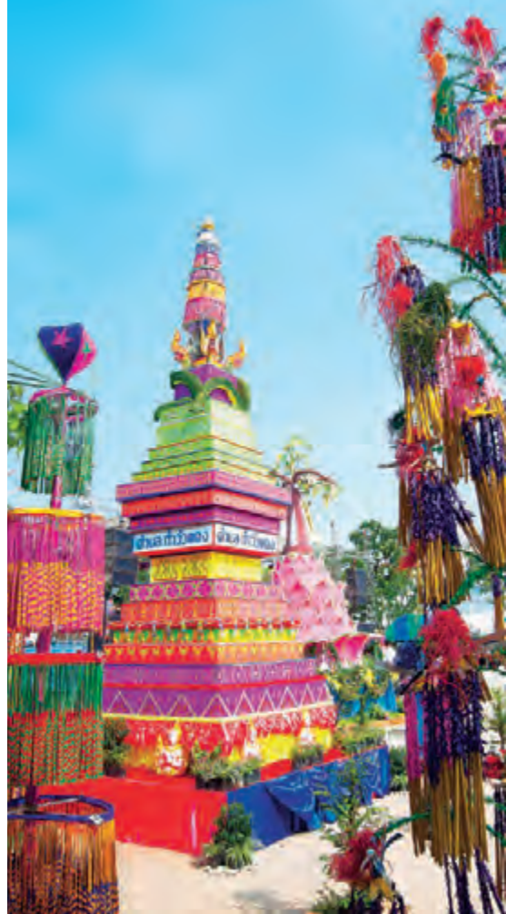
งานประเพณีโฮมบุญออกพรรษา “แห่กระธูป”

งานบุญเดือนหกสักการะเจ้าพ่อพระยาแล จัดในวันจันทร์แรกของเดือนพฤษภาคมของทุกปี (รวม ๓ วัน ๓ คืน) ที่ศาลหนองปลาเฒ่า ชาวบ้านจัดพิธีเคารพสักการะดวงวิญญาณเจ้าพ่อ และรำถวายเจ้าพ่อที่