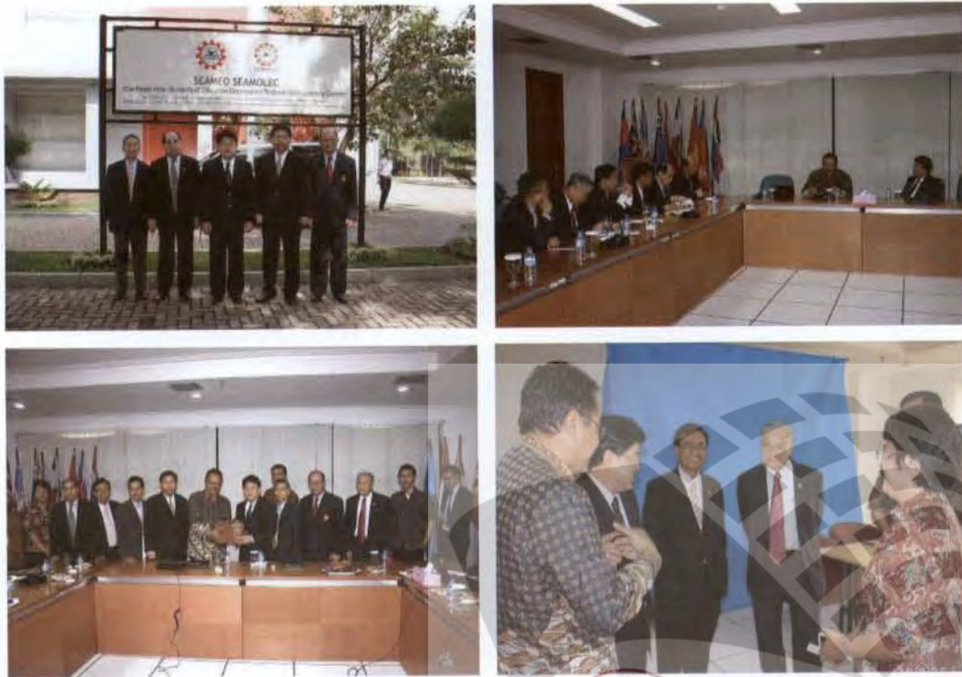
ภาพบรรยากาศการร่วมแลกเปลี่ยนความคิดเห็น ณ ศูนย์เครือข่ายระดับภูมิภาคว่าด้วยการศึกษา แบบเปิด (SEAMEO : Regional Open Learning Center : SEAMOLEC)