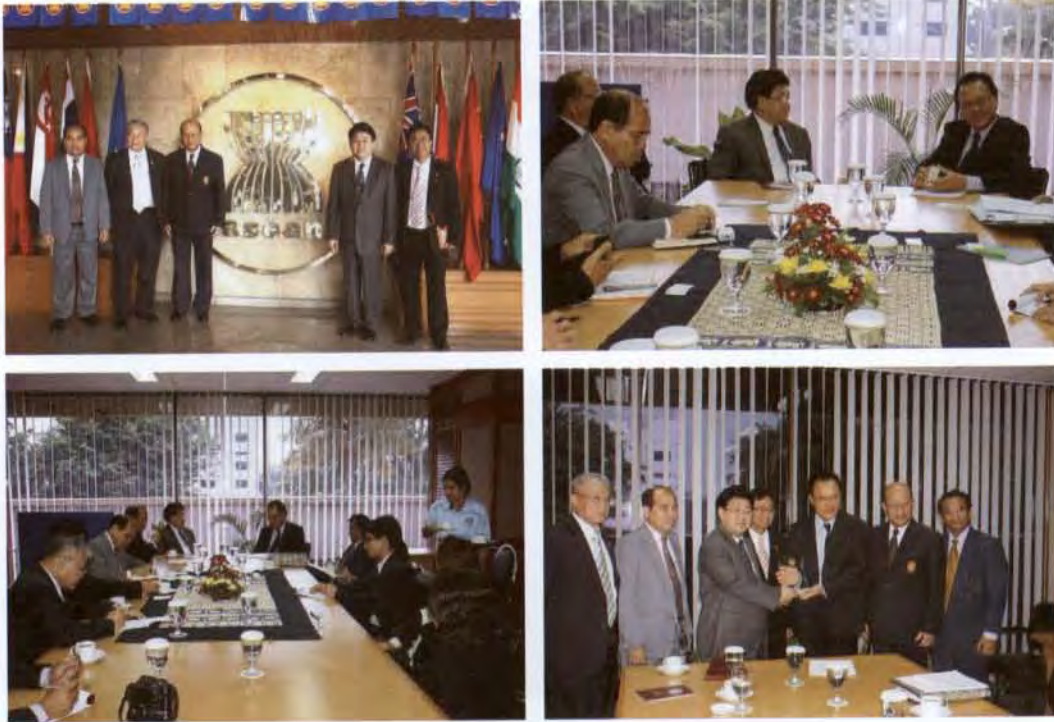
ภาพบรรยากาศการร่วมแลกเปลี่ยนความคิดเห็น ณ สมาคมประชาชาติแห่งเอเชียตะวันออกเฉียงใต้