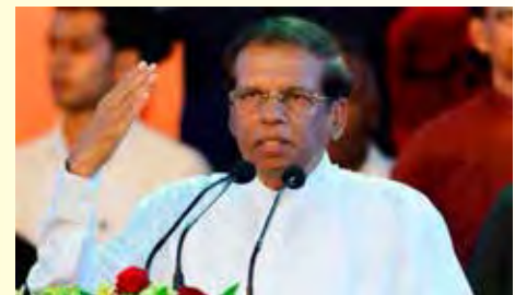
ประธานาธิบดี ไมตรีपालา สิริเสนา

วันที่ ๑๐ พฤศจิกายน ๒๕๖๑ ประธานาธิบดี ไมตรีपालา สิริเสนา ของศรีลังกาประกาศยุบสภา และประกาศจัดการเลือกตั้งก่อนกำหนดในวันที่ ๕ มกราคมปีหน้า พร้อมเปิดประชุมสภา ๑๗ มกราคม นายสาธิต อมุนูกามา รัฐมนตรีต่างประเทศเปิดเผยว่า เหตุผลการยุบสภา เพื่อเปิดทางให้ประชาชนได้ตัดสินใจในการผ่านทางตันทางการเมือง หลังเกิดวิกฤติมาตั้งแต่วันที่ ๒๖ ตุลาคมที่ผ่านมา เมื่อประธานาธิบดีสิริเสนา มีคำสั่งไล่นายกรัฐมนตรีรานิล วิกรมสิงเห ออกจากตำแหน่งแล้วแต่งตั้งอดีตนายกรัฐมนตรีมหินทา ราชปักษา กลับเข้ามาดำรงตำแหน่งอีกครั้ง แต่นายวิกรมสิงเห ยืนยันว่า การปลดเขาออกจากตำแหน่งขัดต่อรัฐธรรมนูญ และปฏิเสธที่จะย้ายออกจากบ้านพักประจำตำแหน่งนายกรัฐมนตรี พร้อมทั้งเรียกร้องให้รัฐสภาเปิดประชุมฉุกเฉินทันที เพื่อพิสูจน์ว่าตนเองได้รับการสนับสนุนจากสมาชิกรัฐสภา