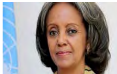
นางซาลเกห์-เวิร์ค

วันที่ ๒๕ ตุลาคม ๒๕๖๑ สถานีโทรทัศน์ของทางการเอธิโอเปียถ่ายทอดสดการลงมติของรัฐสภา เห็นชอบให้นางซาลเกห์-เวิร์ค ดำรงตำแหน่งประธานาธิบดีคนที่ ๗ ของประเทศ ต่อจากประธานาธิบดีมูลาตู เตโชม เเวอร์ตู ที่ยื่นลาออกต่อรัฐสภาเมื่อวันพุธ หนึ่งปีก่อนครบวาระ ๕ ปี โดยให้เหตุผลว่าต้องการเป็นส่วนหนึ่งของการเปลี่ยนแปลงและปฏิรูป ประธานาธิบดีหญิงคนแรกของประเทศกล่าวต่อรัฐสภาว่า เมื่อประเทศได้รับสันติภาพ สตรีผู้เป็นมารดาทุกคนย่อมท้อแท้ผิดหวัง ดังนั้นทุกคนจึงจำเป็นต้องร่วมกันสร้างสันติภาพเพื่อมารดาของทุกคน ตำแหน่งประธานาธิบดีเอธิโอเปียเป็นตำแหน่งทางพิธีการ ขณะที่อำนาจการบริหารที่แท้จริงอยู่ที่นายกรัฐมนตรี หัวหน้าคณะที่ปรึกษานายกรัฐมนตรีอาบี อาเหม็ด ทวีตว่า วุฒิสภาและสภาผู้แทนราษฎรลงมติครั้งประวัติศาสตร์เลือกประธานาธิบดีสตรีคนแรกของเอธิโอเปียยุคใหม่ เพราะในสังคมที่ผู้ชายเป็นใหญ่อย่างเอธิโอเปีย การแต่งตั้งสตรีเป็นประมุขของรัฐไม่เพียงสร้างมาตรฐานให้แก่อนาคต แต่ยังสร้างบรรทัดฐานให้สตรีได้มีสิทธิตัดสินใจเรื่องราวสาธารณะ สักปาด์ที่แล้ว นายกรัฐมนตรีอาเหม็ดเพิ่งปรับคณะรัฐมนตรีและแต่งตั้งให้ผู้หญิงเป็นรัฐมนตรีถึง ๑๐ คน นับเป็นประเทศที่สามในแอฟริกา รองจากรวันดาและเซเชลส์ที่ให้สตรีมีบทบาทในคณะรัฐมนตรีอย่างเสมอภาคนางซาลเกห์-เวิร์ค ถือเป็นประธานาธิบดีคนที่ ๔ ของรัฐบาลผสมอ็อฟอาร์ดีเอฟ ประกอบด้วย ๔ พรรคการเมืองที่ขึ้นปกครองเอธิโอเปียตั้งแต่ปี ๒๕๓๑