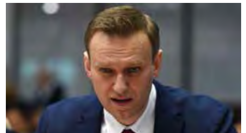
นายอเล็กซี นาวาลนี

วันที่ ๑๔ ตุลาคม ๒๕๖๑ นายอเล็กซี นาวาลนี ผู้นำฝ่ายค้านรัสเซียถูกควบคุมตัวครั้งที่สองมาตั้งแต่วันที่ ๒๔ กันยายน หลังจากเพิ่งรับโทษคุมขังในเรือนจำจากการจัดการชุมนุมโดยมิได้รับอนุญาตเมื่อเดือนมกราคม ผู้นำฝ่ายค้านวัย ๔๒ ปี ซึ่งเป็นคู่อริของประธานาธิบดีวลาดิมีร์ ปูติน ออกจากเรือนจำทางใต้ของกรุงมอสโกเมื่อช่วงเช้าของวันนี้ และให้สัมภาษณ์สื่อมวลชนเล็กน้อยก่อนขึ้นรถออกไป กลุ่มสนับสนุนกังวลว่าการใช้โทษคุมขังฐานฝ่าฝืนกฎหมายกับผู้นำฝ่ายค้านติดกันถึงสองครั้ง จะทำให้เจ้าหน้าที่สามารถดำเนินการกับนายนาวัลนีในคดีอาญาได้ ซึ่งหากเป็นเช่นนั้นเขาจะต้องถูกคุมขังยาวในเรือนจำ นายนาวัลนีกลายเป็นผู้นำฝ่ายต่อต้านคนสำคัญจากการจัดการชุมนุมต่อต้านประธานาธิบดีปูตินครั้งใหญ่เมื่อปี ๒๕๕๔ และปี ๒๕๕๕ โดยกล่าวหาว่าโครงการเลือกตั้งสมาชิกสภา โดยมีกลุ่มผู้ร่วมสนับสนุนซึ่งส่วนใหญ่เป็นคนวัยหนุ่มสาวที่ติดตามเขาทางบล็อกและช่องทางออนไลน์