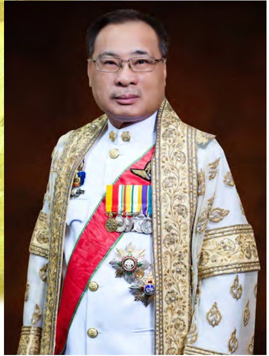
นายสมศักดิ์ เกียรติสุรนนท์ ประธานรัฐสภา

เนื่อง ในโอกาสมหามงคลเฉลิมพระชนมพรรษา ๗ รอบ ๕ ธันวาคม ๒๕๕๔ รัฐสภาในฐานะสถาบันนิติบัญญัติของชาติ ซึ่งทำหน้าที่ในการตรากฎหมายเพื่อนำมาใช้ในการปกครองประเทศและอำนาจหน้าที่ในการควบคุมการบริหารราชการแผ่นดินของคณะรัฐมนตรี ให้เป็นไปตามนโยบายที่ได้แถลงไว้ต่อรัฐสภา และในฐานะองค์กรที่ได้รับฉันทานุมัติให้เป็นผู้แทนของปวงชนชาวไทย ล้วนสำนึกในพระมหากรุณาธิคุณที่ทรงบำเพ็ญพระราชกรณียกิจต่าง ๆ ที่ล้วนก่อให้เกิดคุณประโยชน์ต่อและประชาชนในทุกด้านอย่างเหลือคณานับ รัฐธรรมนูญแห่งราชอาณาจักรไทยได้กำหนดให้ประเทศไทยมีการปกครองระบอบประชาธิปไตยอันมีพระมหากษัตริย์ทรงเป็นประมุขและกำหนดให้อำนาจอธิปไตยเป็นของปวงชนชาวไทยพระมหากษัตริย์ทรงเป็นประมุขทรงใช้อำนาจนั้นทางรัฐสภา คณะรัฐมนตรี และศาลตามบทบัญญัติแห่งรัฐธรรมนูญ พระบาทสมเด็จพระ