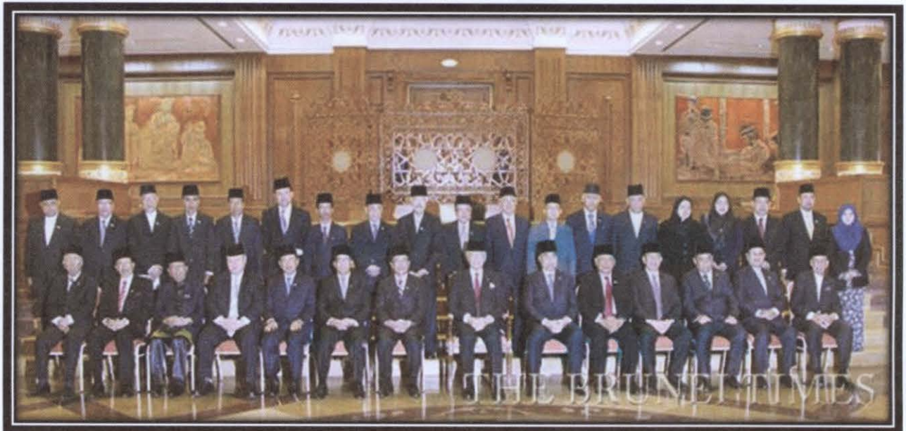
ภาพที่ ๑๒ สมาชิกสภานิติบัญญัติชุดที่ ๘ ในการทำพิธีสาบานตนก่อนเข้ารับตำแหน่ง ๔