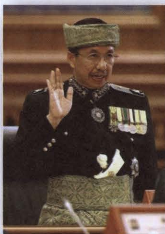
ภาพที่ ๑๓ สมาชิกสภานิติบัญญัติให้คำปฏิญาณก่อนการเข้ารับตำแหน่ง

หากสมาชิกสภานิติบัญญัติคนใดได้ดำรงตำแหน่งสมาชิกฯ อีกหนึ่งสมัยภายในระยะเวลาหนึ่งเดือน นับจากการสิ้นสุดสมาชิกภาพสมัยที่ผ่านมา อาจเข้ารับตำแหน่ง และปฏิบัติหน้าที่โดยไม่ต้องให้คำปฏิญาณ และลงนามอีกครั้งหนึ่ง