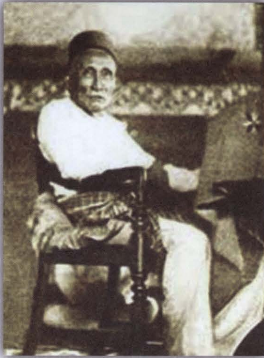
ภาพที่ ๓ สุลต่าน ฮาซิม ญะลีลุล อลัม อะกอหมัดดีน (Sultan Hashim Jalilul Alam Aqamaddin)

ทรงครองราชย์ตั้งแต่ปี พ.ศ. ๒๔๒๘ - พ.ศ. ๒๔๔๙