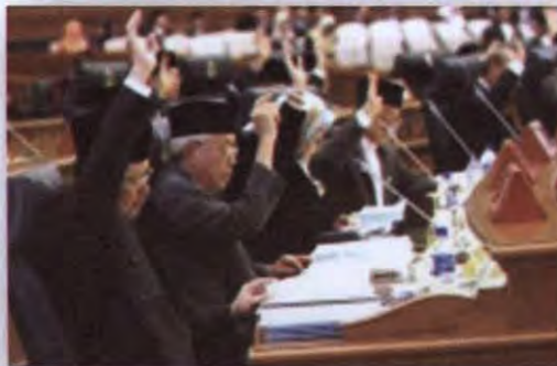
ภาพที่ ๑๗ การลงมติของสมาชิกสภานิติบัญญัติ

เมื่อสมเด็จพระราชาธิบดีได้พิจารณารายงานของประธานสภานิติบัญญัติเกี่ยวกับมติดังกล่าว แม้ว่า จะเป็นมติคัดค้านก็ตาม ย่อมประกาศว่าร่างพระราชบัญญัตินั้นมีผลทางกฎหมายในฐานะที่เป็นพระราชบัญญัติไม่ว่าจะโดยรูปแบบกระบวนการตรากฎหมาย หรือด้วยการแก้ไขเพิ่มเติมตามที่สมเด็จพระราชาธิบดีทรงเห็นว่าเหมาะสม โดยพระราชบัญญัตินั้นมีผลนับแต่วันที่ประกาศไว้ในพระราชกิจจานุเบกษา