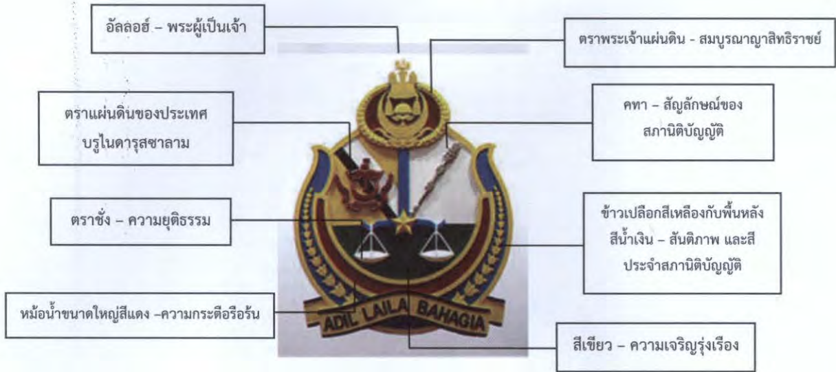
ภาพที่ ๒ ความหมายบนตราสัญลักษณ์สถานิติบัญญัติแห่งชาติ