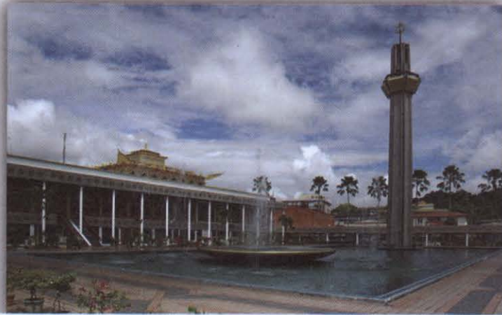
ภาพที่ ๔ Lapau สถานที่ประชุมแห่งแรกของสภารัฐบรูไน สร้างเสร็จสมบูรณ์ในปี พ.ศ. ๒๕๑๑ และใช้เป็นอาคารสำหรับสถานิติบัญญัติจนถึงปี พ.ศ. ๒๕๒๖

ในเดือนมีนาคม พ.ศ. ๒๕๐๒ สุลต่าน ฮัจญี อุมร์ อาลี ไชฟุดดีน ซะอ์ดุล คอยริ วัดดีน (Haji Omar'Ali Saifuddien Sa'adul Khairi Waddien) ได้ยื่นเสนอแก้ไขรัฐธรรมนูญซึ่งผู้สำเร็จราชการแทนพระองค์ได้ตอบรับข้อเสนอ นั้น ดังนั้น ความตกลงบรูไนฉบับปี พ.ศ. ๒๕๐๒ จึงได้มีการลงนาม และนำมาใช้แทนสนธิสัญญาฉบับปี พ.ศ. ๒๔๘๙ สารสำคัญของความตกลงบรูไนฉบับใหม่นี้อยู่ที่อังกฤษได้ยินยอมให้บรูไนมีรัฐบาลปกครองตนเองภายในประเทศ