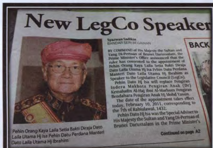
ภาพที่ ๗ ประธานสภานิติบัญญัติคนปัจจุบัน