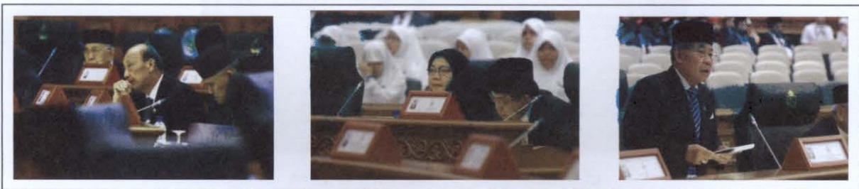
ภาพที่ ๖ บรรยากาศในที่ประชุมสภานิติบัญญัติ

เมื่อวันที่ ๒๕ กันยายน พ.ศ. ๒๕๔๗ สภานิติบัญญัติกลับมาประชุมอีกครั้งเป็นครั้งแรกในรอบ ๒๐ ปี โดยมีสมาชิกที่ได้รับการแต่งตั้งจากสมเด็จพระราชาธิบดี จำนวน ๒๑ คน โดยสภานิติบัญญัติชุดนี้ได้เห็นชอบให้มีการแก้ไขรัฐธรรมนูญในบางมาตรา สภานิติบัญญัติชุดดังกล่าวได้ถูกยุบสภาไปเมื่อวันที่ ๑ กันยายน ของปีถัดมา และสภาชุดใหม่ได้รับการแต่งตั้งเมื่อวันที่ ๒ กันยายน ในปีเดียวกัน มีสมาชิกจำนวน ๒๙ คน โดยสภาชุดใหม่นี้ได้มีการประชุมในเดือนมีนาคมของทุกปี ตั้งแต่ พ.ศ. ๒๕๔๙ จากนั้นเมื่อวันที่ ๑ มิถุนายน พ.ศ. ๒๕๕๔ สมาชิกสภาจำนวน ๒๔ คน ได้รับการแต่งตั้งให้ดำรงตำแหน่งเป็นเวลา ๕ ปี