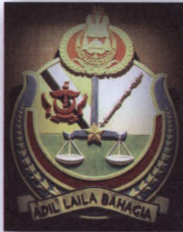
ภาพที่ ๑ ตราสัญลักษณ์สภานิติบัญญัติ

สภานิติบัญญัติ หรือมีชื่อในภาษามลายูว่า MAJLIS MESYUARAT NEGARA ซึ่งรู้จักกันทั่วไปในนาม LegCo (Legislative Council) เป็นเวทีซึ่งสมเด็จพระราชาธิบดีจะได้พระราชทานแนวทางการปฏิบัติงานแก่คณะรัฐมนตรี เพื่อหารือประเด็นต่างๆ รวมทั้งรับฟังปัญหาที่ประเทศกำลังเผชิญจากคณะรัฐมนตรี และผู้แทนอื่นๆ จากภาคสังคม