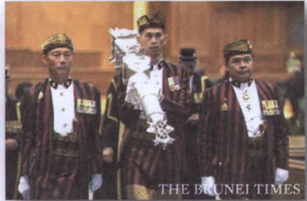
ภาพที่ ๑๕ เจ้าหน้าที่สภานิติบัญญัติเดินเข้าสู่ที่ประชุมสภาพร้อมด้วยคทา ซึ่งเป็นการแสดงว่ากำลังอยู่ในสมัยประชุม ไม่ว่าจะเป็นการประชุมสภา หรือการประชุมคณะกรรมการ