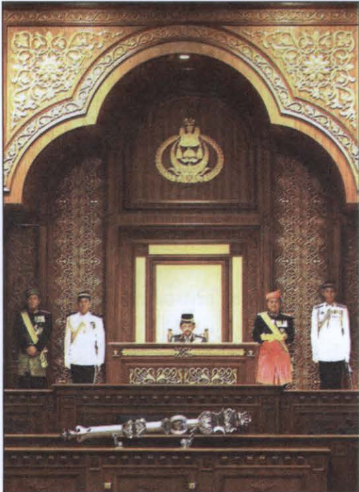
ภาพที่ ๑๔ เปิดสมัยประชุมสภานิติบัญญัติ