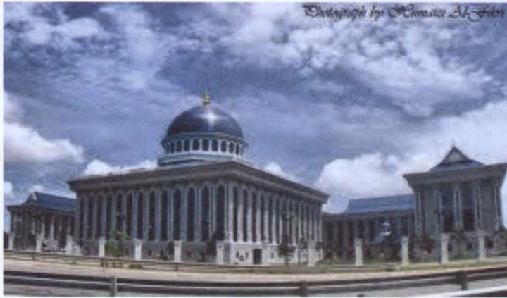
ภาพที่ ๕ อาคารสภานิติบัญญัติ

สภานิติบัญญัติประกอบด้วยสมาชิก ๒๑ คน โดยสมาชิก จำนวน ๑๐ คน ได้รับการแต่งตั้งโดยตรง ๖ คน เป็นสมาชิกโดยตำแหน่ง และอีก ๕ คน เป็นสมาชิกฝ่ายตัวแทนอาณานิคม (unofficial member) ซึ่งแต่งตั้งโดย สุลต่าน สภานิติบัญญัติมีการประชุมต่อเนื่องจนถึงปี พ.ศ. ๒๕๒๖ จากนั้นสภานิติบัญญัติได้ถูกระงับไป ในปีพ.ศ. ๒๕๒๗ บรูไนได้รับเอกราชจากอังกฤษ รัฐบาลบรูไนได้ปรับโครงสร้างเป็นระบบคณะรัฐมนตรีที่เป็นทางการโดยมีองค์สุลต่านเป็นนายกรัฐมนตรี และเป็นผู้นำของสภาทั้งสี่ ได้แก่ คณะรัฐมนตรี สภานิติบัญญัติ สภากองมนตรี และสภาศาสนา โดยสุลต่านเป็นผู้แต่งตั้งสมาชิกของแต่ละสภา