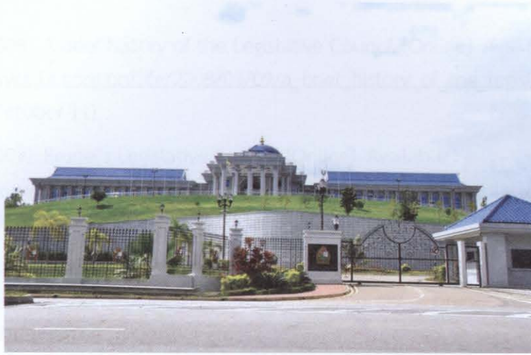
ภาพที่ ๑๘ อาคารสภานิติบัญญัติ

ที่อยู่ Legislative Council of Brunei Darussalam Dewan Majlis Building, Jalan Dewan Majlis, Bandar Seri Begawan BB3931 Brunei Darussalam