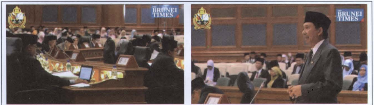
ภาพที่ ๑๖ บรรยากาศในการประชุมสภานิติบัญญัติ

สมเด็จพระราชาธิบดีอาจปิดสมัยประชุม หรือยุบสภานิติบัญญัติเมื่อไรก็ได้ โดยการลงประกาศในราชกิจจานุเบกษา พระองค์จะทรงยุบสภานิติบัญญัติเมื่อหมดวาระ ๕ ปี นับจากวันประชุมสภาครั้งแรก หลังจากที่มีการจัดตั้งองค์ประชุมครั้งแรก หรือการจัดตั้งองค์ประชุมใหม่ เว้นแต่จะมีการยุบสภาเร็วขึ้น