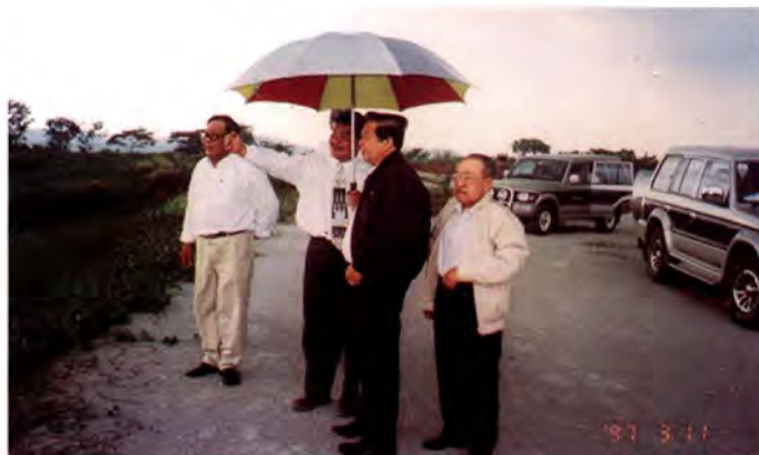
เยี่ยมชมการก่อสร้างเมืองหลวงใหม่ Putrajaya

การก่อสร้าง และการบริการ โดยกลยุทธ์ของรัฐบาลมาเลเซีย ในการพัฒนาเศรษฐกิจนั้นคือ มุ่งรักษาเสถียรภาพของราคาสินค้าและสร้างดุลยภาพระหว่างภายในและภายนอกประเทศ