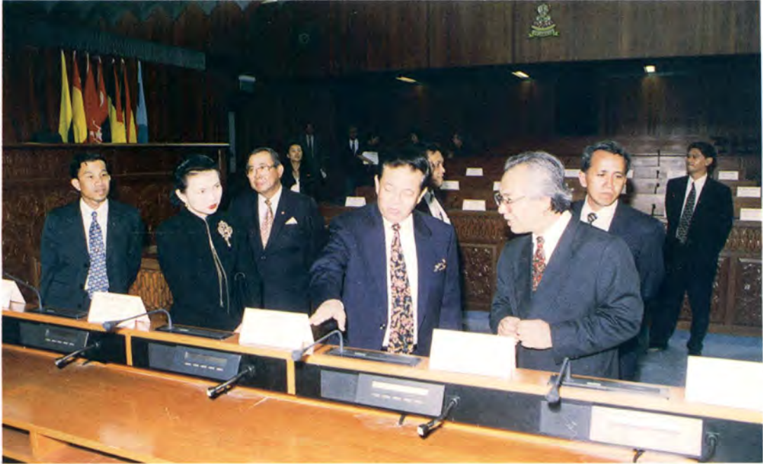
เยี่ยมชมห้องประชุมรัฐสภา