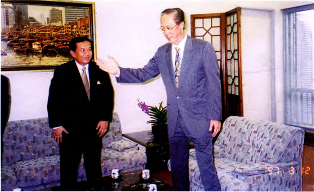
เจ้าเขี่ยมคระนาย Goh Chok Tong