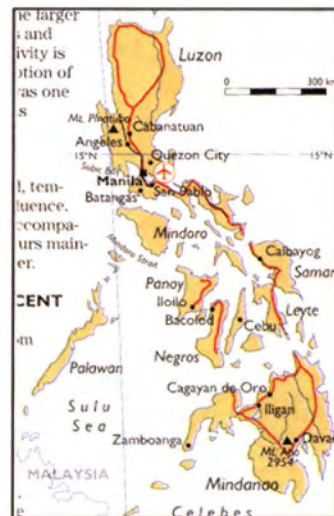
แผนที่สาธารณรัฐฟิลิปปินส์