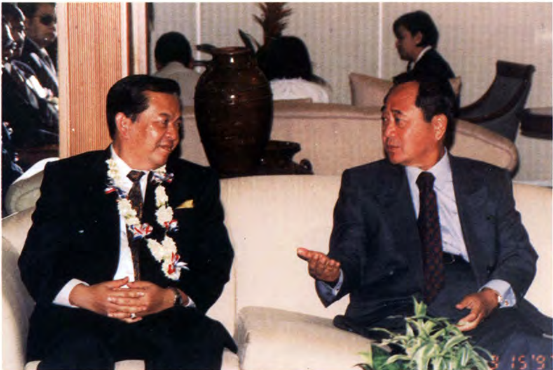
นาย Jose de Venecia Jr. ประธานสภาผู้แทนราษฎร ให้การต้อนรับที่สนามบิน Ninoy Aquino