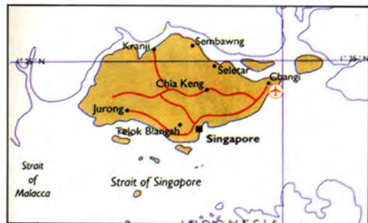
แผนที่สาธารณรัฐสิงคโปร์