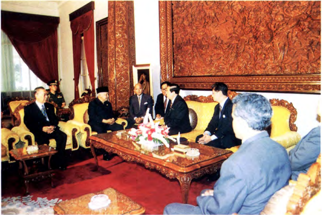
เข้าเยี่ยมชมการระ าชพณฯ นาย Soeharto ประธานาธิบดี