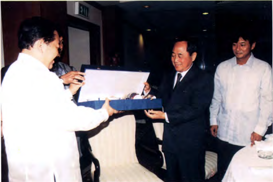
ประธานรัฐสภาไทยมอบของที่ระลึกแก่นาย Jose de Venecia Jr. ประธานสภาผู้แทนราษฎร

3. การผลักดันให้มีการจัดตั้งสภาอาเซียน ต่อจากนั้นประธานรัฐสภาได้มอบหนังสือเชิญแก่ประธานสภาผู้แทนราษฎรสาธารณรัฐฟิลิปปินส์ให้นำคณะเดินทางมาเยือนประเทศไทยอย่างเป็นทางการ