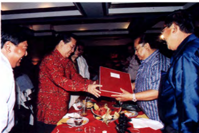
สมาชิกสภาผู้แทนราษฎรสาธารณรัฐฟิลิปปินส์ เลี้ยงอาหารค่ำเพื่อเป็นเกียรติแก่ประธานรัฐสภาและคณะ