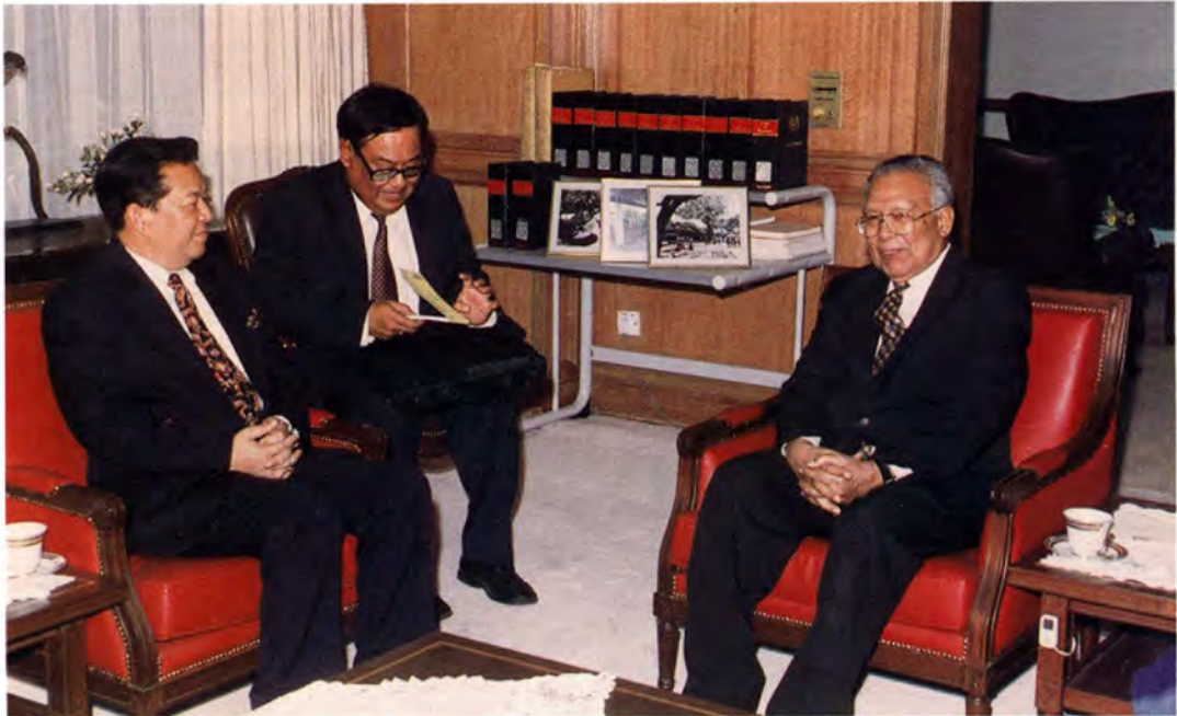
เข้าพบนาย Tan Sri Dato' Mohamed Zahir bin Haji Ismail ประธานสภาผู้แทนราษฎร

และเจ้าหน้าที่ของสถานทูต ซึ่งทางรัฐสภา มาเลเซียได้จัดโรงแรม Hilton ณ กรุงกัวลาลัมเปอร์เป็นที่พักให้แก่คณะผู้เดินทาง