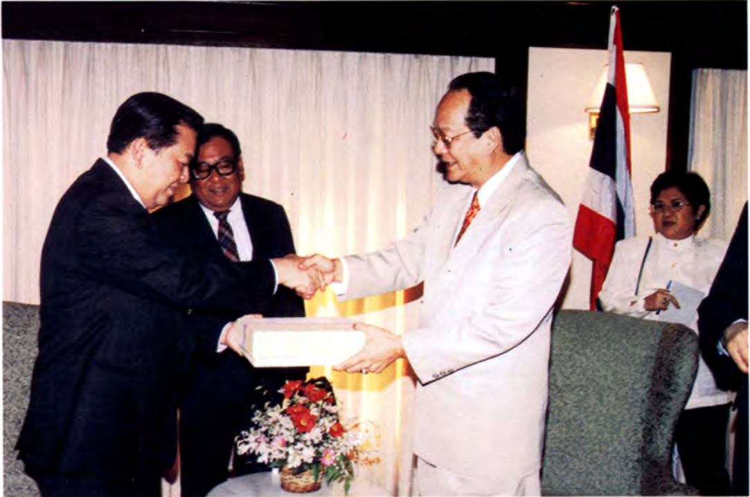
ประธานรัฐสภาฯ รับมอบของที่ระลึกจากประธานวุฒิสภาสาธารณรัฐฟิลิปปินส์