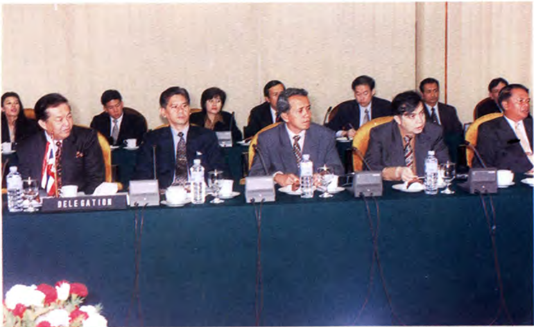
พบปะสนทนากับคณะกรรมการ สภาผู้แทนราษฎร

2. การหามาตรการในการแก้ปัญหา การรुक้าเข้าจับปลาในเขตน่านน้ำของ สาธารณรัฐอินโดนีเซีย