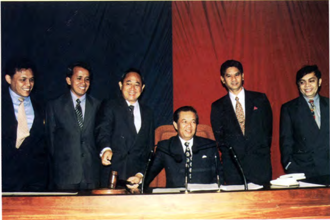
เยี่ยมชมห้องประชุมรัฐสภา