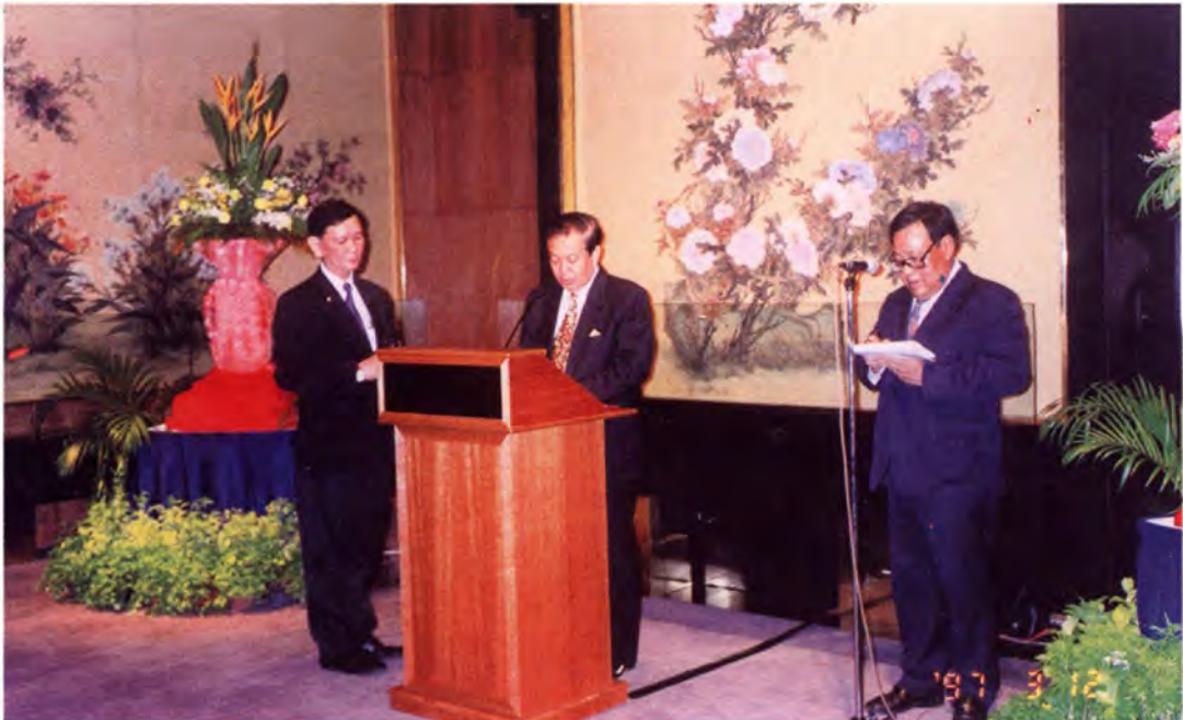
ประธานรัฐสภากล่าวสุนทรพจน์ ในงานเลี้ยงอาหารค่ำ

ระดับรัฐบาล เพื่อเชื่อมความสัมพันธ์อันดีตลอดทั้งเป็นการหาแนวทางในการแก้ปัญหาต่างๆ ที่อาจจะเกิดขึ้น พร้อมกันนี้ประธานรัฐสภาได้มอบหนังสือเชิญแก่ประธานรัฐสภาสาธารณรัฐสิงคโปร์ให้นำคณะฯ เดินทางมาเยือนประเทศไทยอย่างเป็นทางการ