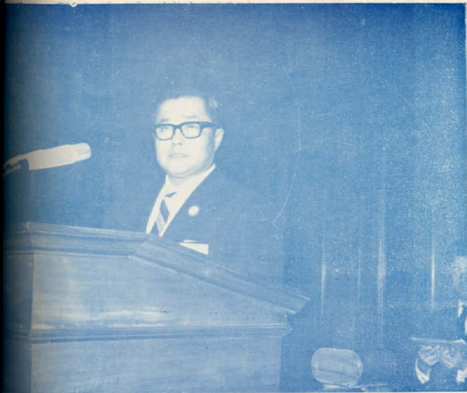
หัวหน้าคณะผู้แทน รัฐสภาไทย กำลังกล่าวอภิปราย ในการ ประชุมสหภาพรัฐสภาครั้งที่ ๕๒ ๑๒ กันยายน ๒๕๐๖