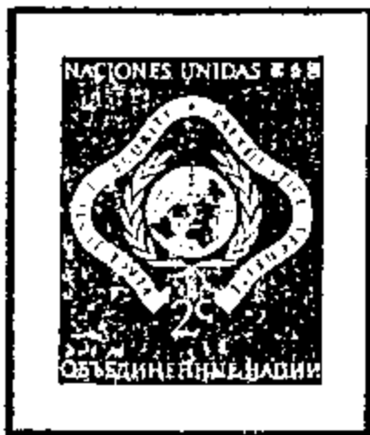
United Nations Emblem