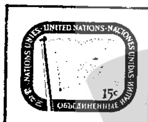
United Nations Flag