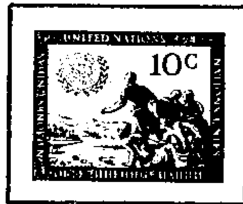
Peoples of the World