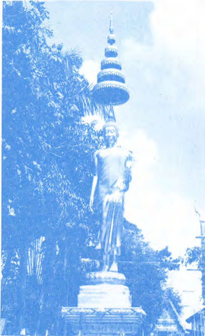
พระปางลีลา ประดิษฐานที่วงเวียนภายในวัด

บรรดาพวกเดียรฉัตรก็ได้หนีไปด้วยอานุภาพขององค์สมเด็จพระสัมมาสัมพุทธเจ้า สรุปว่า พระพุทธไสยาสน์ที่วัดป่าประดู่ที่สร้างตะแคงซ้ายนั้น สันนิษฐานว่า ผู้สร้างเจตนาสร้างในลักษณะปางอิทธิปาฏิหาริย์ ซึ่งนอกจาก สร้างเพื่อเคารพบูชาเป็นพุทธานุสสติแล้ว ยังมุ่งเพื่อความศักดิ์สิทธิ์ทาง อิทธิฤทธิ์อิณินหารต่าง ๆ ด้วย เพราะมีคำเล่าลือกันต่อ ๆ มาว่าเคยมีผู้ขอพร บางอย่างในทางที่ถูกที่ควร มักจะสัมฤทธิ์ผลตามความประสงค์