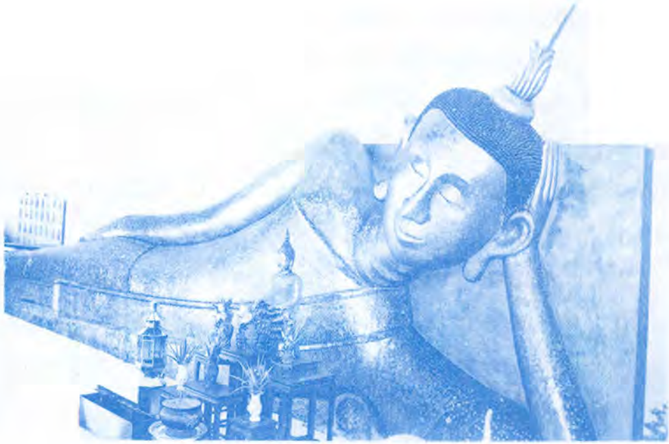
พระพุทธไสยาสน์ตะเคงซ้าย

ไสยาสน์วัดป่าประตูที่นอนตะเคงซ้าย จะนำไปเป็นข้อเปรียบเทียบกับ พระพุทธไสยาสน์ที่นอนตะเคงขวา ตรงตามพุทธลักษณะนั้น ขอนำท่านทั้งหลายสืบเรื่องราวตอนที่พระพุทธเจ้าทรงทำยมกปาฏิหาริย์ ซึ่งในเบื้องต้นพอจะสันนิษฐานได้ว่า ท่านผู้สร้างพระพุทธไสยาสน์ตะเคงซ้ายนั้น คงจะให้ความสนใจและจินตนาการในการสร้าง โดยยึดหลักการทำยมกปาฏิหาริย์ของพระพุทธเจ้าเป็นที่ตั้ง