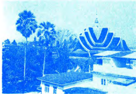
พระอุโบสถหลังใหม่ (กำลังก่อสร้าง)