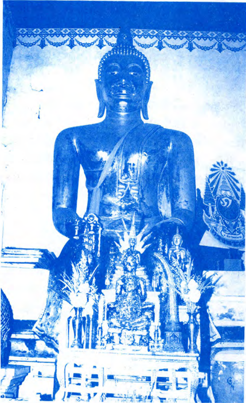
พระพุทธรูปสำริด พระประธานในพระอุโบสถหลังแรก (ปัจจุบันเป็นพระวิหาร)