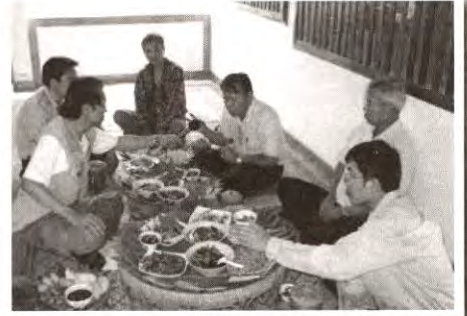
ถ่ายทอดสดจาก อ.ด่านซ้าย จ.เลย กลางวง สำรับข้าว ขันโตก แขนงแท้