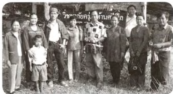
๓: ลุยหนองบัวลำภู ดูกุ่มพืฟผลิตข้าวอวยง ๑. ศรีบุญเรือง ๑๑เฟนรายการมารอพนอย่างคืบคั้