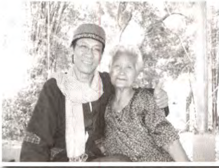
แฟนพันธุ์เก๋รุ่นเก่าจาก จ.ยโสธร