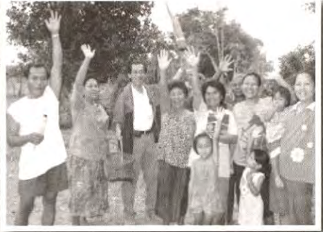
แฟนรายการ อ.สุวรรณภูมิ จ.ร้อยเอ็ด