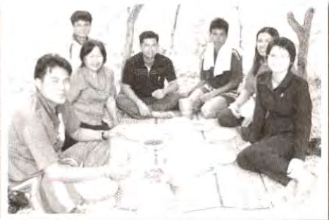
กองเสียบึงต้อนรับตามวิถีชีวิตจริง ของแหล่งข่าว