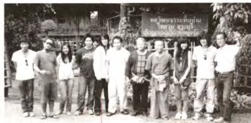
ลุยหมู่บ้านท่องเที่ยว OTOP จ.สระบุรี