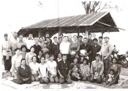
แฟนรายการ อ.คำเขื่อนแก้ว จ.ยโสธร จัดรายการสดกลางทุ่งนา