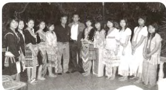
คุณัฒธรรมาต่านัด และสงเสริมการศีกษา เด็กชาวเขา ด้อยโอกาสทางการศีกษาที่ ธารวังทอง รีสอร์ท อ.วังทอง จ.พิษณุโลก