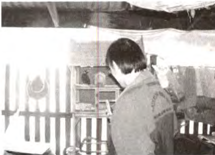
นกขุนทองยังไม่พลาด สัมภาษณ์กันสดๆ