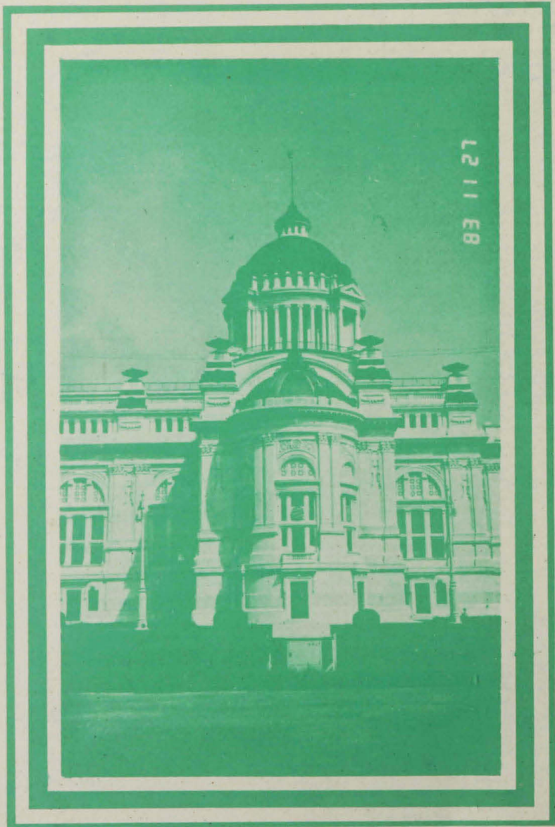
พระที่นั่งอนันตสมาคม