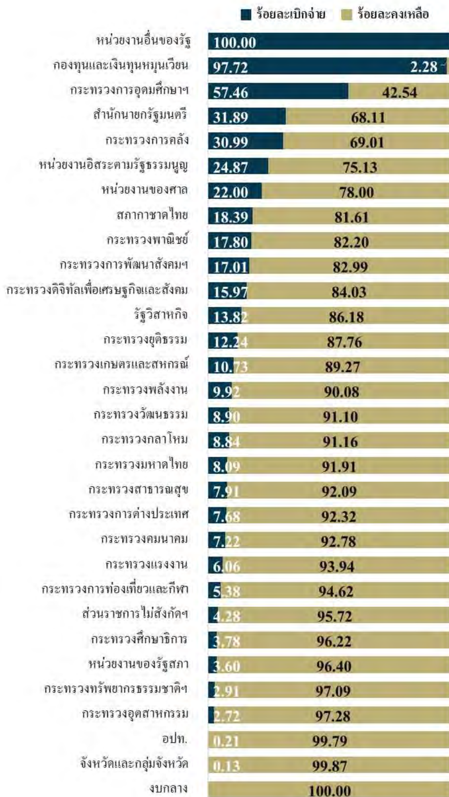
ภาพที่ 6 ผลการเบิกจ่ายงบประมาณรายจ่ายลงทุน

หมายเหตุ: ส่วนราชการในพระองค์ ไม่มีรายจ่ายลงทุน