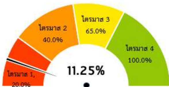
ภาพที่ 3 ผลการเบิกจ่ายงบประมาณรายจ่ายลงทุนเทียบกับมาตรการเร่งรัดการใช้จ่ายงบประมาณ ปี 2564

3) รายจ่ายลงทุน งบประมาณหลังโอนเปลี่ยนแปลงรายการ จำนวน 648,983.6046 ล้านบาท เบิกจ่ายแล้ว 73,017.6749 ล้านบาท คิดเป็นร้อยละ 11.25 ซึ่ง ต่ำกว่า เป้าหมายรายจ่ายลงทุน ร้อยละ 8.75 (เป้าหมายกำหนดไว้ ร้อยละ 20) รายละเอียดปรากฏตามภาพที่ 3