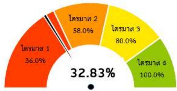
ภาพที่ 2 ผลการเบิกจ่ายงบประมาณรายจ่ายประจำเทียบกับมาตรการเร่งรัดการใช้จ่ายงบประมาณ ปี 2564

2) รายจ่ายประจำ งบประมาณหลังโอนเปลี่ยนแปลงรายการ จำนวน 2,636,978.8750 ล้านบาท เบิกจ่ายแล้ว 865,524.9096 ล้านบาท คิดเป็นร้อยละ 32.83 ซึ่ง ต่ำกว่า เป้าหมายรายจ่ายประจำร้อยละ 3.17 (เป้าหมายกำหนดไว้ ร้อยละ 36) รายละเอียดปรากฏตามภาพที่ 2