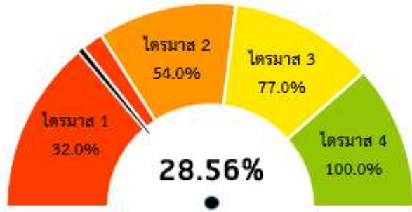
ภาพที่ 1 ผลการเบิกจ่ายงบประมาณรายจ่ายภาพรวมเทียบกับมาตรการเร่งรัดการใช้จ่ายงบประมาณ ปี 2564

1) เมื่อพิจารณาเป้าหมายการเบิกจ่ายงบประมาณรายจ่ายภาพรวม ประจำปีงบประมาณ พ.ศ. 2564 พบว่า ผลการเบิกจ่ายงบประมาณรายจ่ายภาพรวม ณ สิ้นไตรมาสที่ 1 (วันที่ 31 ธันวาคม 2563) ต่ำกว่า เป้าหมายร้อยละ 3.44 (เป้าหมายกำหนดไว้ ร้อยละ 32) รายละเอียดปรากฏตามภาพที่ 1