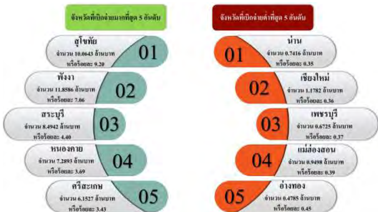
ภาพที่ 7 จังหวัดที่มีผลการเบิกจ่ายสูงสุดและต่ำสุด 5 อันดับแรก