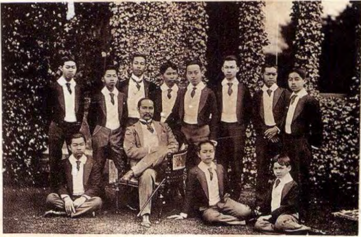
ที่ศาลาเปิดดอก ประทับพร้อมด้วยสมเด็จพระบรมโอรสาธิราช สมเด็จพระเจ้าลูกยาเธอ พระเจ้าลูกยาเธอ