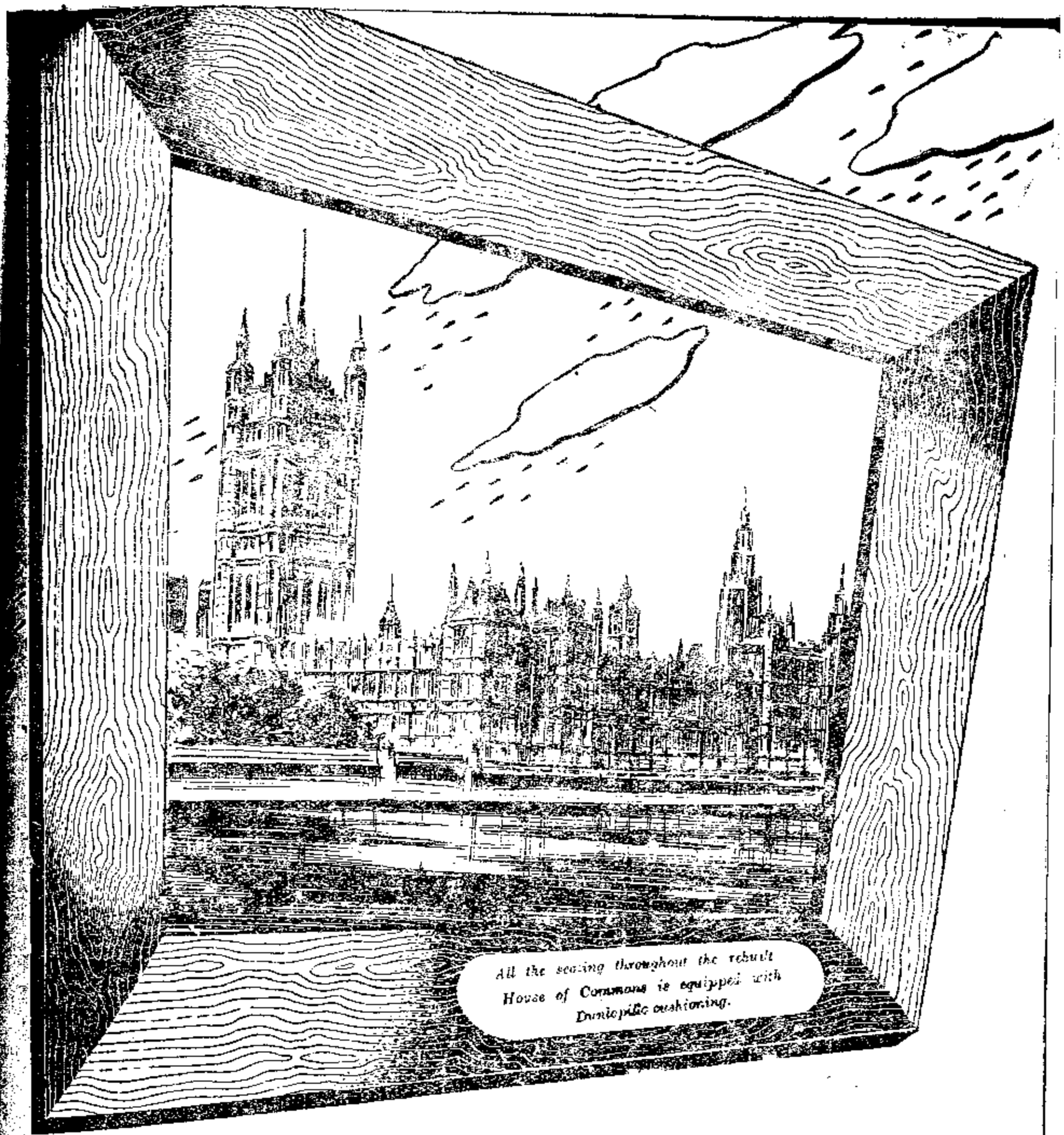
All the seating throughout the rebuilt House of Commons is equipped with Dunlopillo cushioning.