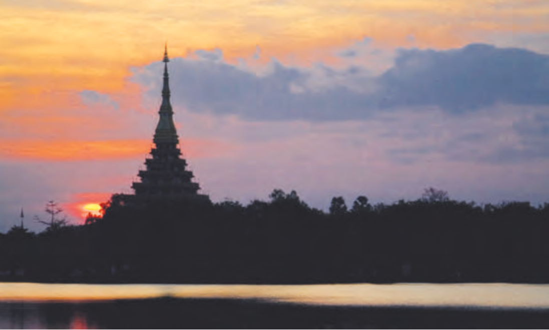
ทิวทัศน์บึงแก่นนครและพระมหาธาตุแก่นนคร

ขอนแก่น-มหาวิทยาลัยขอนแก่น-ห้างเซ็นทรัล-สถานีขนส่งผู้โดยสาร แห่งที่ ๑ บึงแก่นนคร-สถานีขนส่งผู้โดยสาร แห่งที่ ๓ เป็นสายที่วิ่งรอบเมืองและให้บริการตลอด ๒๔ ชั่วโมง