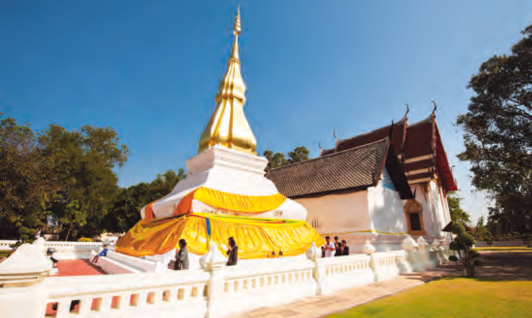
พระธาตุขามแก่น

ข้ามรางรถไฟและตรงไปอีกประมาณ ๕ กิโลเมตร ถึงสวนสัตว์ขอนแก่น ระยะทางจากอำเภอเมืองขอนแก่น ประมาณ ๕๖ กิโลเมตร