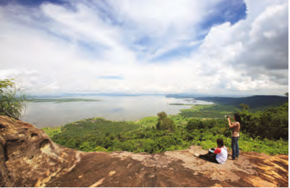
เขื่อนอุบลรัตน์

มีร้านอาหาร บ้านพัก และกิจกรรมต่างๆ เช่น การนั่งเรือชมทัศนียภาพเหนือเขื่อนและชมสวนไม้ในวรรณคดี สอบถามข้อมูลได้ที่ การไฟฟ้าฝ่ายผลิตแห่งประเทศไทย ที่ทำการเขื่อนอุบลรัตน์ โทร.