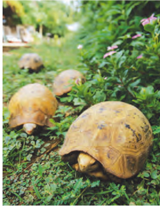
หมู่บ้านเต่า

อุทยานแห่งชาติน้ำพอง ที่ทำการอุทยานฯ ตั้งอยู่บริเวณเขื่อนอุบลรัตน์ ตำบลบ้านฝ้อ อำเภอหนองเรือ มีเนื้อที่ ๑๒๓,๑๒๕ ไร่ ครอบคลุมพื้นที่หลายอำเภอในจังหวัดขอนแก่น ได้แก่ อุบลรัตน์ ภูเวียง บ้านฝาง มัญจาคีรี และโคกโพธิ์ชัย รวมถึงสองอำเภอในจังหวัดชัยภูมิ ได้แก่ บ้านแท่น และแก่งคร้อ เป็นทั้งแหล่งต้นน้ำของลำน้ำชี ลำน้ำพอง มีพื้นที่ส่วนใหญ่เป็นภูเขา ป่าเต็งรัง และป่าดิบแล้ง