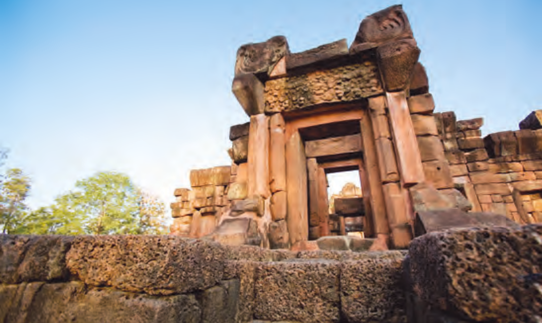
ปราสาทกูเปียน้อย

บริหารส่วนตำบลหัวหนอง ใช้เส้นทางนี้ผ่านหมู่บ้านต่าง ๆ จนถึงบ้านหัวหนอง ระยะทางจากอำเภอเมืองขอนแก่น ๕๐ กิโลเมตร