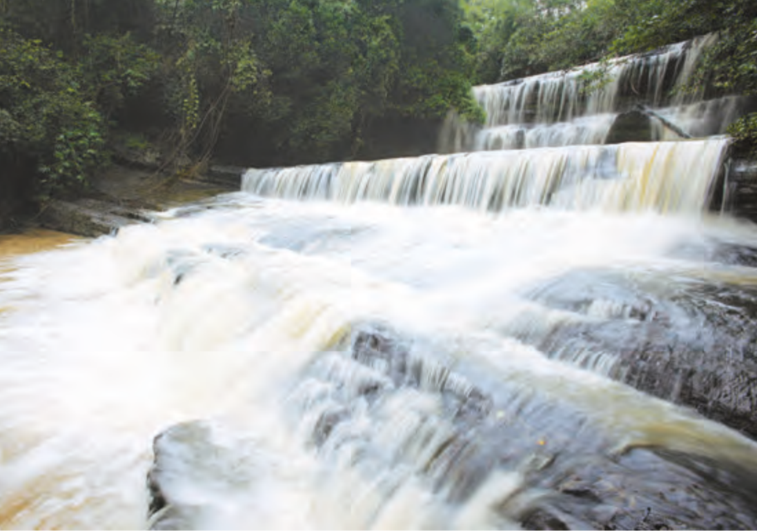
น้ำตกตาดฟ้า

มองเห็นแต่ไกล เมื่อเข้าไปใกล้จะได้กลิ่นฉุนของมูลค้างคาว ภายในถ้ำมีค้างคาวขนาดเล็กอาศัยอยู่บนถ้ำกันตัว ทุกวันจะบินออกจากถ้ำในเวลาเย็น โดยจะบินเป็นกลุ่มยาวนานนับสิบกิโลเมตร ใช้เวลาประมาณ ๓๐-๔๕ นาที