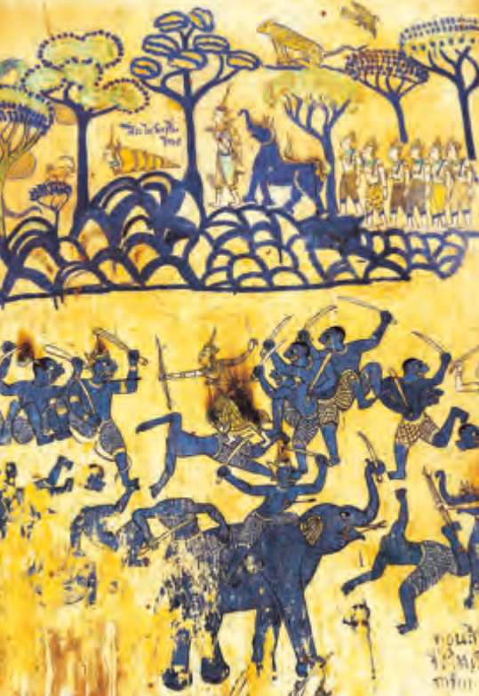
อุปแต้มลินไซ วัดไชยศรี

ยังถือว่าอุปแต้มที่วัดไชยศรียังมีความชัดเจนและสวยงามอยู่มาก