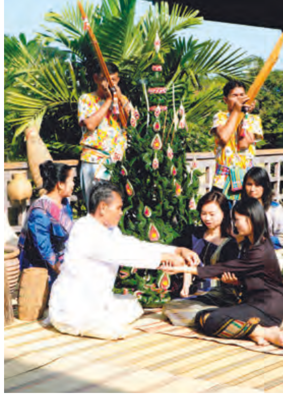
ประเพณีผูกเสี่ยว

ผ้าฝ้ายมัดหมี่ บ้านเมืองเพี้ย อำเภอบ้านไผ่ ชาวบ้านแทบทุกครัวเรือน จะทอผ้าฝ้ายมัดหมี่และชิ้นไหมมัดหมี่ แต่ที่มีชื่อเสียงเป็นที่รู้จักกันมาก คือ การทอผ้าฝ้ายมัดหมี่ ซึ่งมีกรรมวิธีการผลิตและการทอเช่นเดียวกับผ้าไหมมัดหมี่ ลวดลายผ้าดัดแปลงมาจากสภาพแวดล้อมที่พบเห็น ผ้าฝ้ายที่นี่มีคุณภาพดี สวยงาม และราคาย่อมเยา ผู้ที่ต้องการจะซื้อผ้าพร้อมทั้งชมกรรมวิธีการผลิตยังสามารถมาที่บ้านเมืองเพี้ยได้ ชาวบ้านจะทอและขายเองตามบ้านเรือน