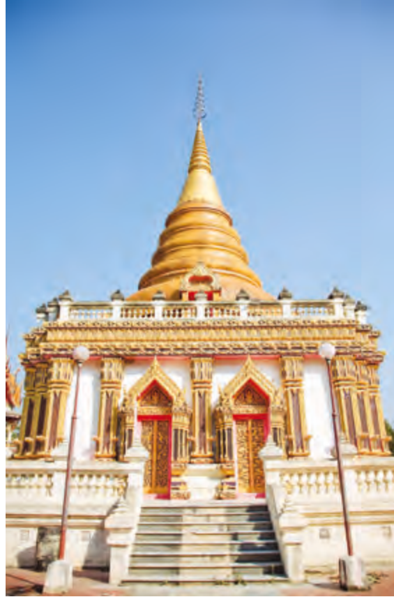
วัดอุดมคงคาศรีเขต

การเดินทาง จากอำเภอเมืองขอนแก่น ใช้ทางหลวงหมายเลข ๒ เส้นทางไปนครราชสีมา เลี้ยวลาดต้นตาลมา จะพบสี่แยกไฟแดงแรก ให้เลี้ยวขวาเข้าทางหลวงหมายเลข ๒๑๓๑ จากนั้นเลี้ยวซ้าย