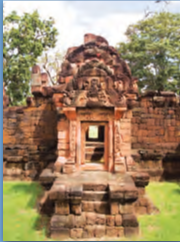
ปราสาทเป็ยน้อย