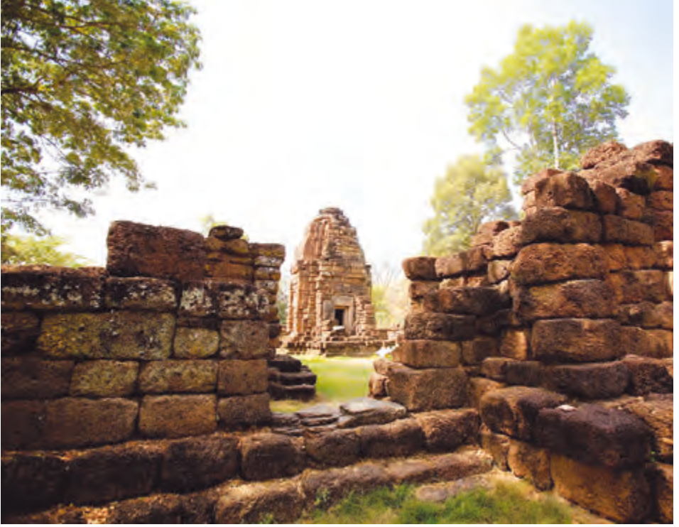
คูประภาชัย หรือ กู่บ้านนาคำน้อย