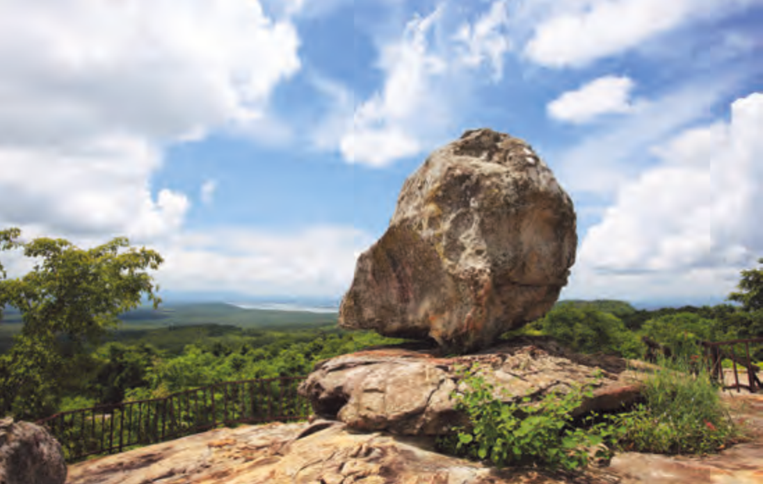
อุทยานแห่งชาติน้ำพอง

ออกดอกบานชูช่อสวยงามและส่งกลิ่นหอมอ่อนๆ ไปทั่วบริเวณ