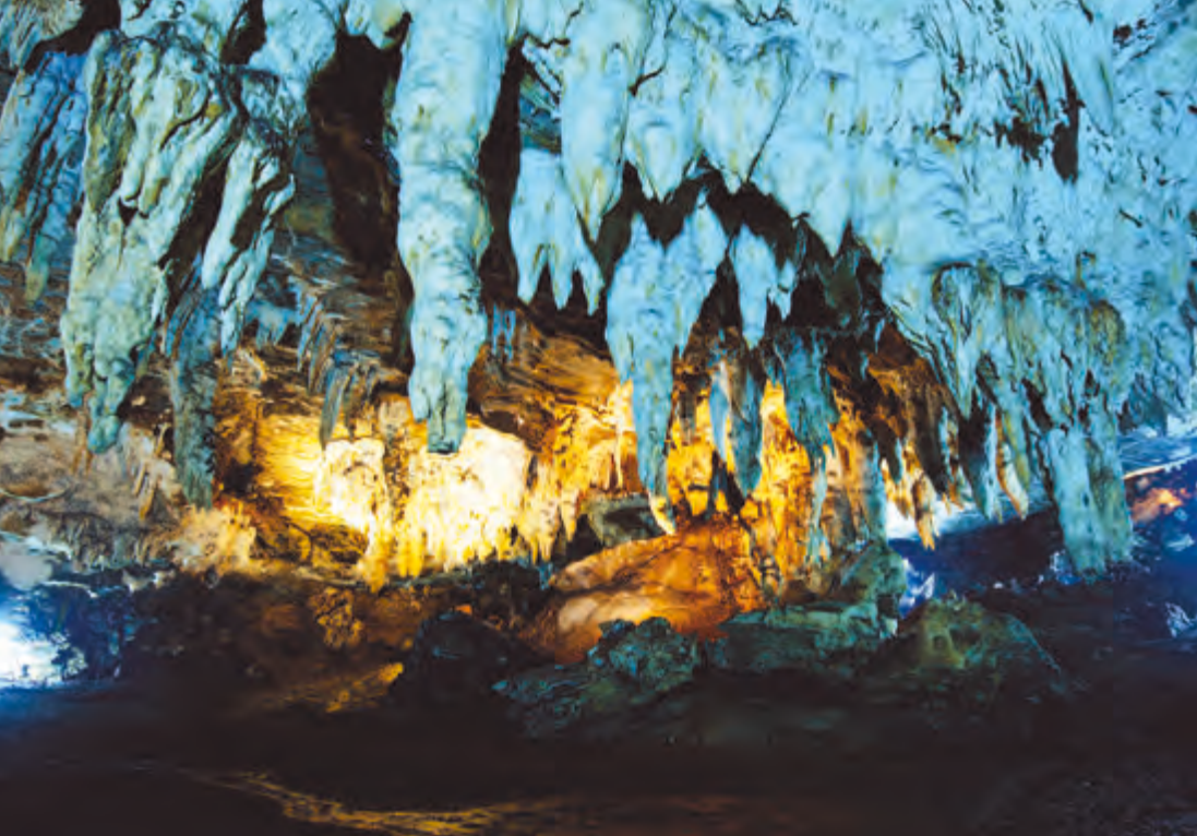
หินงอกหินย้อย ถ้ำปู่หลุบ

เมื่อฤาษีเสียชีวิตชาวบ้านจึงได้ตั้งศาลเจ้าขึ้นมาบริเวณปากถ้ำ และตั้งชื่อถ้ำแห่งนี้ว่า “ถ้ำปู่หลุบ” ตามชื่อของฤาษี จากศาลเจ้าเดินไปไม่กี่ไกลจะพบกับปากทางเข้าถ้ำปู่หลุบ ลักษณะปากถ้ำอยู่ไม่สูงจากพื้นดินมากนัก ภายในเป็นหินปูนมีหินงอกหินย้อย มีเกล็ดแวววาวระยิบระยับสวยงาม แยกเป็นห้อง ๆ ได้ ๕ ห้อง นอกจากนี้บางห้องยังมีบ่อน้ำพุตกจนเป็นบ่อน้ำขังขนาดใหญ่อยู่ภายในถ้ำด้วย การเดินทาง จากอำเภอเมืองขอนแก่น ใช้ทางหลวงหมายเลข ๑๒ ผ่านอำเภอชุมแพ และแยกขวาเข้าสู่ทางหลวงหมายเลข ๒๐๑ เส้นทางไปจังหวัดเลย ช่วงระหว่างกิโลเมตรที่ ๑๑๕-๑๑๖ อยู่ก่อนถึงบ้านผานกเค้า ๖ กิโลเมตร