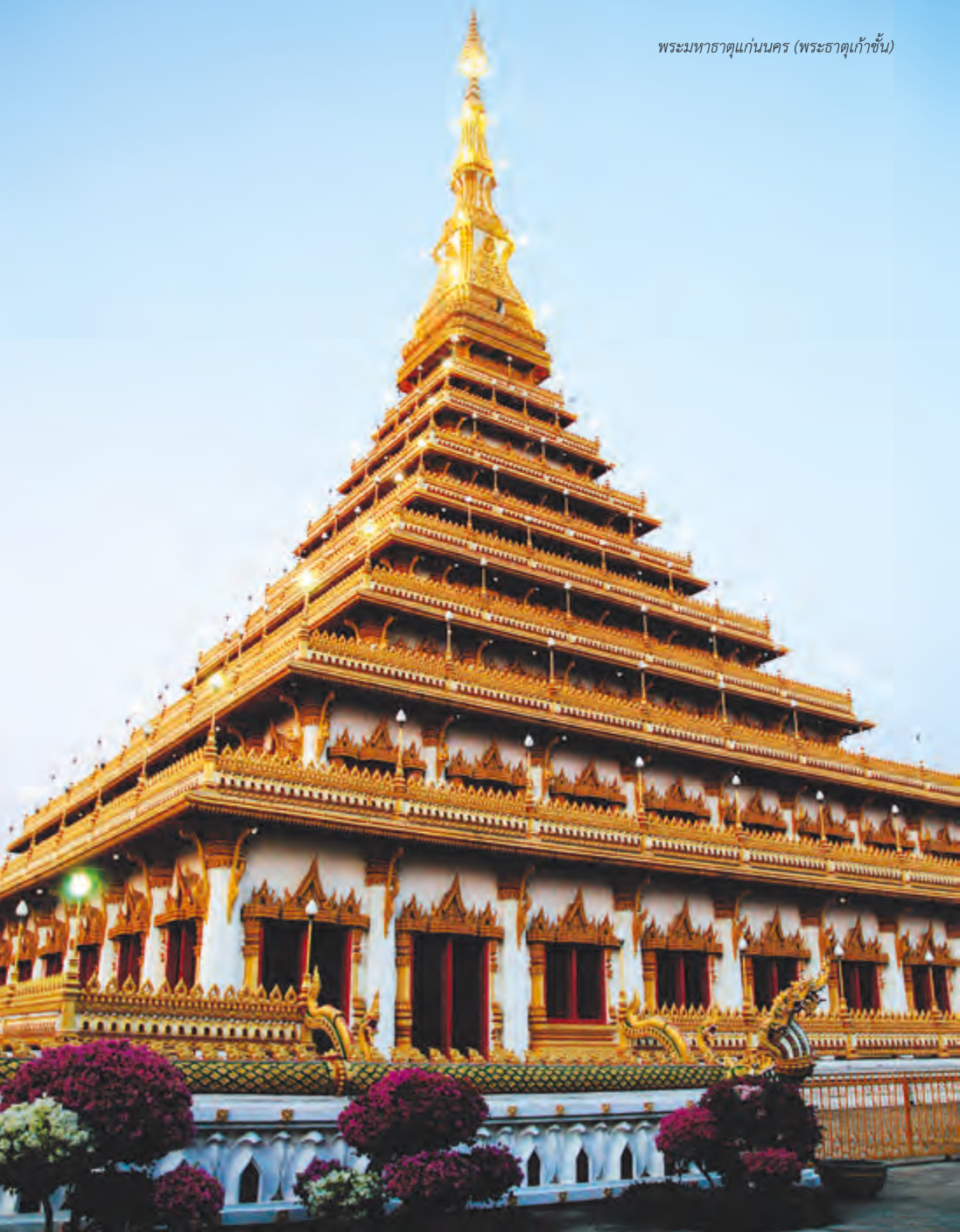
พระมหาธาตุแก่นนคร (พระธาตุเก้าชั้น)