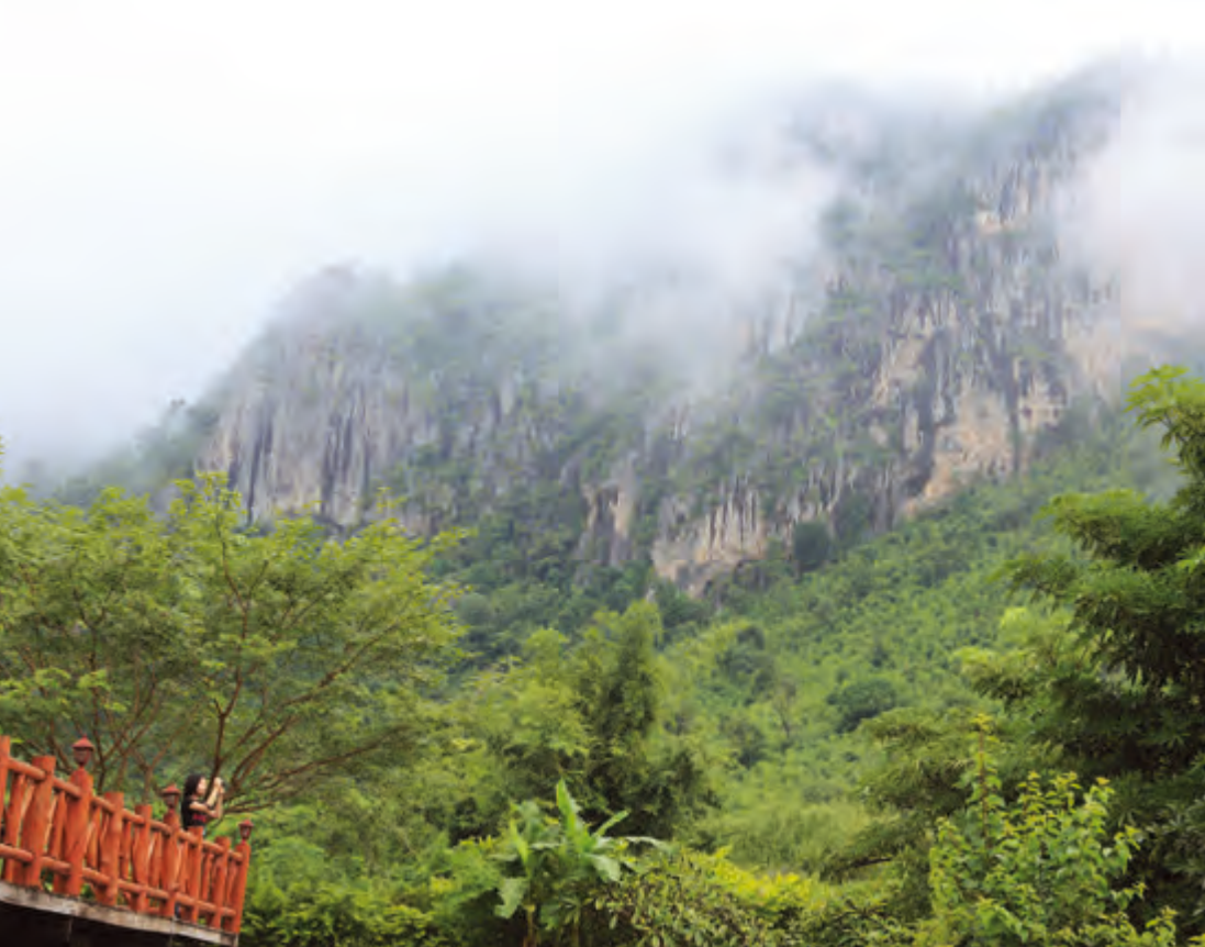
อุทยานแห่งชาติภูผาม่าน