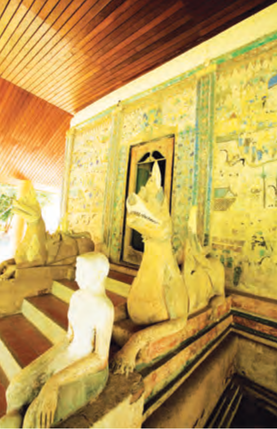
สิม วัดสระบัวแก้ว