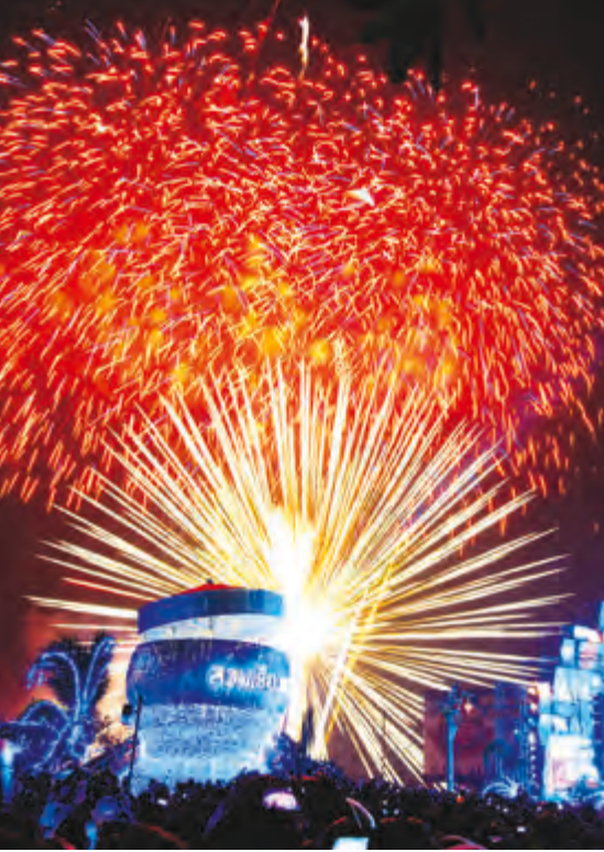
งานขอนแก่นเคาท์ดาวน์

รองที่นอกเหนือจากการทำนา คือ การปลูกหม่อน เลี้ยงไหม การทอผ้าต่าง ๆ ซึ่งทางราชการได้ให้การ สนับสนุนจนจังหวัดขอนแก่นเป็นแหล่งผลิตผ้าไหมที่มีชื่อเสียง ประกอบกับมีประเพณีการผูกเสี่ยวซึ่งเป็น ขนบธรรมเนียมดั้งเดิมของภาคอีสาน ที่มุ่งให้คนรุ่น เดียวกันรักใคร่เป็นพี่เป็นน้องช่วยเหลือกัน เรียกว่า “คู่เสี่ยว” การจัดงานนี้จึงมุ่งหวังส่งเสริมอาชีพการ ทอผ้าไหมและรักษาขนบธรรมเนียมประเพณีดั้งเดิม ไว้ ในงานจะมีขบวนแห่คู่เสี่ยวและพานบายศรีของ อำเภอด่างต่างๆ มีพิธีผูกเสี่ยว การประกวดผลิตภัณฑ์พื้น บ้าน งานพาข้าวแฉง (การรับประทานอาหารค่ำแบบ พื้นเมืองอีสาน) การแสดงศิลปวัฒนธรรมพื้นบ้าน การออกร้านกาชาด ร้านจำหน่ายผ้าไหมและผลิตภัณฑ์ ของที่ระลึกต่างๆ การประกวดนางงามไหมขอนแก่น ฯลฯ สอบถามข้อมูลได้ที่ สำนักงานจังหวัดขอนแก่น โทร. ๐ ๔๓๒๓ ๖๘๘๒