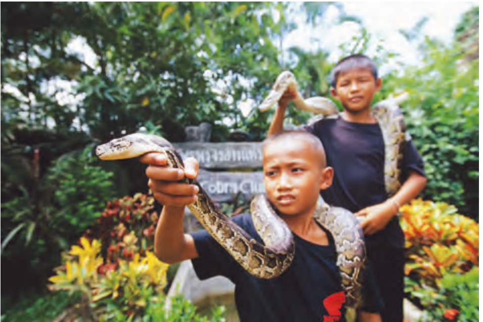
หมู่บ้านงูจงอาง