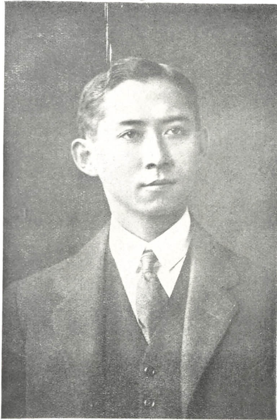
สมเด็จพระราชบิดา เจ้าฟ้ามหิดลอดุลยเดช กรมหลวงสงขลานครินทร์