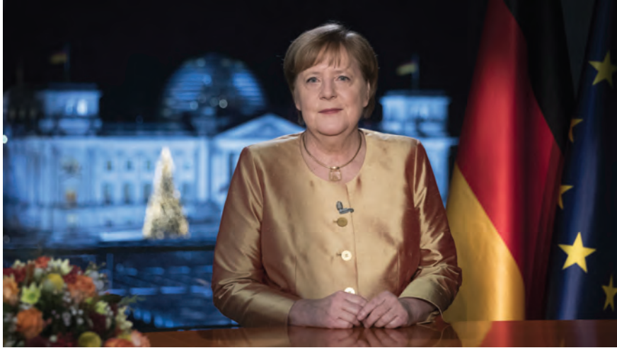
อังเกลา แมร์เคิล นายกรัฐมนตรีเยอรมนี