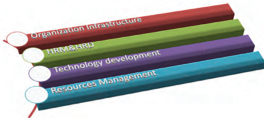
ภาพที่ ๖ กิจกรรมสนับสนุนการบริหาร

ในส่วนแรกได้กล่าวถึงพื้นฐานการบริหารไปแล้ว ซึ่งถ้าเปรียบเสมือนบ้าน คือ ส่วนฐานรากของบ้านที่จะต้องสร้างให้มั่นคงแข็งแรง ถือว่าเป็นโครงสร้างพื้นฐานเพื่อรองรับส่วนต่างๆ ต่อไป สำหรับในส่วนนี้จะกล่าวในส่วนที่เสริมต่อขึ้นมาจากฐานราก คือ กิจกรรมสนับสนุนการบริหาร (management support activities) ซึ่งเปรียบเสมือนตัวบ้านที่ประกอบไปด้วยผนัง ฝ้า ห้องต่างๆ รวมถึงระบบสาธารณูปโภคของบ้านให้คนในบ้านสามารถดำเนินกิจกรรมและพักอาศัยได้อย่างสุขสบาย กิจกรรมสนับสนุนการบริหารจึงทำหน้าที่เป็นระบบปฏิบัติการ (operation system) ในการช่วยขับเคลื่อนองค์กรให้สามารถปฏิบัติการกิจให้บรรลุผลสำเร็จ ถ้าขาดกิจกรรมสนับสนุนฯ เหล่านี้้องค์การก็ไม่สามารถขับเคลื่อนหรือดำเนินกิจกรรมต่างๆ ได้ เพื่อให้เข้าใจได้ง่ายและสอดคล้องกับแนวคิดในการบริหารองค์การสมัยใหม่ที่เน้นให้ความสำคัญกับการสร้างความได้เปรียบเชิงการแข่งขัน (competitive advantage) ในที่นี้ขอหยิบยกแนวคิดของไมเคิล พอร์เตอร์ (Michael E. Porter, 1985) ที่กล่าวถึงแนวคิดห่วงโซ่แห่งคุณค่า (the value chain) โดยขอนำส่วนของกิจกรรมสนับสนุน (support activities) มาประยุกต์ให้ตรงกับบริบทที่เปลี่ยนแปลงไปในปัจจุบัน รวมถึงปรากฏการณ์ที่เกิดขึ้นจริงในองค์กร โดยให้ความสำคัญกับกิจกรรมหลักๆ ดังต่อไปนี้ (แสดงตามภาพที่ ๖)