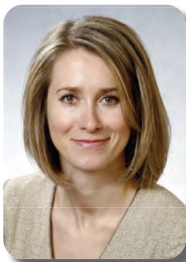
คากา แคลลัส