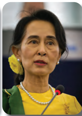
ออง ซาน ซูจี