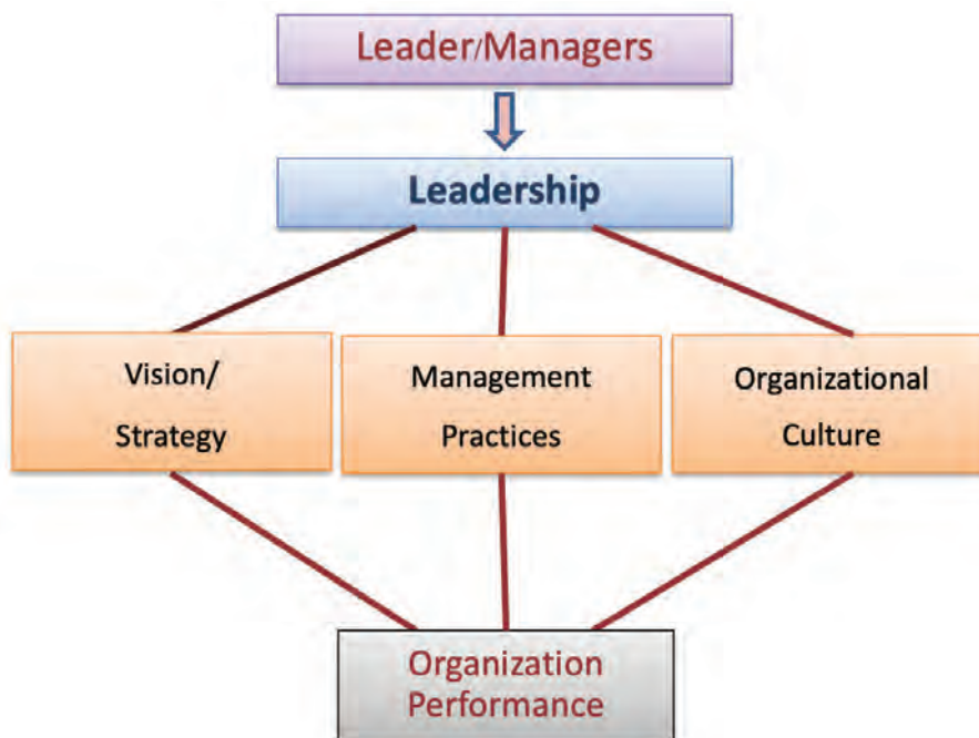
ภาพที่ ๗ ภาวะผู้นำในการขับเคลื่อนองค์การ

ส่วนที่ผ่านมาได้กล่าวถึงพื้นฐานการบริหารเป็นลำดับแรก ส่วนต่อมากล่าวถึงกิจกรรมสนับสนุนการบริหารและส่วนนี้จะเสนอเป็นส่วนสุดท้ายของแนวคิดองค์การเปรียบเสมือนบ้าน คือ ภาวะผู้นำองค์การ ถ้าเปรียบเสมือนบ้านคือ หลังคา เป็นโครงสร้างส่วนบนสุดของบ้าน ที่ทำหน้าที่ กันแดด กันลม กันฝน และทำให้บ้านครบองค์ประกอบของโครงสร้างที่สมบูรณ์ในที่นี้จะไม่นำเสนอว่า “ภาวะผู้นำ” (leadership) คืออะไร (ปัจจุบันมีหนังสือ ตำรา ข้อเขียนมากมาย สนใจสามารถศึกษาเพิ่มเติมได้) แต่จะขอกล่าวการนำภาวะผู้นำไปประยุกต์ในการบริหารองค์การเพื่อขับเคลื่อนองค์การ โดยเฉพาะสองส่วนสำคัญที่นำเสนอในบทความนี้เป็นสำคัญ โดยจะแบ่งเนื้อหาในส่วนนี้ออกเป็น ๒ ส่วนย่อย คือ ๑) ภาวะผู้นำในการขับเคลื่อนองค์การ และ ๒) คุณลักษณะสำคัญของภาวะผู้นำที่เอื้อต่อการบริหารองค์การ โดยมีรายละเอียดดังต่อไปนี้