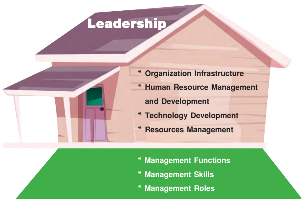
ภาพที่ ๑ แนวคิดองค์กรเปรียบเสมือนบ้าน

ส่วนที่สาม คือ ภาวะผู้นำ (leadership) เปรียบเสมือนส่วนบนของบ้านหรือหลังคาที่พร้อมกันแดด ลม พายุ ฝน ทำให้บ้านมีความสมบูรณ์ อีกทั้งส่วนหลังคายังเป็นส่วนที่แสดงให้เห็นความสวยงามของบ้าน ทำให้เห็นบ้านแต่ไกล และหากอยู่บนที่สูง อาทิ มองจากภาพถ่ายดาวเทียมลงมาจะเห็นหลังคาบ้านตั้งตระหง่านเป็นจุดสังเกต (landmark) ก่อนเป็นลำดับแรก เฉกเช่นภาวะผู้นำของผู้บริหารองค์กรที่จะต้องเป็นผู้นำองค์กรอย่างมีวิสัยทัศน์ บริหารงานให้บรรลุเป้าหมายขององค์กร สามารถแก้ไขปัญหาทั้งในยามปกติและวิกฤตได้ รวมถึงสามารถพัฒนาองค์กร พัฒนาศักยภาพของทรัพยากรมนุษย์ เพื่อยกระดับองค์กรสู่ความเป็นเลิศ ล้วนแต่ต้องอาศัยภาวะผู้นำของผู้บริหารองค์กรทั้งสิ้น นอกจากนี้ ภาวะผู้นำมีความสำคัญอย่างยิ่งในการบูรณาการองค์ประกอบทั้งสองส่วนข้างต้น คือ พื้นฐานการบริหารและกิจกรรมสนับสนุนการบริหารให้สามารถขับเคลื่อนองค์กรไปตามทิศทางที่ต้องการได้อย่างราบรื่นและเกิดประสิทธิผลต่อองค์กร