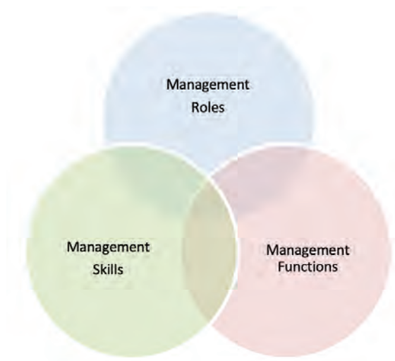
ภาพที่ ๒ พื้นฐานการบริหาร