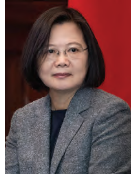
ไช่ อิงเหวิน

ประธานาธิบดีหญิงคนแรกของไต้หวันที่ขึ้นชื่อในความแข็งแกร่งด้วยการดำเนินนโยบายแข็งกร้าวต่อ “จีนแผ่นดินใหญ่” พยายามผลักดันให้ไต้หวันมีบทบาท และเป็นที่ยอมรับในเวทีโลก รวมถึงการประกาศให้ไต้หวันใช้กฎหมายสมรสเพศเดียวกันเป็นชาติแรกในเอเชีย โดยเมื่อต้นปีที่ผ่านมา ไช่ อิงเหวินชนะเลือกตั้งด้วยคะแนนเสียงท่วมท้น นิ่งเก้ออี้ ผู้นำไต้หวันต่อเป็นสมัยที่ ๒ ความท้าทายในปี