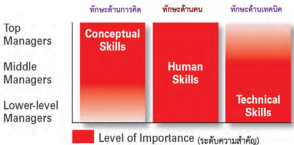
ภาพที่ ๓ ทักษะการบริหาร

มิติที่สอง ทักษะการบริหาร (management skills) เมื่อทราบว่าบทบาทการบริหารของคนในองค์กรจะต้องปฏิบัติงานอะไรแล้ว สิ่งที่สำคัญต่อมาคือ ต้องมีความรู้และทักษะที่จะปฏิบัติงานตามบทบาทนั้นๆ ได้ ดังนั้น ทักษะการบริหารจึงมีความสำคัญที่คนในองค์กรจะต้องเรียนรู้ฝึกฝนให้เกิดความชำนาญจนสามารถนำไปปฏิบัติจริงได้ โดยทั่วไปทักษะการบริหารสามารถแบ่งออกได้เป็น ๓ ทักษะ ได้แก่ ทักษะด้านการคิด ทักษะด้านคน และทักษะด้านเทคนิค โดยมีรายละเอียดพอเป็นสังเขป ได้ดังนี้ (Robbins & Coulter, 2012) (แสดงตามภาพที่ ๓)