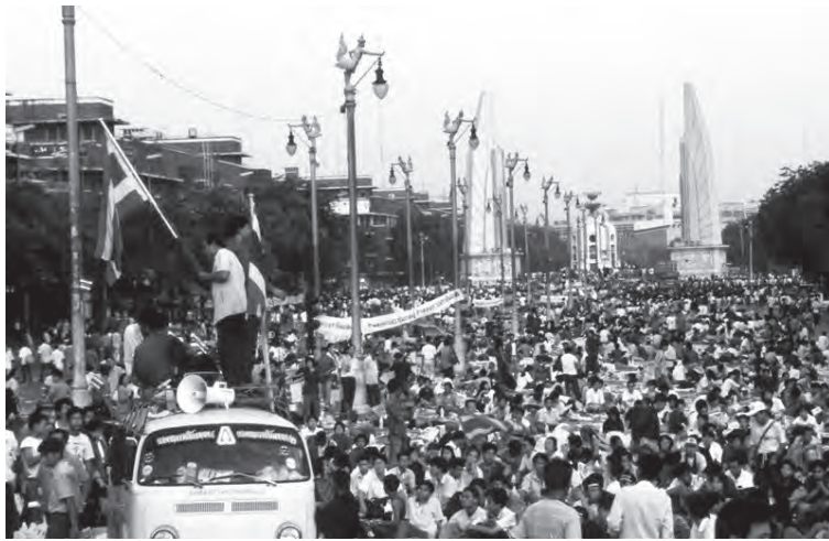
กลุ่มผู้ชุมนุมบริเวณถนนราชดำเนินในเหตุการณ์ “พฤษภาทมิฬ ๒๕๓๕”

ภายหลังเหตุการณ์พฤษภาทมิฬ ในปี ๒๕๓๕ เป็นต้นมา ประเทศไทยเริ่มมีความหวังที่จะพัฒนาประชาธิปไตยให้เดินไปข้างหน้า โดยเหล่าทหารเข้ากรมกองมิได้มีบทบาทในทางการเมือง