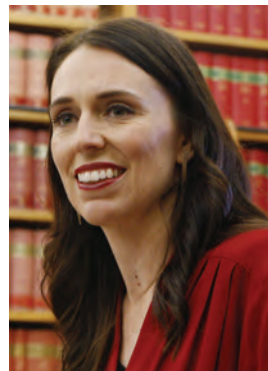
จาซินดา อาร์เดิร์น

๒) จาซินดา อาร์เดิร์น (Jacinda Ardern) นายกรัฐมนตรีนิวซีแลนด์ ที่ได้รับคำชมจากนานาชาติอย่างล้นหลาม และการชื่นชมจากประชาชนในประเทศด้วยการเลือกให้ชนะเลือกตั้งเป็นสมัยที่ ๒ ตลอดการทำงานในตำแหน่งผู้นำประเทศ เธอได้ดำเนินนโยบายต่าง ๆ ที่หลากหลาย และ “แปลกใหม่” ทั้งการรับมือผู้ก่อการร้ายที่นำไปสู่การปฏิรูปกฎหมายครอบครองอาวุธปืน การส่งเสริมสิ่งแวดล้อมผลักดันปัญหาสภาพอากาศในเวทีโลก การสนับสนุนความหลากหลายทางเพศ และการสร้างงานต่าง ๆ และในขณะที่ประเทศต้องรับมือกับโรคระบาด อาร์เดิร์นก็ตัดสินใจได้ “เฉียบขาด”