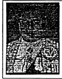
พลตำรวจโท วรณรัตน์ ศชรักษ์