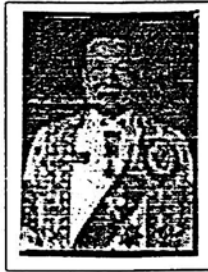
พลตำรวจโท วิโรจน์ เปาอินทร์