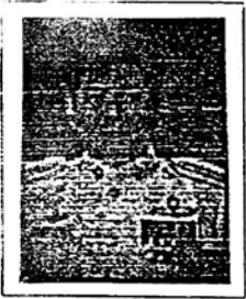
พันตำรวจโท อุดลย์ บุญเสรรฐ