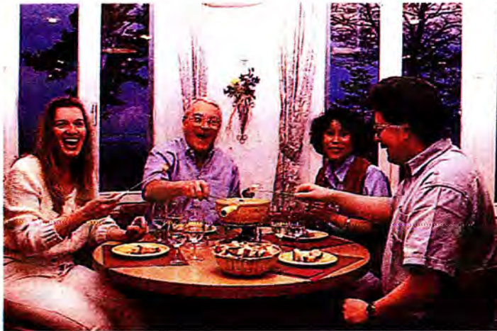
การรับประทานอาหารฟองดู (Fondue) อาหารชนิดหนึ่งของชาวสวิส