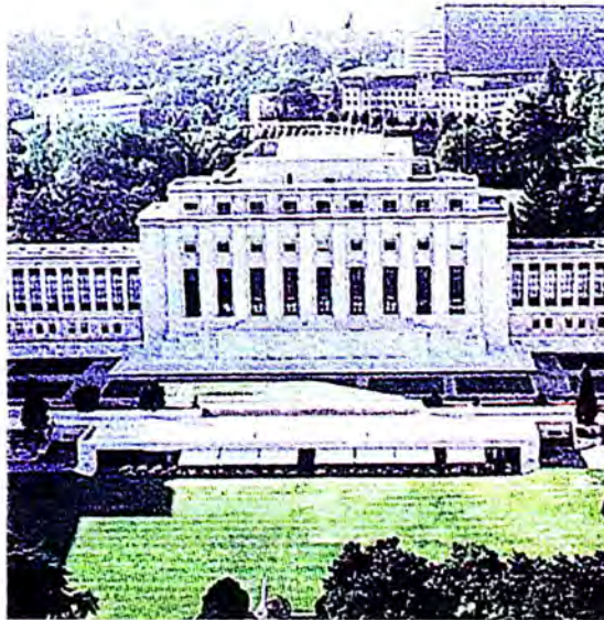
สหประชาชาติ ณ นครเจนีวา

ที่ประชุมรับรองงบประมาณสำหรับปี พ.ศ. 2546 ซึ่งเป็นไปตามกิจกรรมภายใต้สหภาพรัฐสภาที่ปฏิรูปแล้ว อนุมัติงบประมาณ จำนวน 9,467,600 ฟรังก์สวิส ซึ่งต้องได้รับค่าบำรุงสมาชิกเพิ่มอีก 7 เพอร์เซ็นต์