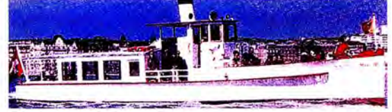
ล่องเรือในทะเลสาบเจนีวา (Lake Le Man)