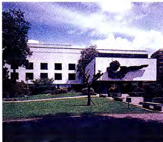
พิพิธภัณฑ์ประวัติศาสตร์ธรรมชาติ

(u) กำหนดนโยบายการพัฒนาที่เกี่ยวข้องภายในประเทศ และการประสานงานของฝ่ายต่าง ๆ ที่เกี่ยวข้องมากยิ่งขึ้น