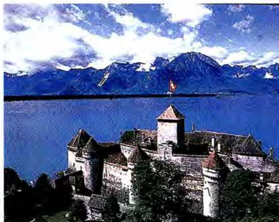
ปราสาท Castle de Chillon ริมหทะเลสาบเจนีวา

1. คณะกรรมการบริหารรับรองข้อเสนอที่จะแนะนำให้คณะมนตรีสหภาพรัฐสภาพิจารณา การสมัครเข้าเป็นสมาชิกอีกครั้งของฟิจิ ซึ่งเป็นสมาชิกกลุ่มเอเชีย-แปซิฟิก