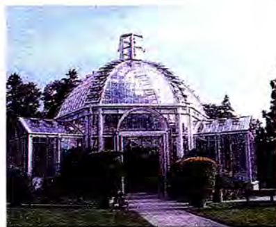
สวนพฤกษศาสตร์นครเจนีวา