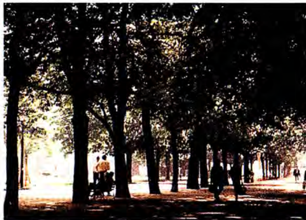
สวนสาธารณะในนครเจนีวา