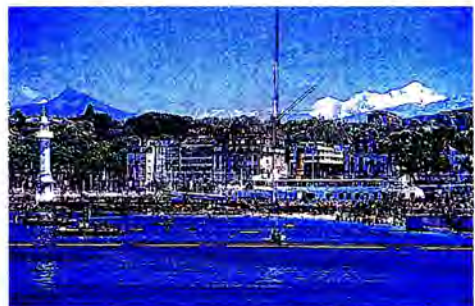
ท่าเรือทะเลสาบเจนีวา (Lake Le Man)

ที่ประชุมรับรองระเบียบวาระการประชุม โดยบรรจุระเบียบวาระเพิ่มเติม คือ “การแก้ไขข้อบังคับสมาคมเลขาธิการรัฐสภา” และได้พิจารณาข้อเสนอจากคณะผู้แทนสวีตเซอร์แลนด์เกี่ยวกับ “ปฏิบัติการรัฐสภาเพื่อสนับสนุนการจัดตั้งศาลอาญาระหว่างประเทศ ซึ่งมีข้อบังคับที่เป็นสากลและปรับใช้ได้อย่างกว้างขวาง” โดยคณะกรรมการบริหารสหภาพรัฐสภาไม่เห็นด้วย เพราะเป็นประเด็นที่ซับซ้อนเกินกว่าที่จะให้มีการดำเนินการที่เพียงพอในช่วงเวลาขณะนี้ ที่ประชุมได้ลงมติไม่เห็นด้วย ข้อเสนอจึงตกไป