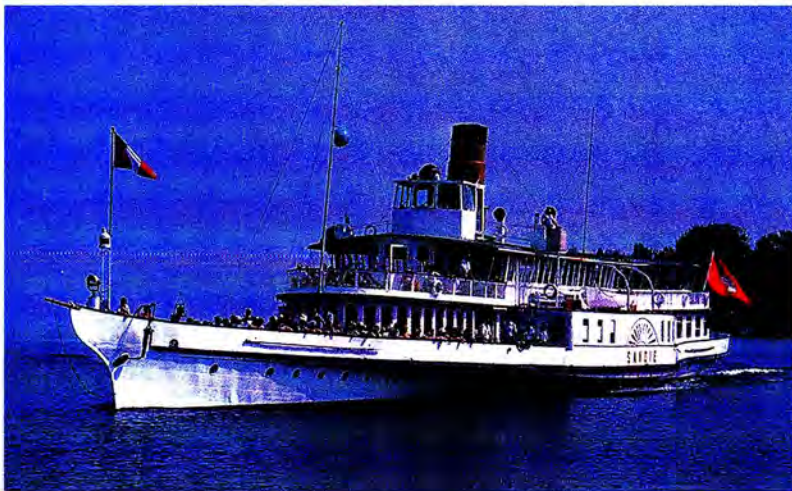
เรือท่องเที่ยวในสมาพันธรัฐสวิส

สินค้าเข้าสำคัญ ได้แก่ เครื่องมือเครื่องใช้เกี่ยวกับวิทยาศาสตร์การแพทย์ เครื่องเพชร พลอยอัญมณีเงินแท่งและทองคำ เครื่องจักรใช้ในอุตสาหกรรม ผลิตภัณฑ์เวชกรรมและเภสัชภัณฑ์ เครื่องจักรไฟฟ้าและส่วนประกอบ เคมีภัณฑ์ แผงวงจรไฟฟ้า ผลิตภัณฑ์โลหะ แก้วและผลิตภัณฑ์ เครื่องปั้นดินเผา และเครื่องใช้ไฟฟ้า เป็นต้น