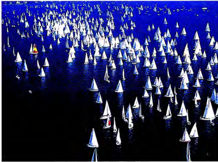
การแล่นเรือใบในทะเลสาบเจนีวา

10. ประธานเก็บรวบรวมและแจกบันทึกการประชุมให้รัฐสภาสมาชิก เมื่อปิดการประชุม สหภาพรัฐสภาแต่ละครั้ง