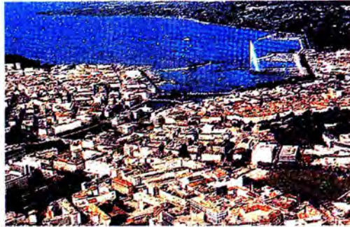
น้ำพุ Jet d'eau สัญลักษณ์ของนครเจนีวา