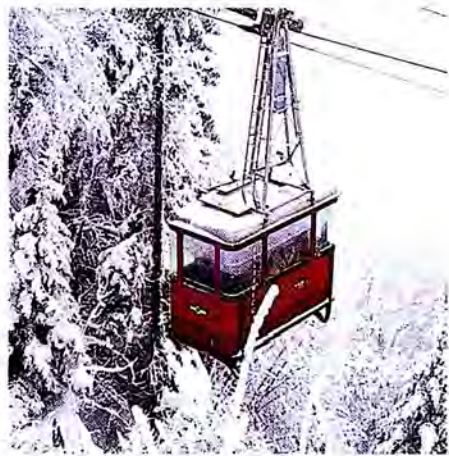
กระเช้าไฟฟ้าขึ้นยอดเขาในสวิตเซอร์แลนด์

5. มีมติให้กำกับดูแลการติดตามผลข้อมติในปัจจุบันและเรียกร้อง ให้ผู้เสนอรายงานจัดทำรายงานเกี่ยวกับการติดตามผลเสนอต่อสหภาพรัฐสภาในโอกาสต่อไป