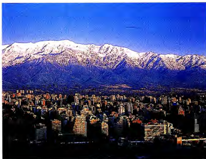
กรุงซานติอาโก สาธารณรัฐชิลี

1) การประชุมคณะกรรมการเตรียมการหลังการประชุมโดฮา ครั้งที่ 2 จัดโดยสหภาพรัฐสภา และรัฐสภายุโรป ณ นครเจนีวา (ศูนย์ประชุมนานาชาติ) สมาพันธรัฐสวิส วันที่ 14-15 ตุลาคม 2545