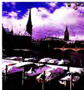
นครซูริค

Free Democratic Party (FDP), Christian Democratic Peoples Party (CVP), Social Democratic Party (SP), Swiss Peoples Party (SVP), Liberal Party (LP)