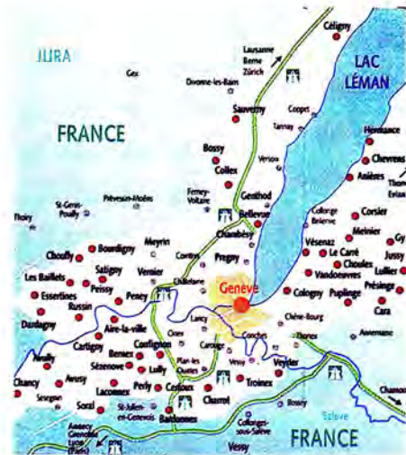
แผนที่สมาพันธรัฐสวิส

ภาษาราชการมี 4 ภาษา คือ เยอรมัน (ร้อยละ 64) ฝรั่งเศส (ร้อยละ 19) อิตาลี (ร้อยละ 8) โรมานซ์ (ร้อยละ 1) อื่น ๆ ร้อยละ 8