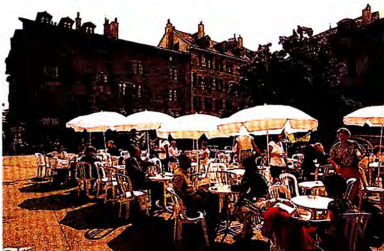
ร้านกาแฟในนครเจนีวา

- ในแต่ละปีจะมีการประชุมใหญ่สหภาพรัฐสภาเพียง 1 ครั้ง ซึ่งจะจัดขึ้นในฤดูใบไม้ผลิและหมุนเวียนไปตามประเทศสมาชิกต่าง ๆ และในเดือนกันยายนของทุกปีจะมีการจัดการประชุมคณะมนตรีสหภาพรัฐสภาในนครเจนีวา สำหรับการประชุมสหภาพรัฐสภาครั้งต่อไปจะจัดขึ้นในเดือน