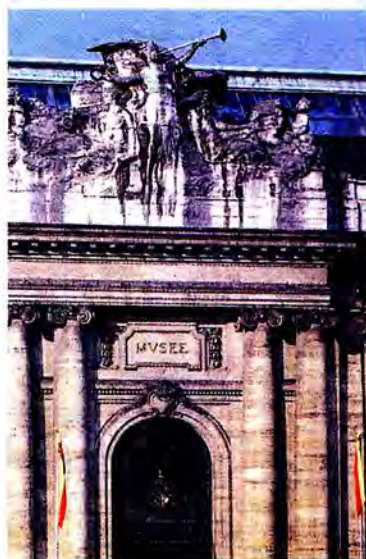
หอศิลป์และประวัติศาสตร์นครเจนัว

การค้าเด็ก ซึ่งจะมีขึ้นที่ซิดนีย์ และพิจารณาการเสนอขอแก้ไขข้อบังคับการประชุมสมาชิกรัฐสภาสตรี เพื่อส่งเสริมการเข้าร่วมของสมาชิกรัฐสภาชาย