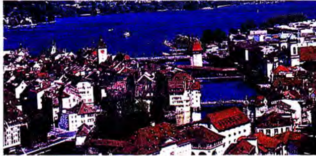
เมืองโลซานน์