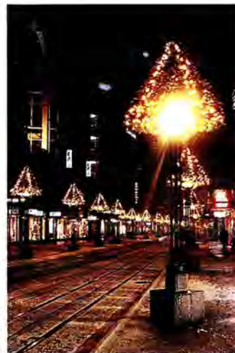
เงินไวยามค่าคืน

(o) ตรากฎหมายซึ่งส่งเสริมการค้าเสรีและยุติธรรม ให้มีการเข้าถึงตลาดของ