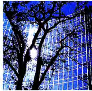
สถานที่ราชการสมาพันธรัฐสวิส

ในการบริหารราชการส่วนกลาง อำนาจบริหารจะอยู่ที่คณะรัฐมนตรีเรียกว่า the Federal Council ซึ่งมีสมาชิกเรียกว่า Federal Councillor (มนตรีแห่งสมาพันธรัฐ) มีทั้งหมด 7 คน ทำหน้าที่ควบคุมบริหารงานในหน่วยงานระดับกระทรวง 7 แห่ง รัฐสภาแห่งสมาพันธรัฐเป็นผู้เลือกมนตรีแห่งสมาพันธรัฐ มีวาระดำรงตำแหน่ง 4 ปี และในจำนวนมนตรีแห่งสมาพันธรัฐทั้ง 7 คน จะได้รับ