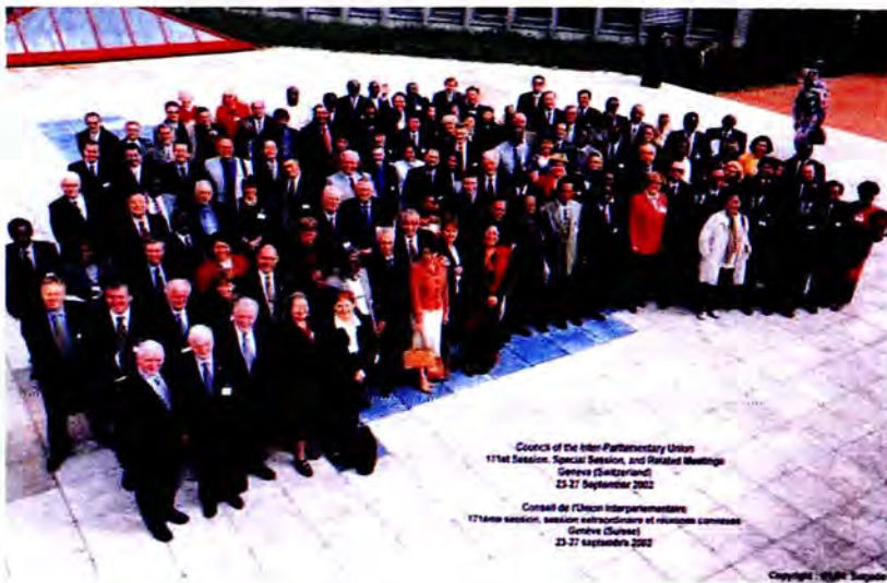
คณะผู้แทนประเทศต่าง ๆ หน้าศูนย์ประชุม

กล่าวถึง ฉันทามติมอนเทอร์เรย์ ซึ่งเป็นผลจากการประชุมระหว่างประเทศว่าด้วยการจัดหาเงินทุนเพื่อการพัฒนา ณ เมืองมอนเทอร์เรย์ ประเทศเม็กซิโก ในเดือนมีนาคม 2545 โดยมีจุดมุ่งหมายเพื่อขจัดความยากจนบรรลุลูกการเติบโตทางเศรษฐกิจและส่งเสริมการพัฒนาที่ยั่งยืน ภาพรวมเกี่ยวกับการจัดหาเงินทุนเพื่อการพัฒนา กล่าวถึงความเป็นมา สถานภาพและความจำเป็นของการจัดหาเงินทุนเพื่อพัฒนาผลการประชุมมอนเทอร์เรย์ ซึ่งแบ่งเป็น 3 ส่วนที่สำคัญส่วนหนึ่งแนวทางดำเนินการร่วมเพื่อแก้ไขปัญหาความยากจน และการบรรลุการพัฒนาที่ยั่งยืนตามที่กำหนดไว้ในปฏิญญาสหประชาชาติ ส่วนที่สองปฏิบัติการหลักเรียกร้องให้เกิดการระดมทรัพยากรเงินทุนภายในประเทศเพื่อการพัฒนา การระดมทรัพยากรระหว่างประเทศเพื่อการพัฒนา การส่งเสริมการค้าระหว่างประเทศในฐานะตัวจักรสำคัญสำหรับการพัฒนา การเพิ่มความร่วมมือทางการเงินระหว่างประเทศและวิชาการ รวมถึงความช่วยเหลือเพื่อการพัฒนาทางการ (Official Development Assistance - ODA) การบรรเทาหนี้สินต่างประเทศ และการแก้ไขปัญหาที่เกี่ยวข้องระบบ เช่น การปรับโครงสร้างการเงินระหว่างประเทศ และส่วนที่สาม ติดตาม การดำเนินงานตาม