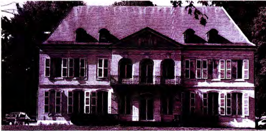
สำนักงานใหญ่สหภาพรัฐสภา