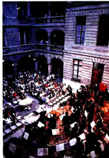
การใช้ชีวิตวันหยุดของชาวสวิส