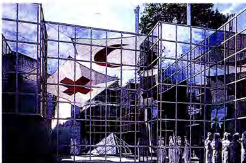
พิพิธภัณฑ์องค์การกาชาดสากลนครเจนีวา

คณะผู้แทนญี่ปุ่นได้เสนอหัวข้อเรื่องการป้องกันการก่อการร้ายแต่มีผู้แทนบางประเทศได้สงวนในประเด็นของการตีความของ “การสร้าง ความเชื่อมั่นในภูมิภาคเอเชีย-แปซิฟิก” โดยให้ตีความก่อนที่จะได้พิจารณาเรื่องนี้ ในประเด็นนี้ ผู้แทนไทยได้เสนอความคิดเห็นต่อที่ประชุมให้กลุ่มอาเซียน+3 หาหรือกันและตีความในบริบทของการสร้างความเชื่อมั่นในภูมิภาคเอเชียและแปซิฟิก ซึ่งที่ประชุมก็เห็นชอบตามที่ผู้แทนไทยเสนอ และภายหลังการหาหรือที่ประชุมได้เห็นชอบให้มีการพิจารณาหัวข้อต่อไปนี้ในการประชุมครั้งต่อไปที่สาธารณรัฐชิลี