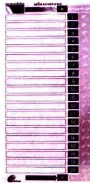
ภาพเครื่องลงคะแนน