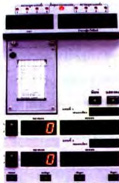
ภาพเครื่องรวมคะแนน