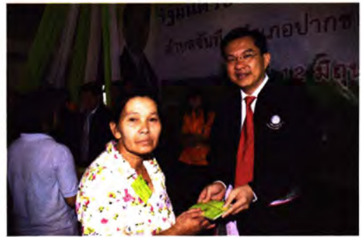
มอบสัญญาเช่าที่ราชพัสดุแก่ราษฎรผู้ได้รับสิทธิตามโครงการนำที่ดินราชพัสดุ สนับสนุนปลูกพืชอาหารและพืชทดแทนพลังงาน ณ ศาลาประชาคมเมืองปากช่อง จ.นครราชสีมา เมื่อวันที่ 12 มิถุนายน 2552 ▲