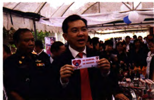
▲ เปิดงานนิทรรศการและกิจกรรมตามโครงการ Family Day Say No รวมพลังครอบครัวไทย ร่วมขจัดภัยเหล้า บุหรี่ ณ ศาลาประชาคมเมืองปากช่อง จ.นครราชสีมา เมื่อวันที่ 12 มิถุนายน 2552